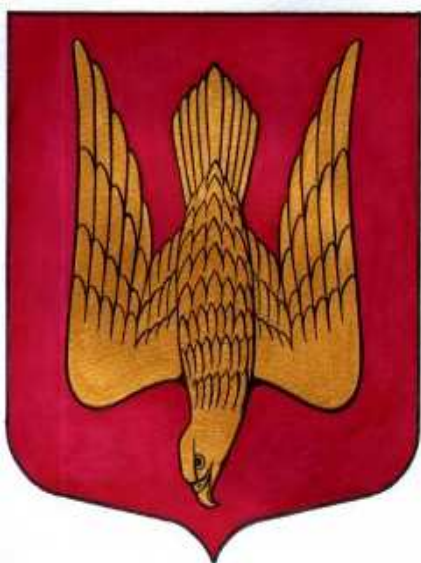
Герб Старой Ладогы

– Сопротивление местных властей. К сожалению, муниципальные депутаты часто не понимают сути геральдики. Что они видят вокруг, то и хотят поместить на гербы. Видят реку – значит, нужно волны нарисовать. В волнах – рыбу. И сверху – чайку. Чайку обязательно! Это самое частое, что у нас просят. И еще якоря – такие же, как на городском гербе. Мы упираемся категорически: нет, это нельзя! Волны в гербах считаются пошлостью, дурным тоном. Потому что их очень много. Как и чаек. Если бы это все реализовывалось, наступил бы конец геральдике.