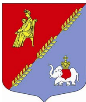
Герб Кобринского сельского поселения

Если у территории есть утвержденный исторический герб, его нельзя изменять. Уже если сделано – то сделано на века. Например, в России есть гербы с побегами конопли или с куском мыла. В Ленинградской области есть герб со слоном – в Кобрине (Гатчинский район). В тех местах были владения рода Ганнибалов, герб которых содержал слона. В XVIII веке в гербе Выборга тоже был слон. Этот символ трактовался как «Ни на кого не надеюсь, кроме как на самого себя». И этот девиз перешел затем Выборгскому полку в 1712 году. Знамя Выборгского полка со слоном использовалось до 1730 года.