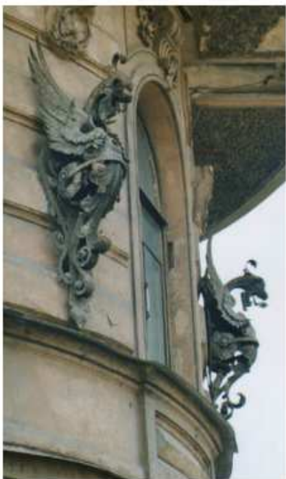
Химеры. Встречаются в Введенском округе

при раскопках в Старой Ладоге нашли старинные печати с подобным рисунком. То есть получился греб, который максимально соответствует традиции. Самым почетным в геральдике считается, когда современный герб выглядит так, как будто создан много веков назад.