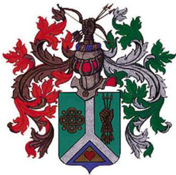
Герб С.К. Шойгу