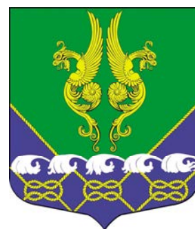
Герб Введенского округа химерами

Многим, когда они видят классические гербы, кажется, что они несут угрозу. Потому что у изображенных животных высунуты языки, растопырены когти, взъерошена шерсть. Но это всего лишь дань традиции, это символы