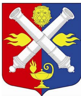
Герб МО Финляндский округ