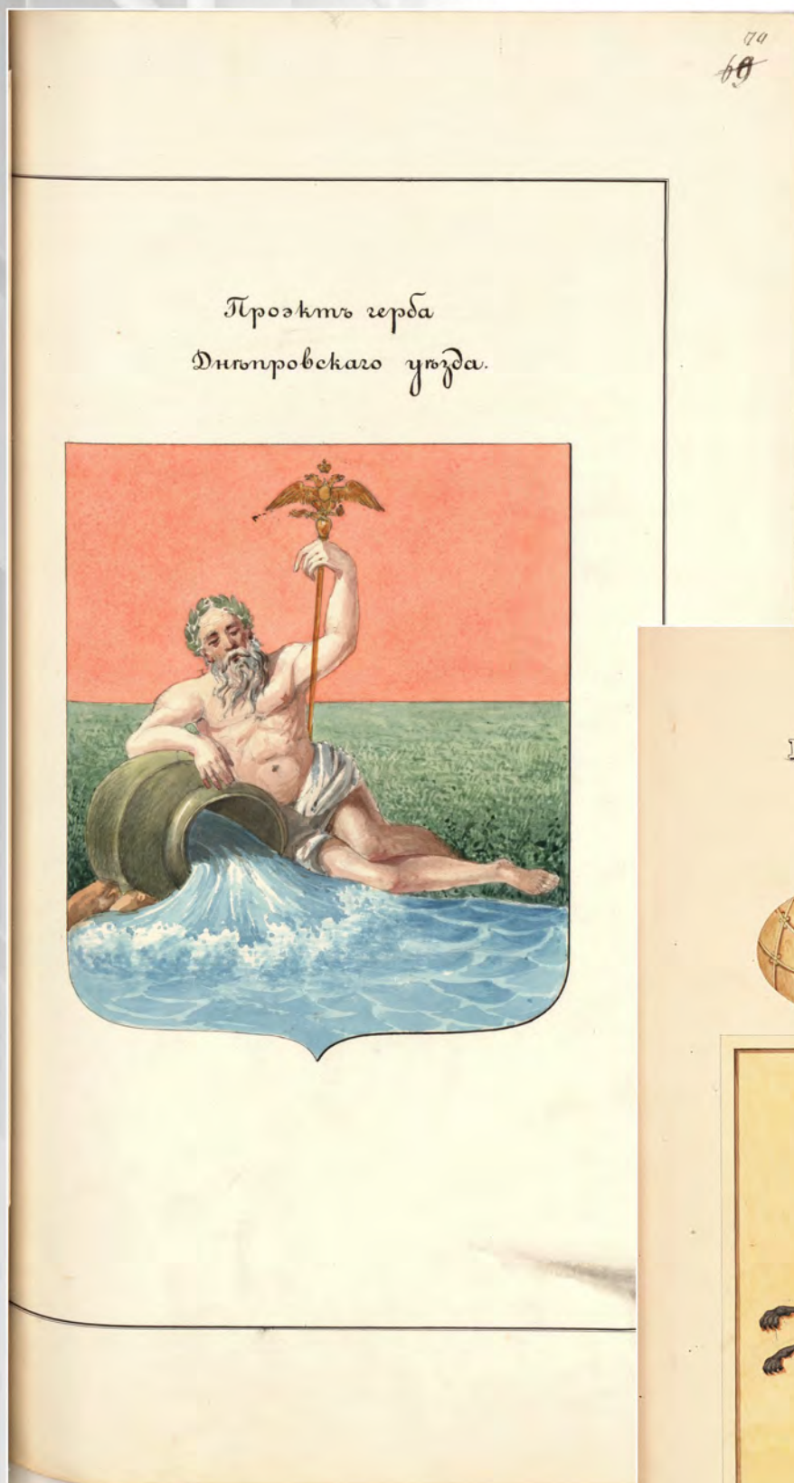
Илл. 4. Проект герба Днепровского уезда. 1843 г. РГИА. Ф. 1343. Оп. 15. Д. 228. Л. 70. Публикуется впервые.

Иллюстрация к статье Росича Ю.Ю. «ГЕРБЫ ГОРОДОВ ТАВРИЧЕСКОЙ И ХЕРСОНСКОЙ ГУБЕРНИЙ В 1-й ПОЛОВИНЕ XIX В.» (с. 140–145)