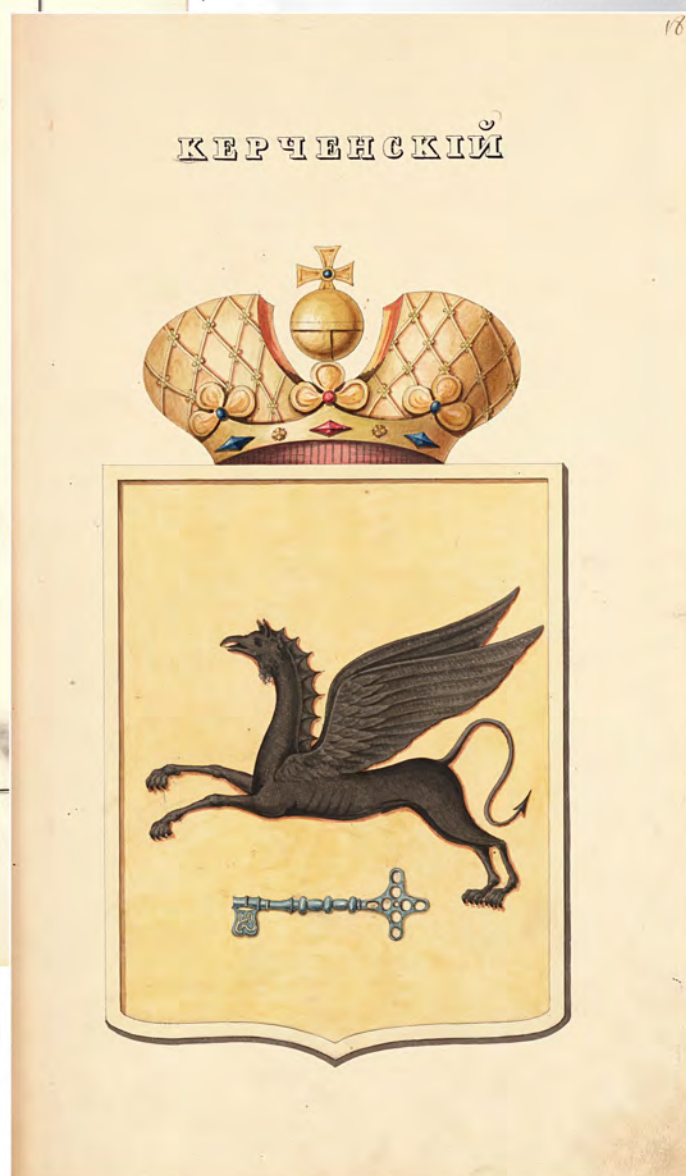
Рис. 1. Проект герба города Керчи. 1840 г. РГИА. Ф. 1343. Оп. 15. Д. 228. Л. 18. Полноцветное изображение публикуется впервые.

Иллюстрация к статье Росича Ю.Ю. «ГЕРБЫ ГОРОДОВ ТАВРИЧЕСКОЙ И ХЕРСОНСКОЙ ГУБЕРНИЙ В 1-й ПОЛОВИНЕ XIX В.» (с. 140–145)