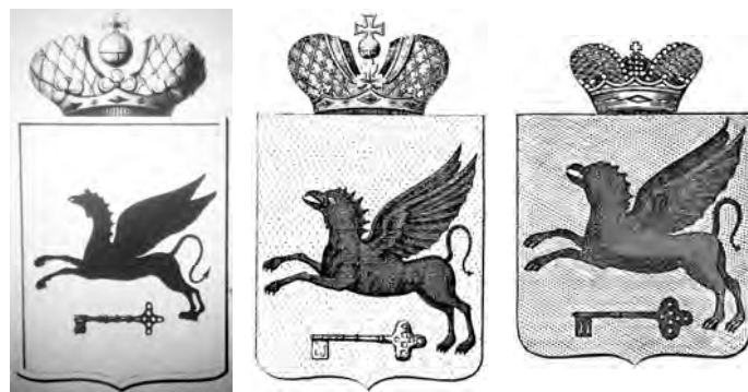
Рис. 11. Герб города Керчи: слева – проект из архивного дела (фрагмент кадра микрофильма) [1, л. 18], 1840; в центре – рисунок из ПСЗ 11 , 1881; справа – рисунок из книги П.П. фон Винклера (1900) 12 . [6, с. 65].

Несомненно, что именно из-за этого своего особого статуса, в некоторой мере равного губернскому, и из-за утверждения герба именно в 1840-х годах, Керчь стала единственным городом-градоначальством, герб которого увенчала императорская корона 9 (рис. 1 на с. 72). Черно-белый рисунок проекта герба Керчи (в низком разрешении в виде фрагмента кадра с микрофильма) из архивного дела ранее уже публиковался 10 , а полноцветное изображение публикуется впервые .