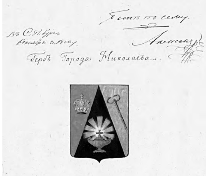
Рис. 14. Фрагмент листа с резолюцией об утверждении герба города Николаева и подписью Александра I, от 03.10.1803 [2, л. 15а]. Публикуется впервые.

Оригинальное изображение герба с собственно-ручной резолюцией «Быть по сему» и подписью Александра I хранится в РГИА в дела «Именные указы Сенату за октябрь 1803 года» – Ф. 1329. Оп. 1. Д. 261 (далее – [2]). Полноцветное изображение Высочайше утвержденного герба города Херсона