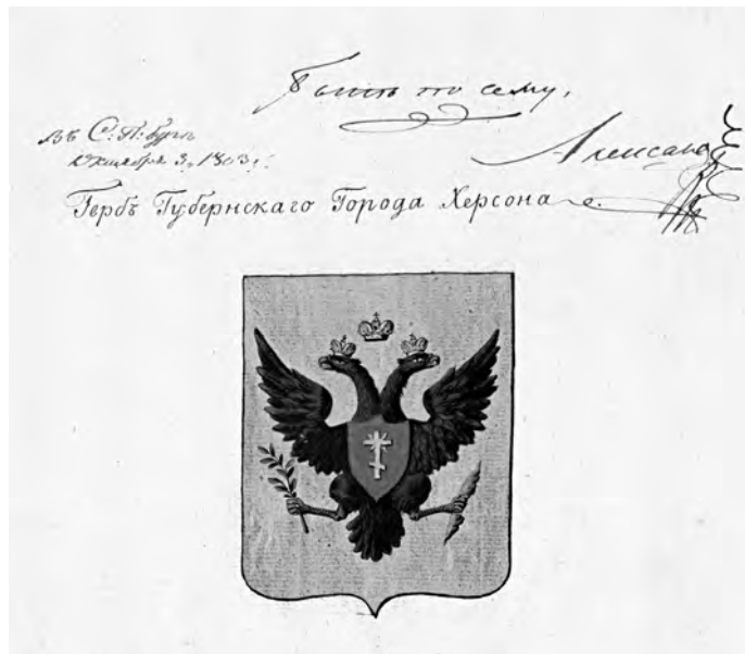
Рис. 13. Фрагмент листа с резолюцией об утверждении герба города Херсона и подписью Александра I, от 03.10.1803 [2, л. 14]. Публикуется впервые.

С аналогичным расположением нижней пере­кладыни крест изображен и в гербе Херсона, Высочайше утвержденного 3 октября 1803 г. в Санкт-Петербурге Александром I.