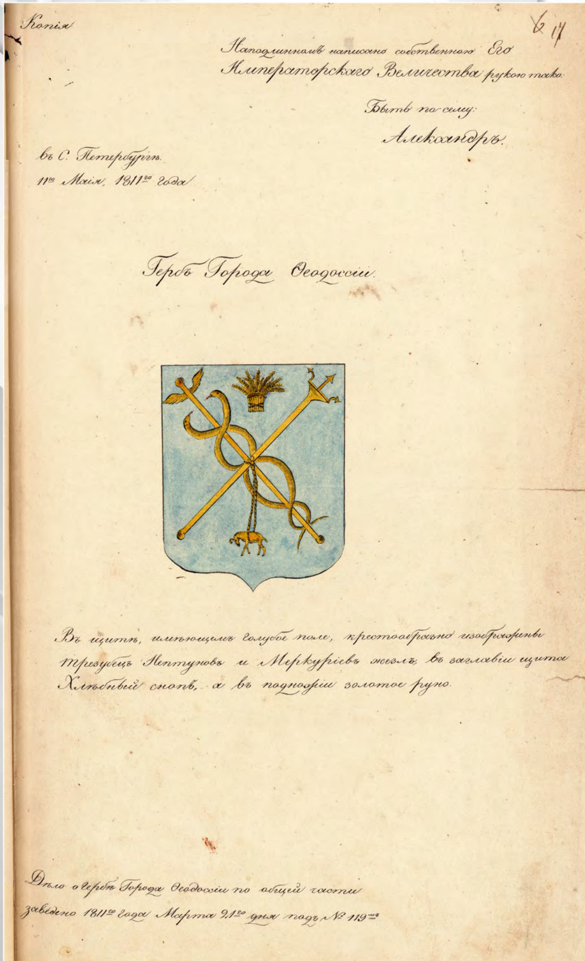
Рис. 2. Герб города Феодосии, Высочайше утвержденный в 1811 г. Копия 1840 г. РГИА. Ф. 1343. Оп. 15. Д. 228. Л. 17. Публикуется впервые.