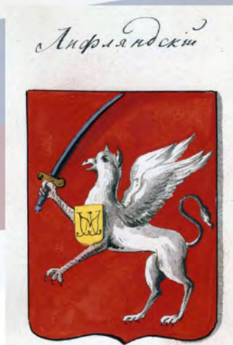
Рис. на листе 14

Для сравнения: рисунки гербов во «Всероссийском гербовнике» (РНБ. Ф. 885. ОР Эрм. 330):