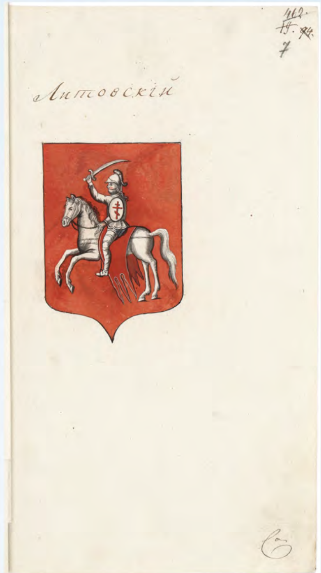
Герб Литовский (в архивном деле о гербах губерний; РГИА. Ф. 1343. Оп. 15. Д. 67. Л. 7). Публикуется впервые.

Для сравнения: герб Литовский во «Всероссийском гербовнике» РНБ (РНБ. Ф. 885. ОР Эрм. 330); слева – рис. на листе 13, справа – рис. на листе 35