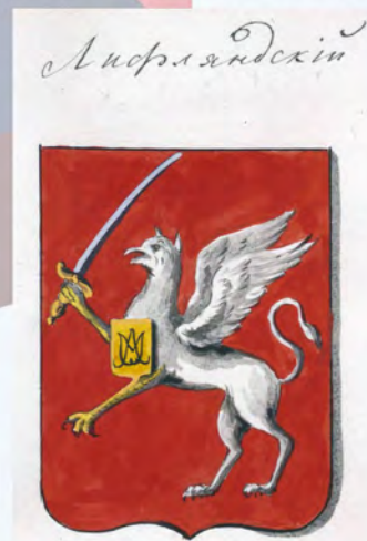
Рис. на листе 33