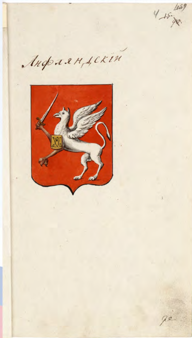
Герб Лифляндский (в архивном деле о гербах губерний; РГИА. Ф. 1343. Оп. 15. Д. 67. Л. 4). Публикуется впервые.