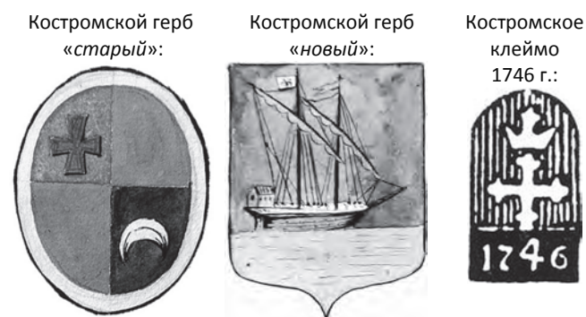
Рис. 3. Костромские «старый» и «новый» гербы 20 , а также костромское клеймо 1746 г. 21

К примеру, там указано, что для Новороссийской губернии сначала были предложены на выбор гербы города Азова и Таврической области (т.к. в состав Новороссийской губернии вошли Азовское наместничество и Таврическая область, при этом у существовавшего до того с 1783 г. Екатеринославского наместничества герба не было). Но как следует из рисунка (цв. рис. на с. 86) 19 во втором деле, император самолично внес изменения и нарисовал иной герб (о чем говорит надпись « нарисован собственноручно Его Императорским Величеством »). Много ли вообще в России гербов, которые были нарисованы самим императором?! Хотя и самоочевидно, что новороссийский герб является в некотором роде упрощением Таврического герба и создан по мотивам его малого щитка (того, что расположен на груди двуглавого орла) – т.е. с сохранением в лазури креста в сиянии, но крест при этом был заменен простым равноконечным (который в блазонировании называется греческим).