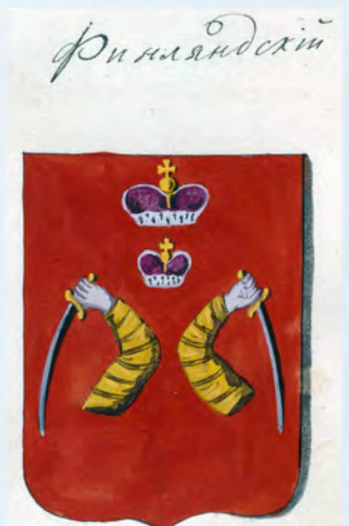
Рис. на листе 47