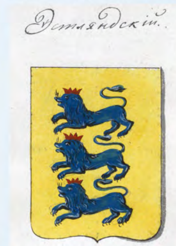
Рис. на листе 47