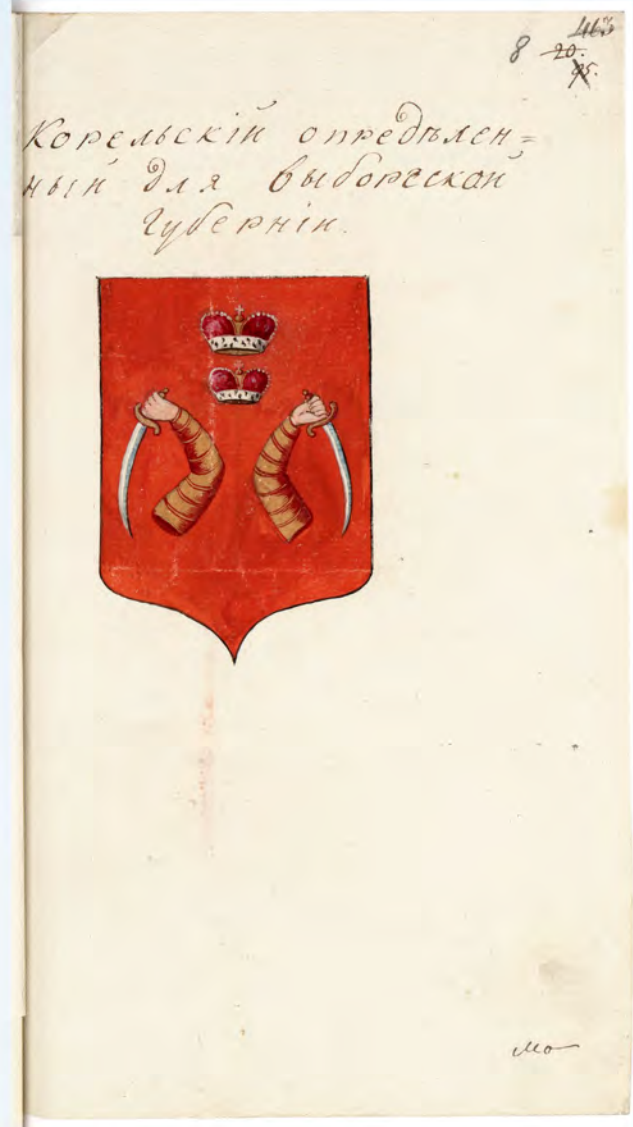
Герб Корельский, определенный для Выборг- ской губернии (в архивном деле о гербах губерний; РГИА. Ф. 1343. Оп. 15. Д. 67. Л. 8). Публикуется впервые.

Для сравнения: рисунки гербов во «Всероссийском гербовнике» (РНБ. Ф. 885. ОР Эрм. 330):