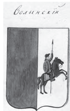
Рис. 5. Волыньский герб, изображенный в рукописи «Всероссийский гербовник» (РНБ. Ф. 885. Эрм 330. Л. 13).

Таким образом, даже если при Павле I и рассматривался вариант изменения волыньского герба, но до утверждения такой проект не дошел 32 . В пользу этой версии говорит и отсутствие значительного числа материальных артефактов с изображением именно такого рассеченного волыньского герба (например, на мундирных пуговицах). А ведь для всех прочих семи губернских гербов (которые точно были утверждены Павлом I), таких артефактов известно огромное число (один из