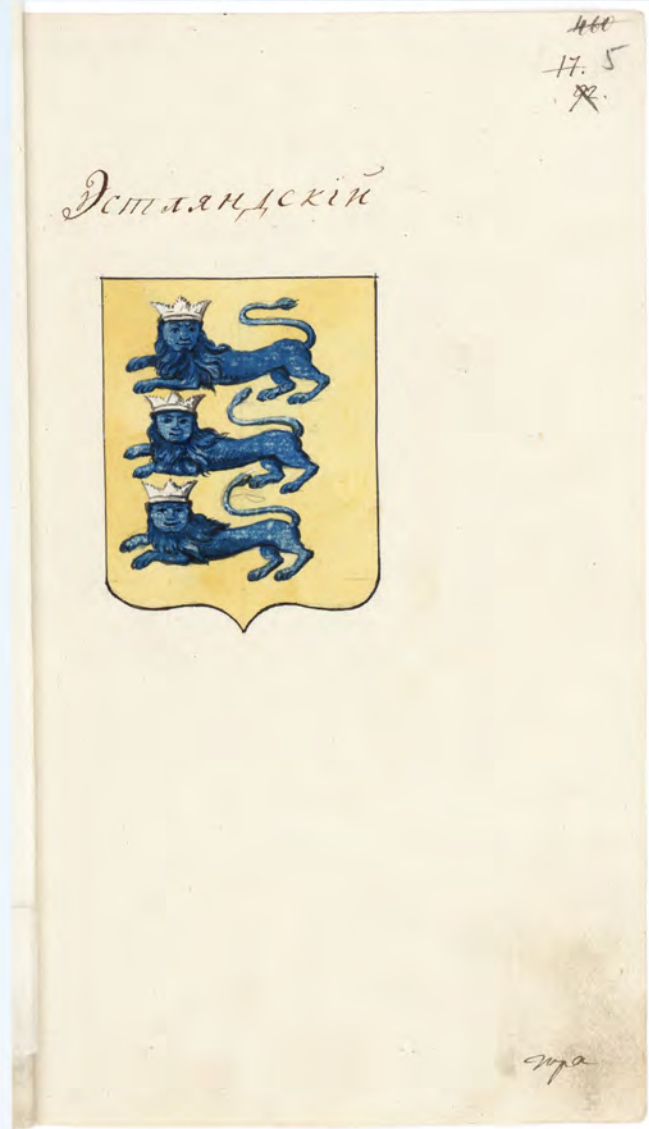
Герб Эстляндский (в архивном деле о гербах губерний; РГИА. Ф. 1343. Оп. 15. Д. 67. Л. 5). Публикуется впервые.

Для сравнения: рисунки гербов во «Всероссийском гербовнике» (РНБ. Ф. 885. ОР Эрм. 330):