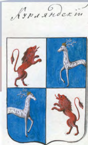
Рис. на листе 14

Для сравнения: рисунки гербов во «Всероссийском гербовнике» (РНБ. Ф. 885. ОР Эрм. 330):