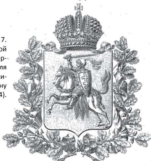
Рис. 7. Герб Виленской губернии, утвержденный 5 июля 1878 г. (ПСЗ, приложение к закону № 58684).

К числу «доживших» до 1917 г. в статусе губернских гербов можно отнести только литовский и все три остзейских герба. При этом только литовский герб впоследствии получил Высочайшее переутверждение – сначала как герб города Вильны в 1845 г. вместе с гербами прочих городов Виленской губернии (и, по сути, и как герб самой губернии) 33 . Среди утвержденных гербов губерний в 1878 г. 34 герб Виленской губернии (рис. 7) также оказался единственным из всей «группы».