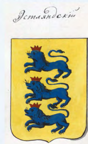
Рис. на листе 12