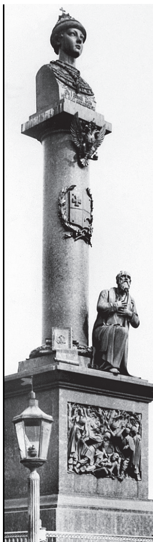
Рис. 6. Памятник в Костроме царю Михаилу Федоровичу Романову и Ивану Сусанину, с гербом Костромской губернии; был открыт 14 марта 1851 г. (прим.: снесен большевиками в 1918 г.)

Новороссийская губерния была расформирована в 1802 г., затем герб еще недолго использовался для Екатеринославской губернии, пока в 1811 г. городу Екатеринославу не был пожалован (вместе с другими городами губернии) собственный герб, который и стал с того момента губернским 36 гербом.