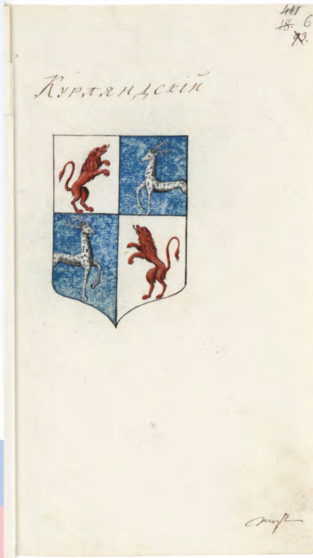
Герб Курляндский (в архивном деле о гербах губерний; РГИА. Ф. 1343. Оп. 15. Д. 67. Л. 6). Публикуется впервые.