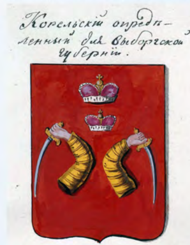
Рис. на листе 10