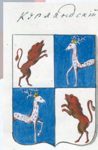
Рис. на листе 45