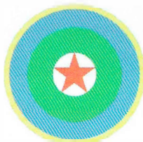
Рис. 9. Эмблема на военной авиационной технике