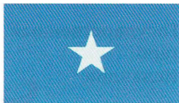
Рис. 3. Флаг Сомали, 12 октября 1954 г.