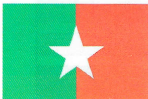
Рис. 10. Флаг Фронта осв. Зап. Сомали