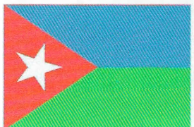
Рис. 4. флаг Движения за республиканский Союз