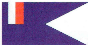
Рис. 2. Флаг французского губернатора в г. Джибути