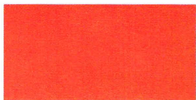
Рис. 1. Флаг на судах дардара Таджуры