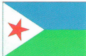
Рис. 6. Флаг Африканской народной Лиги