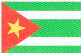
Рис. 5. Флаг Афарского Демократич. Союза