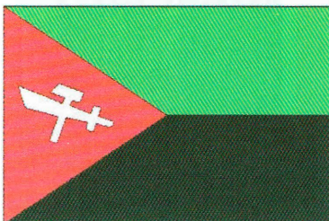
Рис. 7. Флаг Национального Союза за независимость