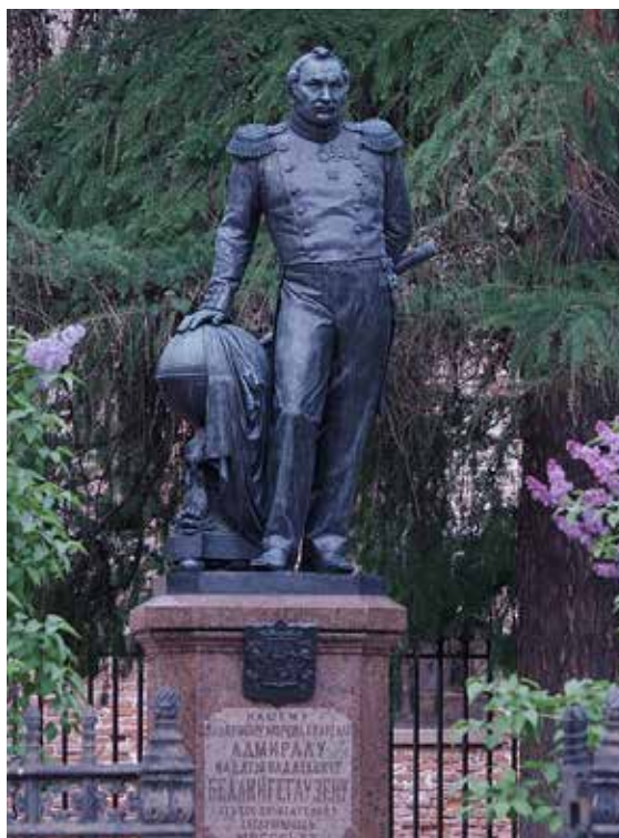
Ил. 2. Памятник Ф. Ф. Беллингаузену. Скульптор И. Н. Шредер, архитектор И. А. Монигетти. 1870. Высота скульптуры 2,1 м. Инв. № пам-136. Государственный музей городской скульптуры