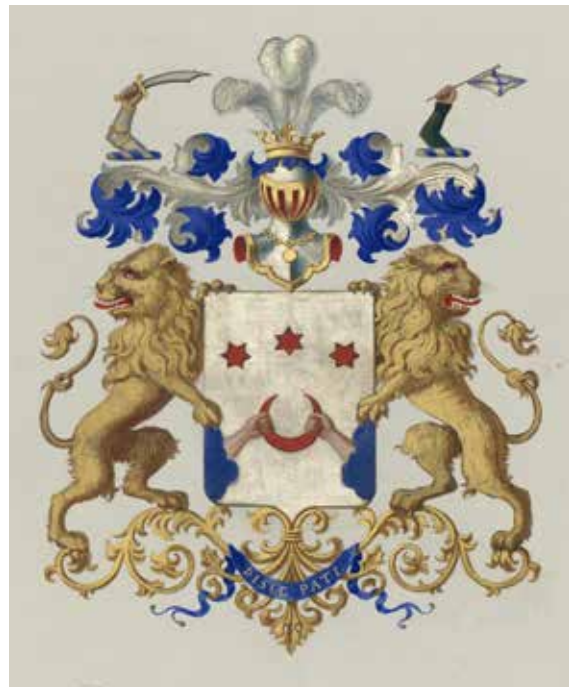
Ил. 6. Герб рода Лазаревых в Части 11 Общего гербовника дворянских родов Всероссийской империи. Ф. 1411. Оп. 1. Д. 101. Л. 28.