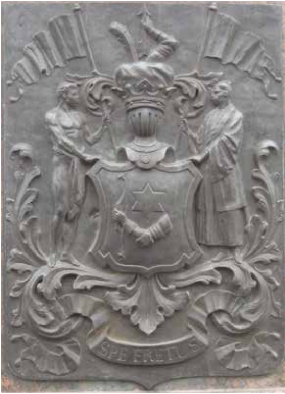
Ил. 10. Герб И. Ф. Крузенштерна. Фрагмент постамента памятника И. Ф. Крузенштерну