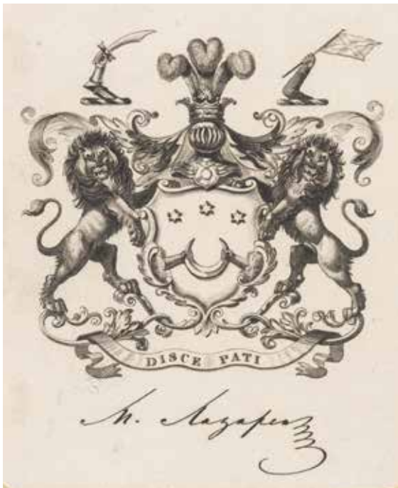
Ил. 5. Эскиз М. П. Лазарева. Воспроизводится по: Roscoe T. The tourist in Spain and Morocco / illustr. from drawings by D. Roberts. London, 1838. На обложке