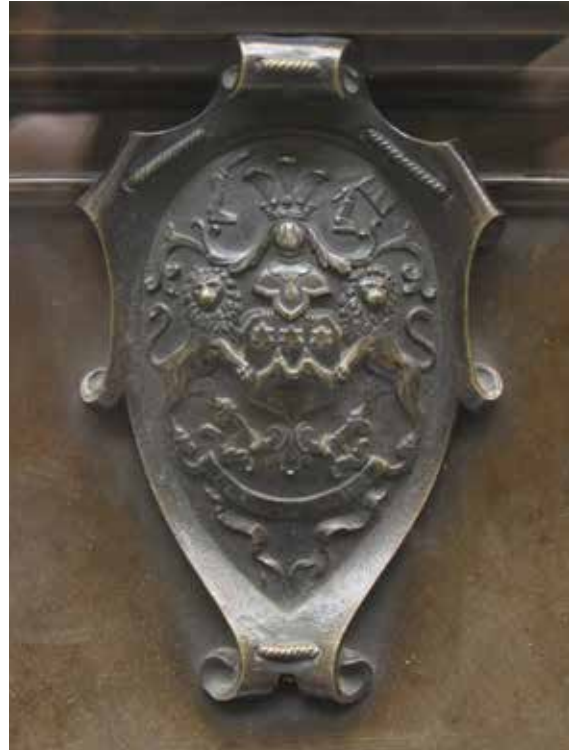
Ил. 4. Герб М. П. Лазарева. Фрагмент модели памятника М. П. Лазареву