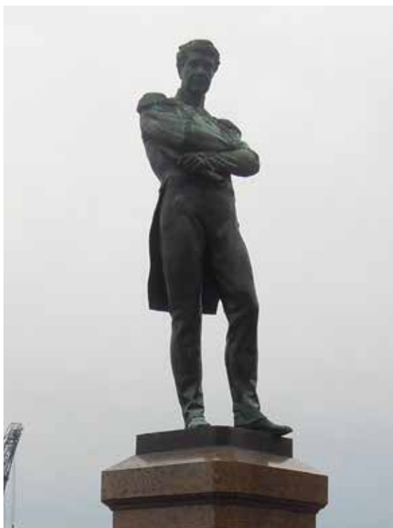
Ил. 1. Памятник И. Ф. Крузенштерну. Скульптор И. Н. Шредер, архитектор И. А. Монигетти. 1873. Высота скульптуры 3 м. Инв. № пам-57. Государственный музей городской скульптуры