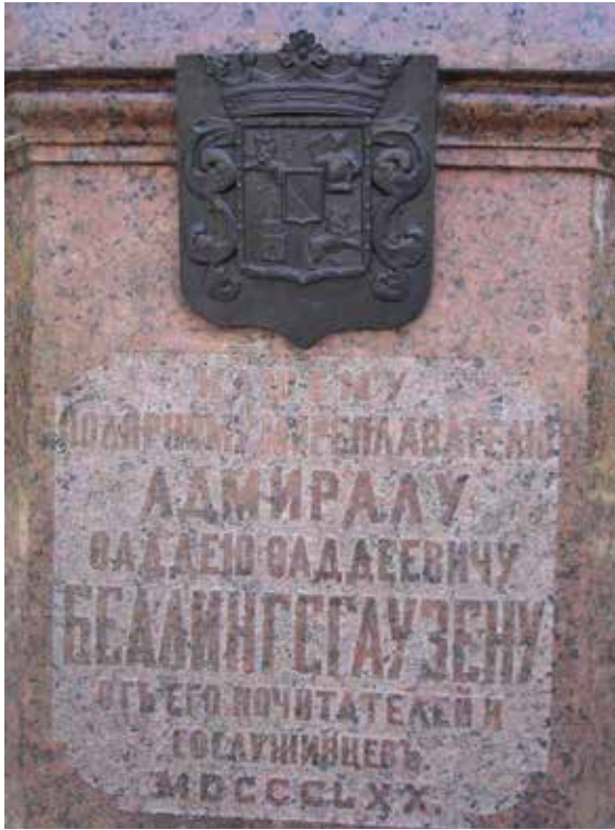
Ил. 7. Герб Ф. Ф. Беллинсгаузена. Фрагмент постамента памятника Ф. Ф. Беллинсгаузену

Лазарев, большой оригинал, мог узурпировать Андреевский флаг. А император потом подтвердил – и узурпированное стало подарком, законно обладаемым (ил. 5).