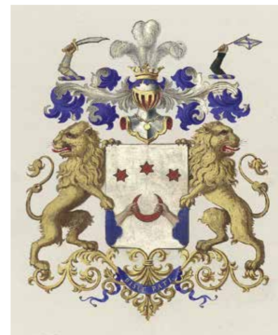
Ил. 6. Герб рода Лазаревых в Части 11 Общего гербовника дворянских родов Всероссийской империи. Ф. 1411. Оп. 1. Д. 101. Л. 28. Российский государственный исторический архив