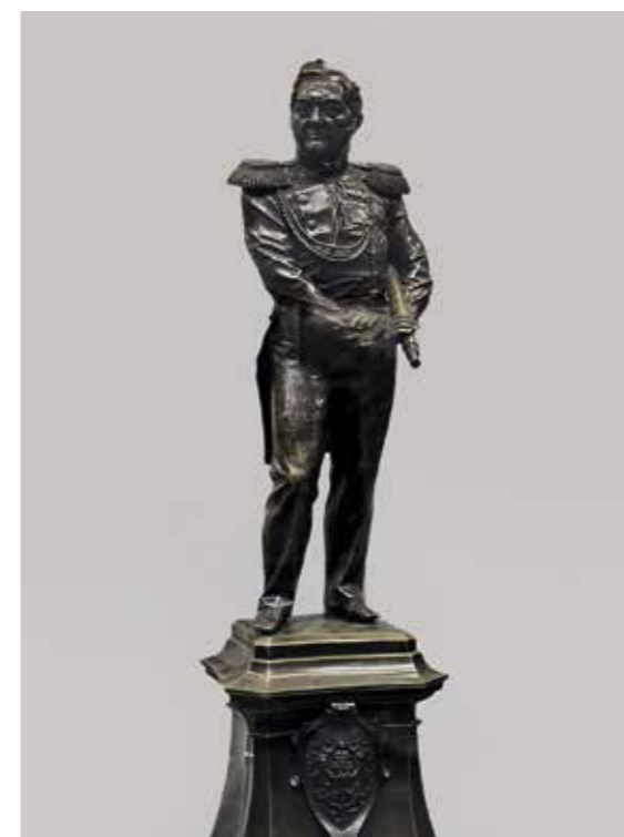
Ил. 3. Модель памятника М. П. Лазареву. Скульптор Н. С. Пименов. Инв. № ЦВММ КП-13993. Центральный военно-морской музей