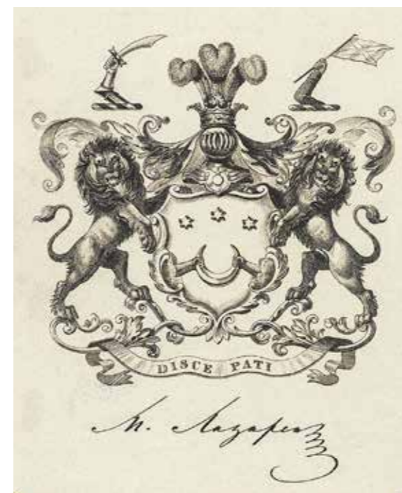
Ил. 5. Экслибрис М. П. Лазарева. Воспроизводится по: Roscoe T. The tourist in Spain and Morocco / illustr. from drawings by D. Roberts. London, 1838. На обложке

Будучи адмиралом с 1843 года, Лазарев мог вставить адмиральский флаг (по рисунку аналогичный общефлотскому) в свой герб как внешний личный атрибут, а англичанин-художник мог переделать это во второй нашлемник; или