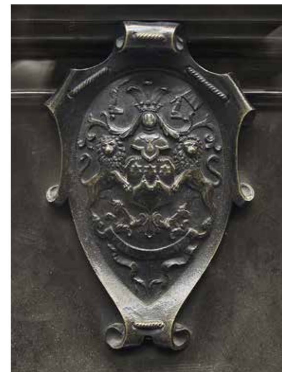
Ил. 4. Герб М. П. Лазарева. Фрагмент модели памятника М. П. Лазареву