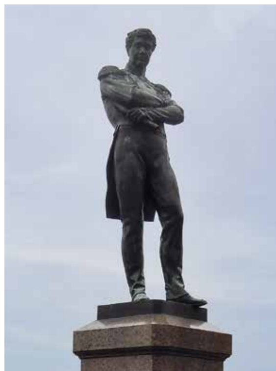
Ил. 1. Памятник И. Ф. Крузенштерну. Скульптор И. Н. Шредер, архитектор И. А. Монигетти. 1873. Высота скульптуры 3 м. Инв. № пам-57. Государственный музей городской скульптуры