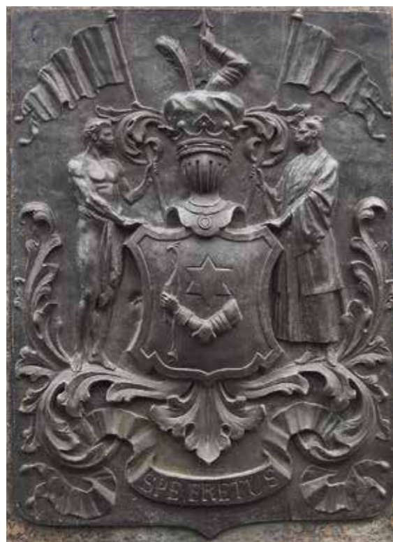
Ил. 10. Герб И. Ф. Крузенштерна. Фрагмент постамента памятника И. Ф. Крузенштерну