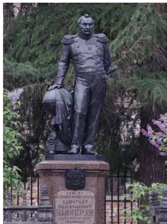
Ил. 2. Памятник Ф. Ф. Беллингаузену. Скульптор И. Н. Шредер, архитектор И. А. Монигетти. 1870. Высота скульптуры 2,1 м. Инв. № пам-136. Государственный музей городской скульптуры