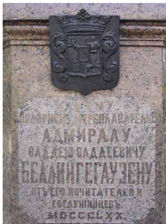
Ил. 7. Герб Ф. Ф. Беллингаузена. Фрагмент постамента памятника Ф. Ф. Беллингаузену

Лазарев, большой оригинал, мог узурпировать Андреевский флаг. А император потом подтвердил – и узурпированное стало подарком, законно обладаемым (ил. 5).