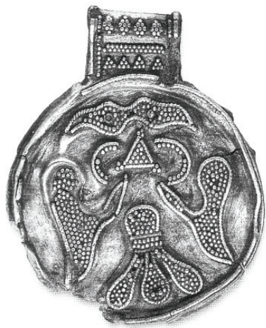
Рис. 1. Подвеска из клада в Гнёздово.