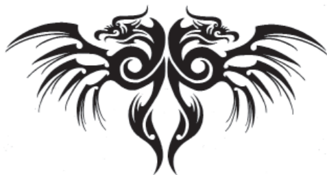
Рис. 18. Двуглавы́й орел в стиле тату.

Первые татуировки найдены на останках людей, живших около 5300 лет назад, но ученые считают, что татуировки появились гораздо раньше. В древности они служили средством для демонстрации своей принадлежности к определенному племени, роду, для акцента на происхождении, высоком общественном положении, а также для того, чтобы уберечь себя от злых духов, сглаза или несчастного случая. Татуировки использовались при ритуальных посвящениях юношей во взрослых мужчин, а также в качестве награды для отличившихся. В Европе татуировки стали пользоваться популярностью с XIII в. в среде балаганных и цирковых артистов, а вскоре начали использоваться для демонстрации профессиональной принадлежности, особенно моряками, горняками и литейщиками. В то же время к татуировкам стали обращаться карательные органы, используя их в качестве уголовной санкции для преступников: воров, шулеров, фальшивомонетчиков, проституток и др.