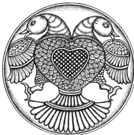
Рис. 4. Гандаберунда в искусстве Индии.