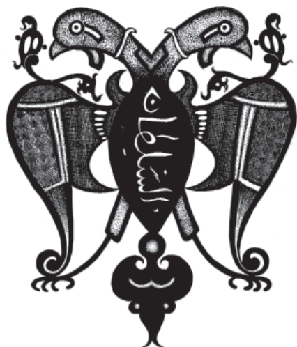
Рис. 11. Двуглавый орел с надписью «Аль-султан».

Живописно охарактеризовал германский менталитет М.Е. Салтыков-Щедрин во второй главе книги «За рубежом». Военный аспект германского национального характера писатель характеризует претензией на вселенское господство. Это, по его мнению, видно даже по Берлину: «Вся суть современного Берлина, все мировое значение его сосредоточены в здании, возвышающемся в виду Королевской площади и носящем название: Главный штаб ...». Писатель заметил ту сущностную особенность Берлина, что там пахнет офицерским самодовольством: «Когда я прохожу мимо берлинского офицера, меня всегда берет оторопь. Даже в Баден-Бадене, в Эмсе мне делалось жутко... Не потому жутко, чтоб я боялся, что офицер кликнет городского, а потому, что он всем своим складом, посадкой, устоем, выпяченной грудью, выбри-