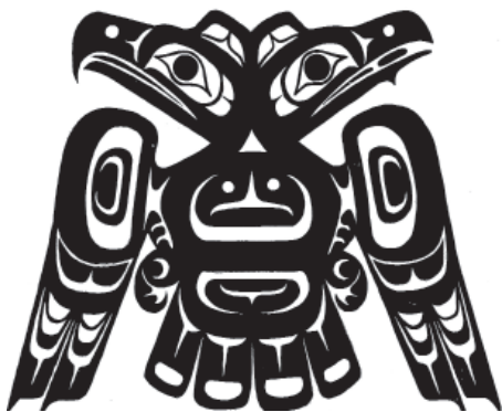
Рис. 15. Двуглавый орел народа хайда. Аляска. США.

Долгое время была популярна версия о происхождении российского двуглавого орла, связанная с женитьбой Ивана III на племяннице последнего византийского императора Софье Палеолог в 1472 г. Династической эмблемой Палеологов был двуглавый орел, поэтому заимствование его, как полагали В.Н. Татищев и Н.М. Карамзин, демонстрировало преемственность православия и