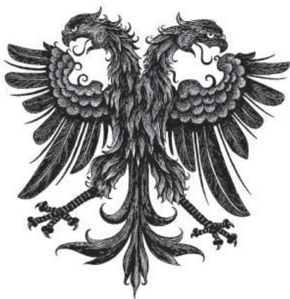
Рис. 14. Германский двуглавый орел.

тым подбородком так и тычет в меня: я – герой! Мне кажется, что если б, вместо этого, он сказал: я разбойник и сейчас начну тебя свежевать, – мне было бы легче. А то «Герой!» 10 .