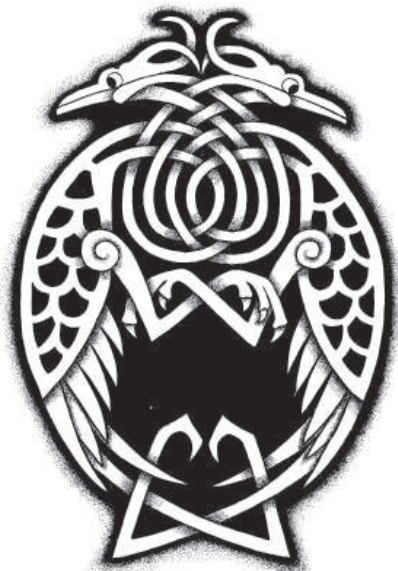
Рис. 13. Кельтский двуглавый орел.