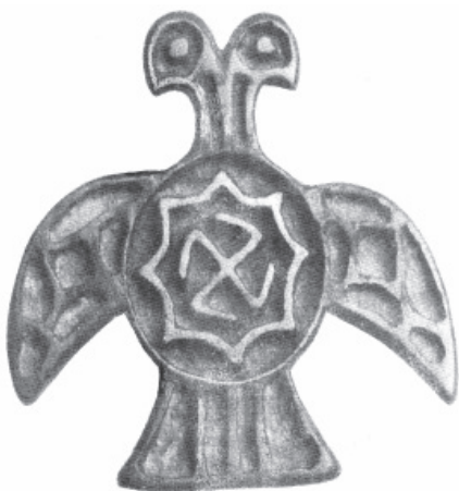
Рис. 10. Буддийский двуглавый орел.

чудливых ленточных орнаментов. Ленты на концах сплетались в изощренно запутанные извивы. Этот стиль прямо связан с менталитетом кельтов, которые верили, что дух человека – это часть мирового духа, и через множество жизней, смертей, возрождений человек проходит особенный, неповторимый путь со своим переплетением событий. Цель пути – божественное совершенство и красота. Поэтому кельтский орнамент, вплетенный в фигуру двуглавого орла является символической схемой, замысловатой картой этого пути (рис. 13).