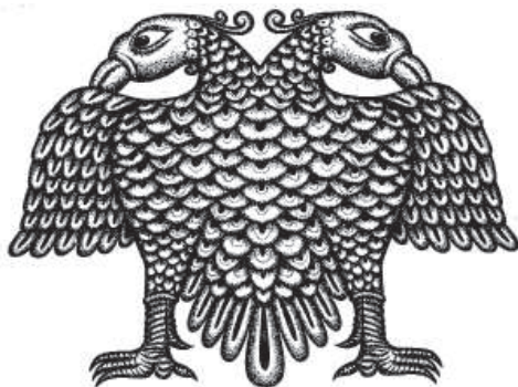
Рис. 8. Двуглавый орел из мемориала в Коломбо.

Аккультурация двуглавого орла в Византийской империи находилась под влиянием христианства, поэтому византийцы видели в нем свое божество – Иисуса Христа. Поскольку он был богочеловек, то одна голова орла символизировала его божественную сущность, а другая – человеческую. В VI–IX вв. императору стали поклоняться наравне с Богом. Так в менталитете византий-