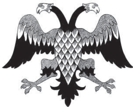
Рис. 17. Двуглавый орел. Рисунок С.И. Ягужинского.