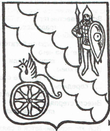
Набросок проектного варианта герба Угранского района.