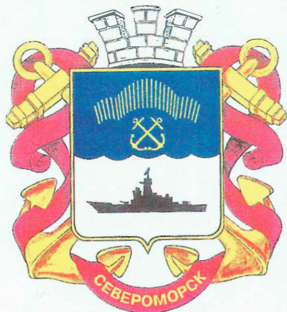
Проект герба г. Североморска. Составлен компанией "Фивеон"