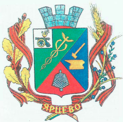
Герб г. Ярцево. Автор - Г.В. Ражнев