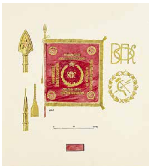
Ил. 7. Неизвестный художник. Знамя Команды связи из кадров резервных дивизий 1919 г. Лицевая сторона. Бумага; тушь, карандаш, акварель. 1920-е. ИИФ 11-254/44. Военно-исторический музей артиллерии, инженерных войск и войск связи