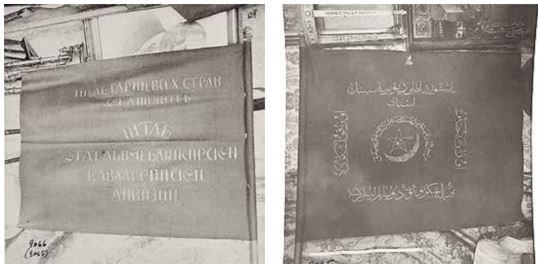
Ил. 9. Знамя штаба Отдельной Башкирской кавалерийской дивизии 1919 г. Фотография. 1919 – первая половина 1920-х. ИИФ 11-56/78. Военно-исторический музей артиллерии, инженерных войск и войск связи