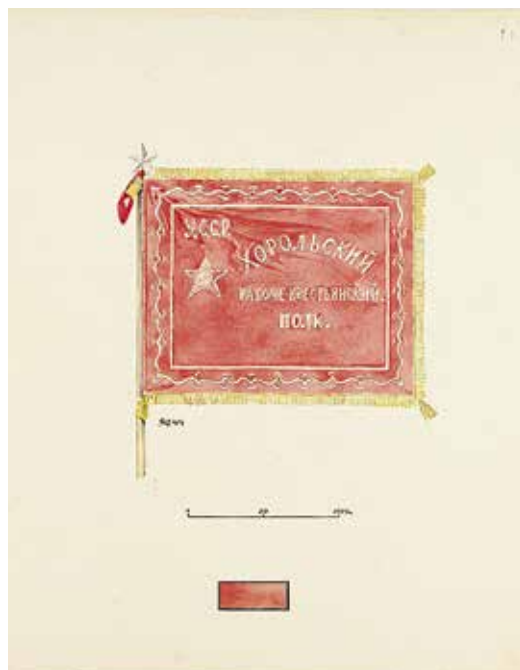
Ил. 2. Неизвестный художник. Знамя Хорольского рабоче-крестьянского полка 1919 г. Лицевая сторона. Бумага; тушь, карандаш, акварель. 1920-е. ИИФ 11-354/43.

Военно-исторический музей артиллерии, инженерных войск и войск связи