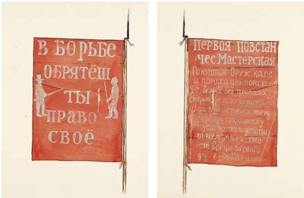
Ил. 1. Неизвестный художник. Знамя Первой повстанческой мастерской 1918 г. Лицевая и оборотная стороны. Бумага; тушь, карандаш, акварель. 1920-е. ИИФ 11-56/47. Военно-исторический музей артиллерии, инженерных войск и войск связи

за свобо /ду в Сибири». Посередине справа и слева помещены эмблемы труда, слева – скрещенные молот и клещи, справа – вилы и цепи. В нижней части слева изображены вилы, справа – пика. На оборотной стороне знамени лозунг: «В борьбе / обрятьёш / ты / право / своё». Справа и слева силуэтные изображения капиталиста и рабочего. Знамя привязано двумя тесемками за два края, древко из некрашеного соснового шеста. Наверху служит кованый штык мягкого железа, который наделяется символическим значением пролетарской борьбы 13 .