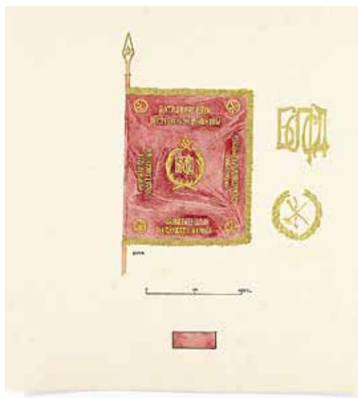
Ил. 6. Неизвестный художник. Знамя Батальона связи 1-й стрелковой дивизии 1919 г. Лицевая сторона. Бумага; тушь, карандаш, акварель. 1920-е. ИИФ 11-354/45. Военно-исторический музей артиллерии, инженерных войск и войск связи