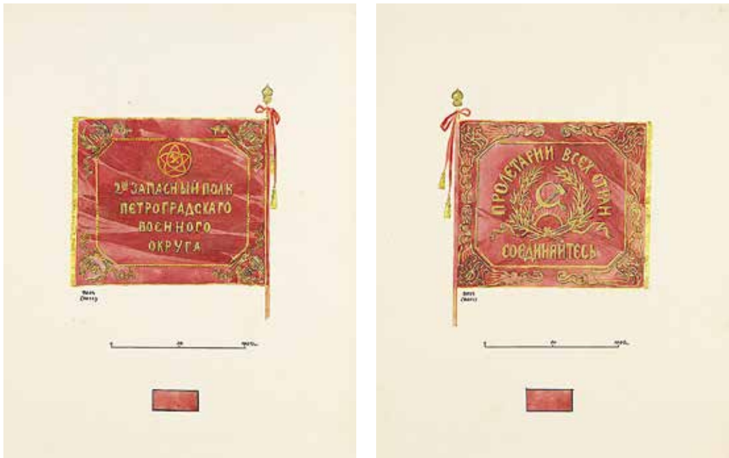
Ил. 4. Неизвестный художник. Знамя 2-го запасного стрелкового полка Петроградского военного округа 1919 г. Лицевая и оборотная стороны. Бумага; тушь, карандаш, акварель. 1920-е. ИИФ 11-56/10, 11-56/9. Военно-исторический музей артиллерии, инженерных войск и войск связи

и молотом, под ней в четыре строки надпись: «2 ой запасный полк Петроградского военного округа». В четырех углах лавровые венки с датой «1919». Знамя кругом обшито позументом, а по вышитой кромке золотой редкой бахромой. Навершие деревянное, точеное, покрыто бронзой. Лента красная, с одной стороны бархатная, с другой стороны атласная, по концам золотом кисти 17 .