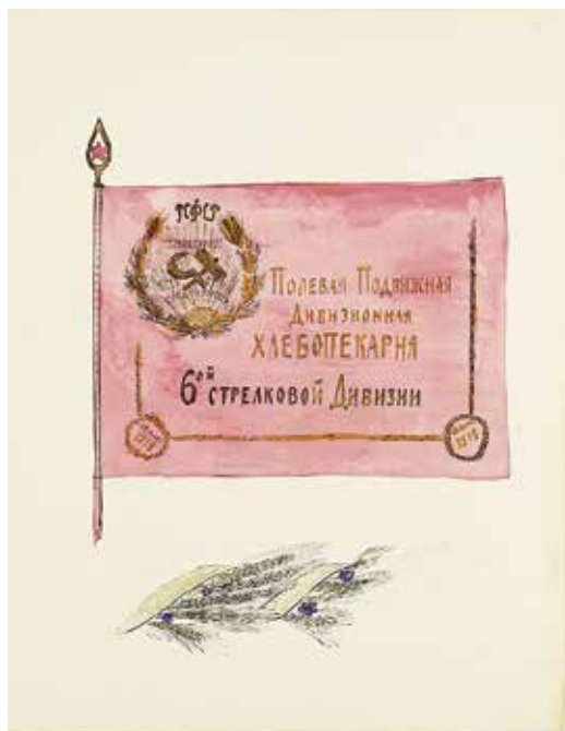
Ил. 3. Неизвестный художник. Знамя Полевой подвижной Дивизионной хлебопекарни 6-й стрелковой дивизии 1918 г. Лицевая сторона. Бумага; тушь, карандаш, акварель. 1920-е. ИИФ 11-56/4.

Военно-исторический музей артиллерии, инженерных войск и войск связи