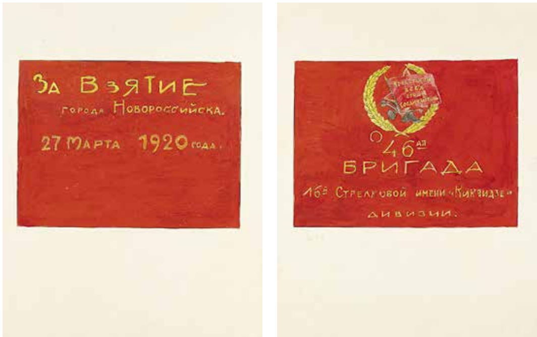
Ил. 12. Неизвестный художник. Знамя 46-й бригады 16-й Стрелковой имени Киквидзе дивизии 1920 г. Лицевая и оборотная стороны. Бумага; тушь, карандаш, акварель. 1920-е. ИИФ 11-884/42, 11-884/30. Военно-исторический музей артиллерии, инженерных войск и войск связи

на пятиконечную звезду и плуг и молот. В нижней части знамени название дивизии. На левой стороне надпись: «За взятие города Новороссийска 27 марта 1920 года». На параде 1 мая 1920 г. 46-я бригада была награждена орденом Красного Знамени 24 . Знамя относится к этому событию. На лицевой стороне, под схематическим изображением ордена, слева выделено место для прикрепления награды.