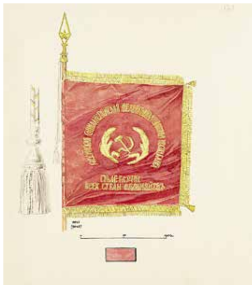
Ил. 5. Неизвестный художник. Знамя Инженерного батальона 1-й стрелковой дивизии 1919 г. Лицевая и оборотная стороны. Бумага; тушь, карандаш, акварель. 1920-е. ИИФ 11-354/47, 11-354/46. Военно-исторический музей артиллерии, инженерных войск и войск связи.