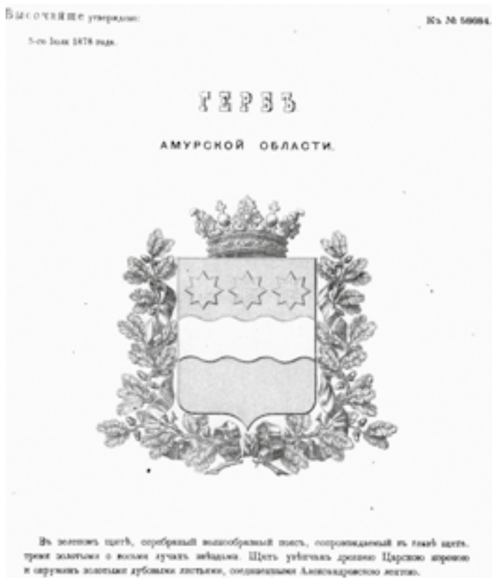
Герб Амурской области, высочайше утверждённый 5 июля 1878 года.

Спустя десять лет Гербовым отделением Департамента герольдии Правительствующего Сената были разработаны проекты областного и городского гербов. Они имели общий зелёный щит, в центре которого помещался волнообразный серебряный пояс, а в верхней части — три золотых восьмиконечных звезды. Различались гербы типовыми украшениями, обозначавшими административно-территориальный статус области и города. В соответствии с существовавшими тогда геральдическими правилами щит областного герба должна была венчать древняя царская корона и обрамлять дубовый венок. Благовещенскому гербу полагалась башенная корона о трёх зубьях и венок в виде золотых колосьев [8, л. 2–5].