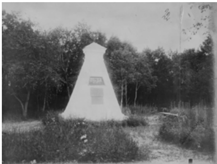
Монумент графа Муравьёва-Амурского. Фотография начала XX века.

Переадресованная городскому самоуправлению задача была оперативно выполнена. 18 июля 1903 года состоялось заседание городской думы, на котором был представлен обстоятельный доклад об истории и о современном состоянии Благовещенска. Было отмечено, что особое значение для горожан имеют два события — подписание Айгуньского договора и недавняя оборона города от китайской агрессии. Однако первостепенное значение всё-таки было отдано первому, «градообразующему» событию. Поэтому Дума постановила: «ходатайствовать перед правительством о присвоении городу Благовещенску герба с изображением на нём монумента графа Муравьёва-Амурского, воздвигнутого на месте первого военного поста, где происходили переговоры о заключении Айгуньского трактата» [9, л. 17–18, об., 22].