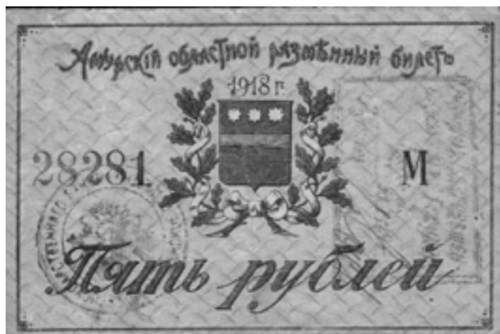
Амурский областной разменный билет.

теперь полагалась корона о пяти зубцах. Но, видимо, сотрудники Гербового отделения ориентировались на данные девятилетней давности, когда число благовещенцев не превышало 40 тысяч.