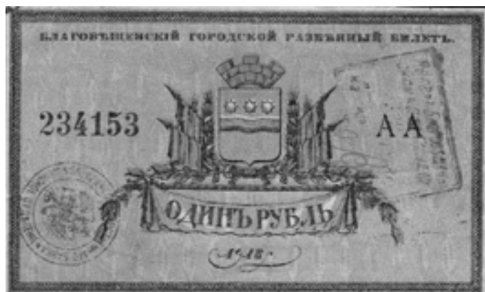
Благовещенский городской разменный билет.