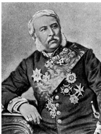
Рис. 1. Портрет барона Б.В. фон Кёне

Имя барона Б.В. фон Кёне (рис. 1) по-прежнему неизвестно широкой общественности, как до сих пор не создано и полной, всесторонней биографии этого деятеля. Даже в современной исследовательской литературе до сих пор отсутствует целостная и объективная научная оценка его деятельности в области систематизации геральдических символов России во второй половине XIX в.