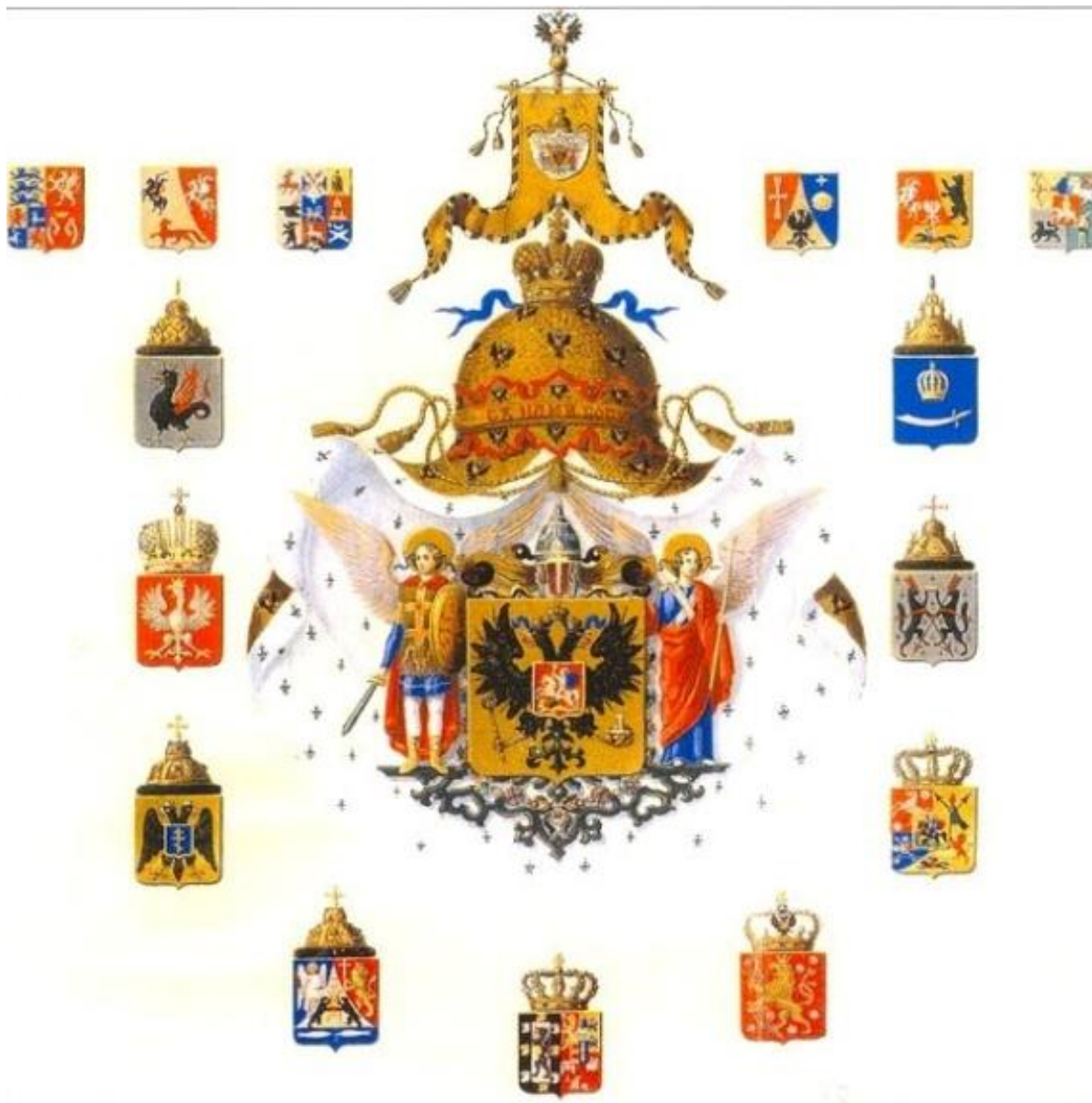
Рис. 3. Большой герб Российской империи 1857 г.

круг центрального изображения, которые объединяли более 50 гербов и символизировали все территории, перечисленные в полном титуле Императора (рис. 3).