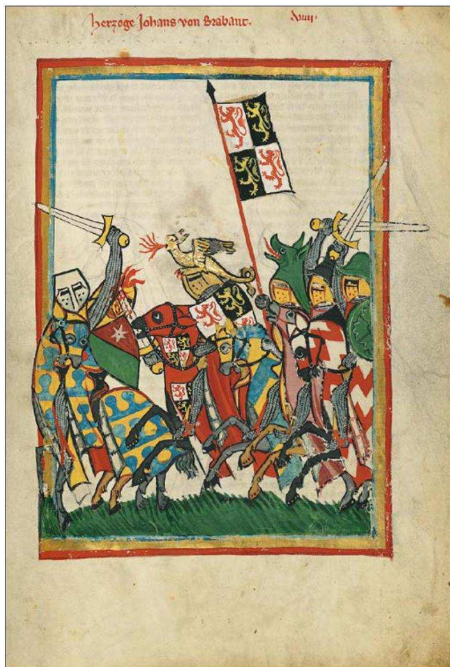
Илл. 5. Жан I Брабантский. Кодекс Манессе, Fol. 18r

либо башни замка, который пытаются захватить враги. В данной ситуации гербы участвуют непосредственно в сюжете, и их типичное положение – это щиты, нашламники, туники и знамёна рыцарей, попоны их коней. Композиция подобных иллюстраций довольно типична, они все в разной степени похожи.