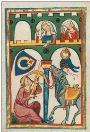
Илл. 1. Герб Рубина в Кодексе Манессе. Fol. 169v

Малоизвестный поэт Рубин также имеет различные гербы в сохранившихся кодексах 20 : в первом случае это гласный герб – в синем поле золотой перстень с рубином (илл. 1), в другом – в красном поле два шахматных чёрно-золотых пояса (илл. 2). Возможно, красный цвет щита - визуализация его имени. Оба герба связаны с куртуазной темой сборников.