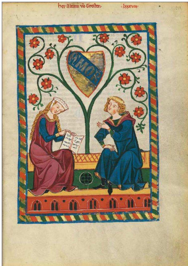
Илл. 3. Герб Альрама Грестена. Кодекс Манессе. Fol. 311r

( Pfaffe , от нем. – священник). Соответственно, в гербе Фогельвайде видим птицу в клетке, Рубина – золотое кольцо с рубином, Роста – решётку, Пфеффеля – погрудное изображение мужчины, головной убор которого, возможно, отсылает нас к образу священнослужителя 41 .