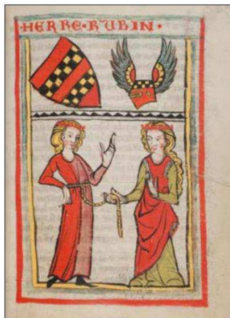
Илл. 2. Герб Рубина в Вайнгартнерском песеннике. S. 131

Остальные гербы в большинстве своём отличаются лишь цветовыми нюансами, как, например, гербы Дитмара фон Айста и Блигера Штайнаха. Можно утверждать, что большое значение имели краски, так как очевидно, что художники Вайнгартнерского песенника располагали весьма скромными материалами, отдавая предпочтение жёлтому, красному и зелёному, а мастера Кодекса Манессе применяли даже сусальное золото и серебряную краску.