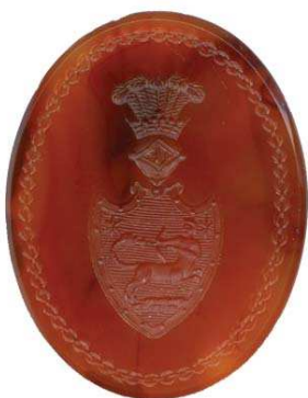
Рис. 5. Печать-гемма с гербом рода Галаган. ГМИИ, Инв. Н-267439. Овал 25х32,5 мм, высота геммы 4,5 мм.

Вторая печать-гемма (рис. 4) с гербом рода Галаганов выполнена из сердолика. Оправа отсутствует, возможно, утрачена. Поле геммы гладкое, на матрице отсутствует какая бы то ни было информация о владельце – есть только изображение герба Галаганов в треугольном, суживающемся книзу щите.