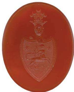
Рис. 4. Печать-гемма с гербом рода Галаган. ГМИИ, Инв. Н-267440. Овал 24,5х30 мм, высота геммы 5 мм.