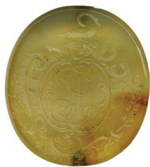
Рис. 3. Обратная сторона печати-геммы с инициалами владельца

Герб Галаганов внесен в Общий гербовник дворянских родов: «В щите, имеющем голубое поле, изображены две серебряные шестиугольные звезды, а под ними находится ипоцентавр 24 (то есть конь, у которого вместо головы видна половина обнаженного человека), пускающий из лука стрелу в челюсти змия, означенного на месте конского хвоста. Щит увенчан дворянским шлемом и короною со страусовыми перьями. Намет на щите голубой, подложенный серебром» 25 . В «Малороссийском гербовнике» 26 Модзалевского также есть информация об этом роде.