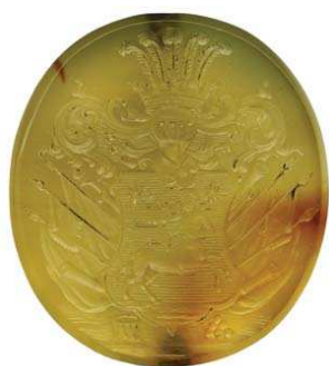
Рис. 2. Двусторонняя печать-гемма с гербом рода Галаганов. Лицевая сторона. ГМИИ, Инв. Н-267441. Овал 27,5x25 мм, высота геммы 7 мм

лал Галагана одним из самых богатых помещиков Левобережной Украины. Кроме этого, ему принадлежало несколько сел, которыми он владел «на уряд», т.е. в чине полковника, пользуясь своей властью. Всего в его ведении было около 800 дворов. За двадцатипятилетнее управление Прилуцким полком Галаган нажил большое состояние, а село Сокиренцы стали резиденцией семейства Галаганов более чем на три века.