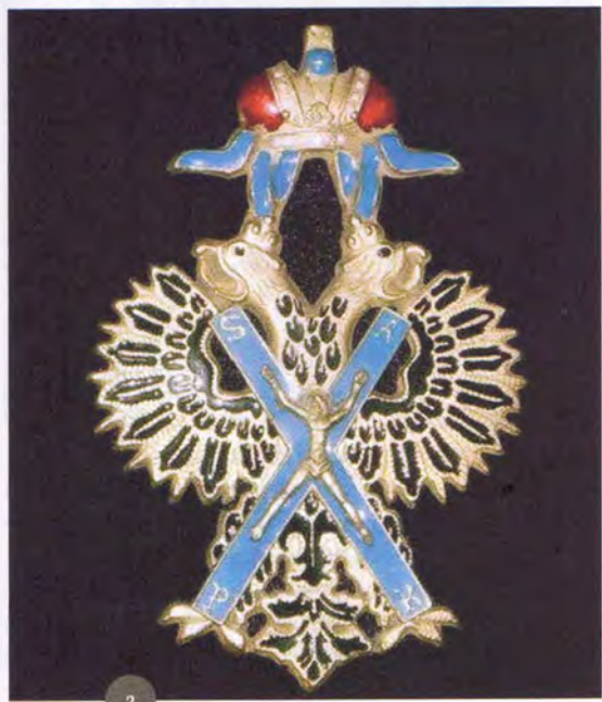
2 Андреевский крест

не менялось, а для каждого нового государя вырезалась новая надпись — легенда. Но при Петре все-таки одна изобразительная трансформация произошла. В нижней части герба между двумя группами воинов появились четыре креста, расположенных вертикально один над другим. С двух сторон эти кресты фланкировали два знамени, которые держали воины, отчего в старых описаниях иногда можно встретить утверждение, будто бы эти кресты располагались на ленте. Матрица такой печати хранится в коллекции Исторического музея в Москве 2 , где вообще сосредоточены великолепные образцы российской государственной сфрагистики, в том числе петровского времени.