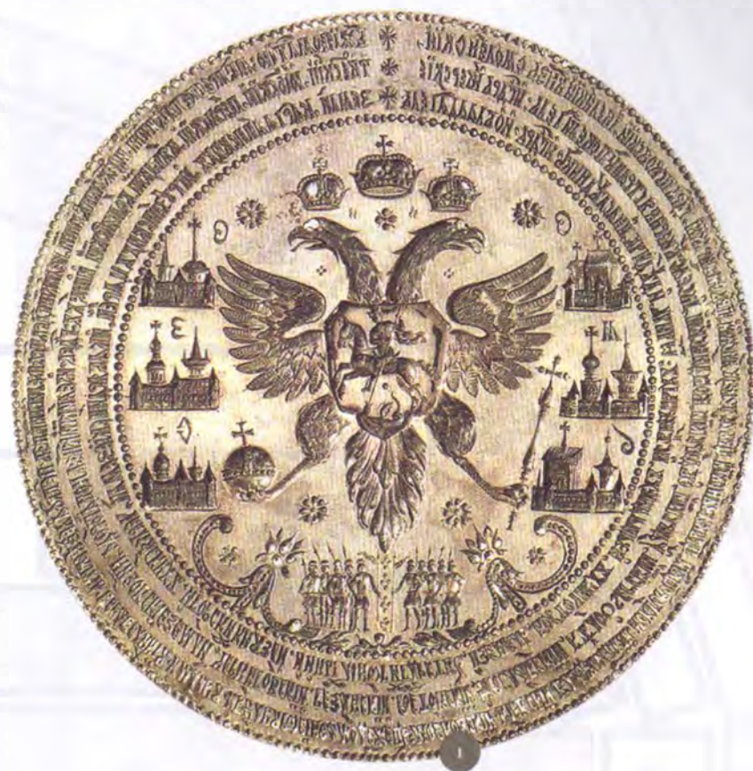
Герб с печати

Как изменялся герб России в эпоху Петра Великого