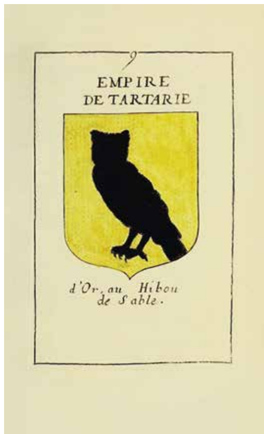
Ил. 4. Герб «Империи Тартарии». Из: Dunal P. La Géographie universelle. Paris, 1676. Vol. 1