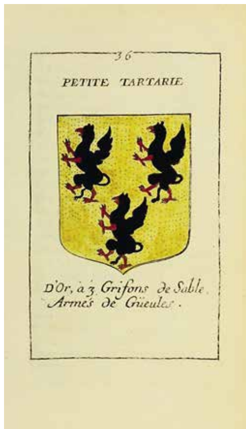
Ил. 5. Герб Малой Тартарии. Из: Dunal P. La Géographie universelle. Paris, 1676. Vol. 1

У того же Дюваля, возможно, находится и объяснение «тартарского» флага с драконом. Во втором томе его труда содержится описание так называемой Малой Тартарии, которая охватывает территорию Крыма и Причерноморья, то есть Крымского ханства. Герб этой «Малой Тартарии» выглядит как три черных грифона с красным вооружением (клювы и лапы) в золотом поле 9 . При этом грифоны изображены стоящими (ил. 5). Возможно, именно эти грифоны и послужили прототипом дракона на фантазийном флаге «императора Тартарии».