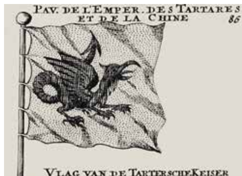
Ил. 2. Флаг «императора Тартар и Китая». Из: Aubin N. Dictionnaire de marine contenant les termes de la navigation et de l'architecture navale. Amsterdam, 1702

(ил. 4). Эта эмблема объясняется следующим образом: «Сова у них (то есть у жителей Тартарии) в большом почете, так как Чингиз, один из их правителей, был спасен с помощью этой птицы» 8 . Иными словами, Дюваль указывает на культ совы у монголов и приводит объяснение этому. Однако, как кажется, в собственно монгольских источниках подобной легенды о Чингисхане и сове не обнаруживается.