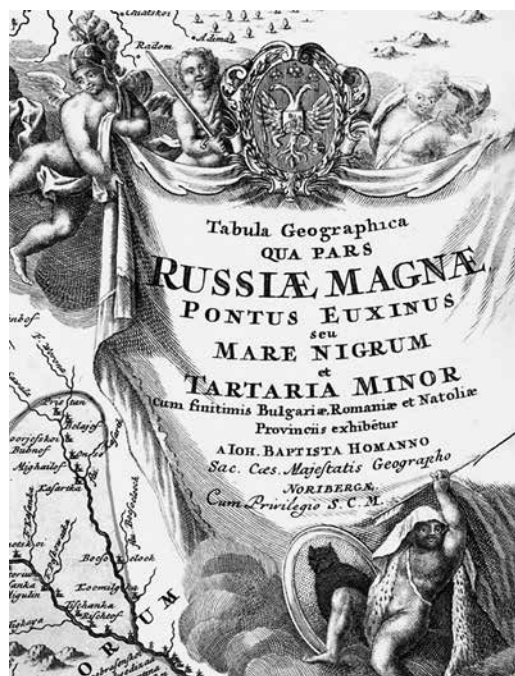
Ил. 6. Герб Тартарии на карте Иоганна Баптиста Хоманна до 1723 года