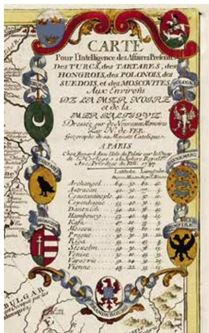
Ил. 7. Герб Тартарии на карте Николая де Фера 1737 года

На рисунке голландского художника XVIII века Яна ван Гревенброка из коллекции Музея Коррер в Венеции изображен условный портрет Марко Поло в татарском костюме, сопровождаемый двумя гербами – гербом с соевой и родовым гербом фамилии Поло (не вполне точно изображенном).