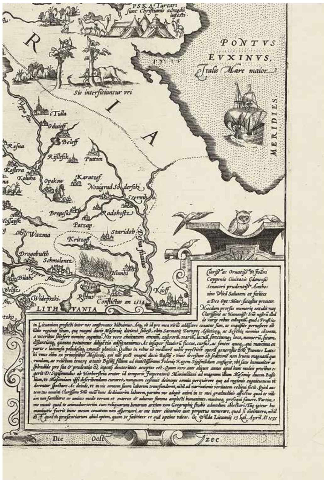
Ил. 8. Сова на карте Антония Вида 1570 года