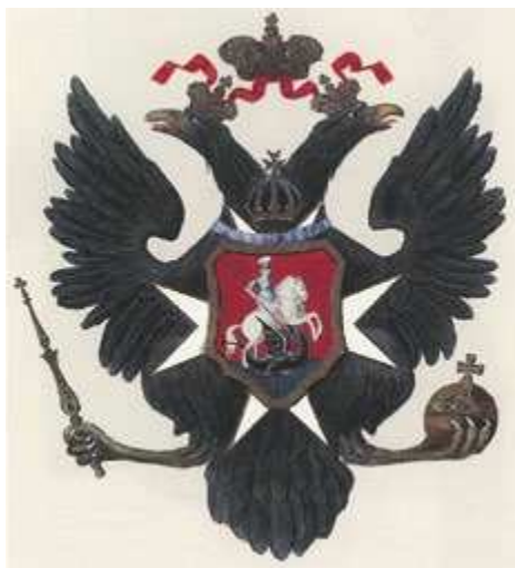
Государственный герб времен Павла I. 1799

В 1832 году Николай I вновь скорректировал государственный герб. На крыльях орла по-прежнему располагались шесть щитков с гербами, но теперь это были гербы пяти царств и одного великого княжества. Вместо киевского, владимирского и новгородского гербов изображались гербы царства Польского, царства Херсониса Таврического (то есть крымский) и великого княжества Финляндского. Напомню,