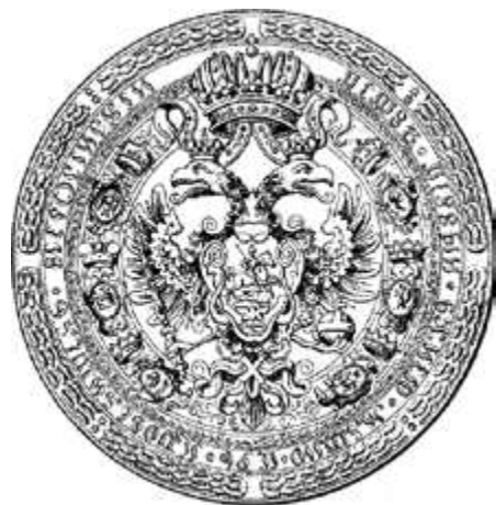
Печать Петра I. Начало XVIII в.

Каждый элемент герба здесь трактуется в соответствии с тем или иным элементом царского титула, помещенного на печати: «Божиею милостию мы, Великий Государь, Царь и Великий Князь