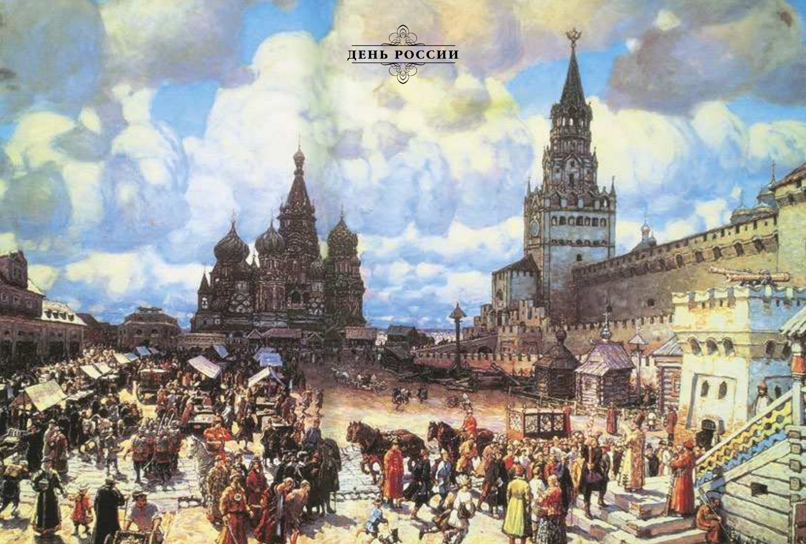
Красная площадь во второй половине XVII века. Худ. А.М. Васнецов. 1925

символически отобразить на печати титульное наименование «самодержец». И хотя слово «самодержец» в царском титуле появилось уже при Федоре Ивановиче и Борисе Годунове, только Михаил Федорович таким образом обозначил новый статус московского государя.