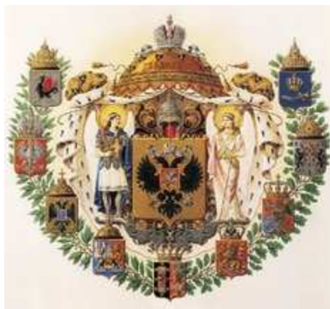
Средний государственный герб Российской империи

Кроме того, на печати есть еще две триады эмблем. С правой стороны орла