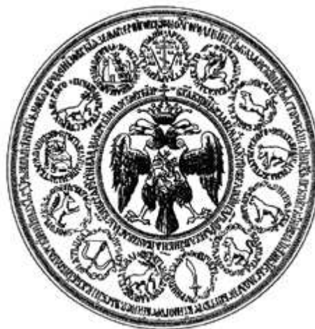
Большая печать Ивана Грозного. Конец 1570-х

Следующее изменение произошло при Михаиле Федоровиче. Над головой двуглавого коронованного орла появилась третья корона, увенчавшая всю композицию. Это нововведение относится к 1625 году. «По нашему указу сделана наша печать новая, больше прежние, для того, что на прежней печати наше Государское титло описано было несполна; а ныне перед прежнюю печатью прибавлено на печати в подписи, в нашем Государском именованьи: «Самодержец»; а что у прежней нашей печати были промеж глав орловых слова, и ныне у новья наша печати слов нет, а над главами у орла коруна», – объяснялось в царском указе. Данный текст однозначно свидетельствует о том, что изменение было вызвано потребностью