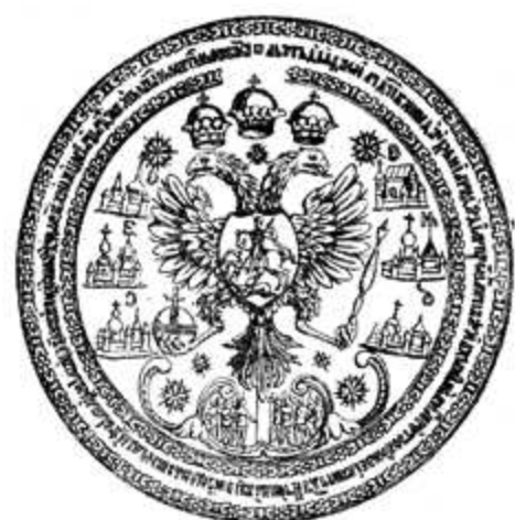
Печать Алексея Михайловича. 1667