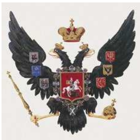
Государственный герб 1832 года