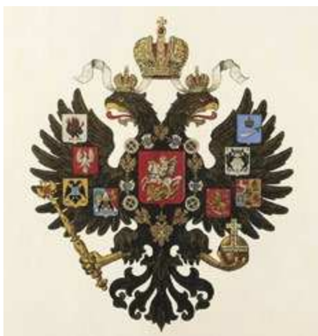
Малый государственный герб Российской империи

что в 1831 году было подавлено польское восстание, и, по-видимому, император хотел и символически закрепить власть Российской империи над непокорным Польским «царством».