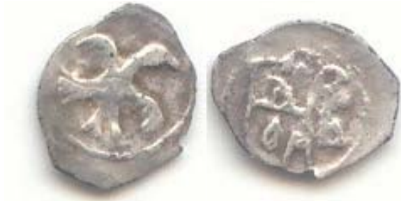
Ил.62 Полушка Ивана Грозного.