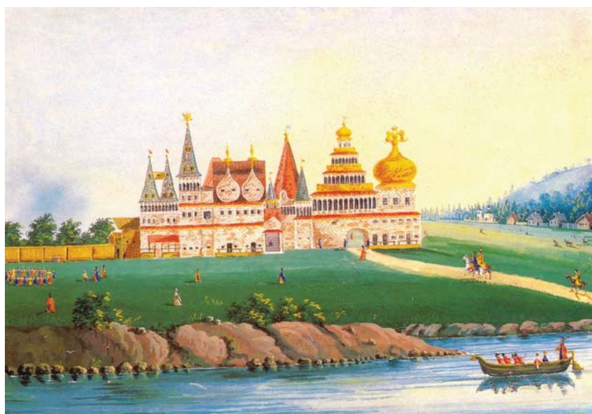
Ил.55 Вид Коломенского дворца с восточной стороны. Гуашь неизвестного художника, 1830-е гг.