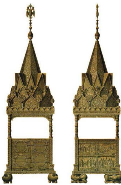
Ил.57 Мономахов трон. Рисунок Ф.Г. Солнцева.