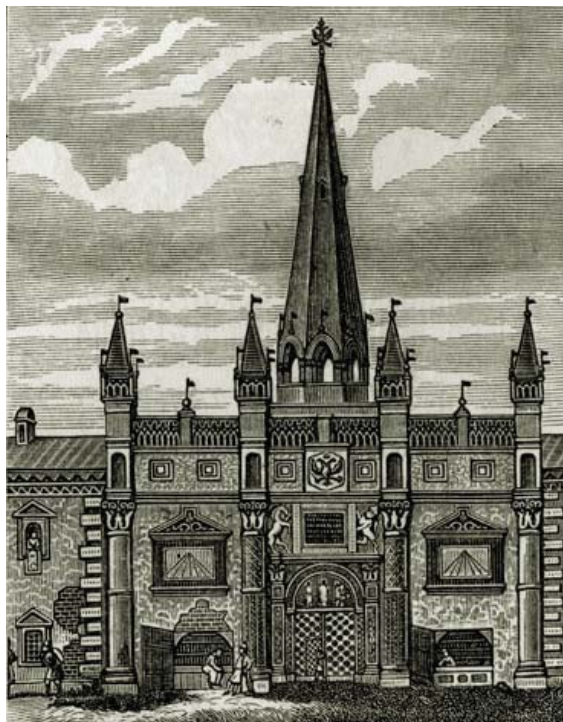
Ил.51 Здание Московского печатного двора. Гравюра Л.А. Серякова.