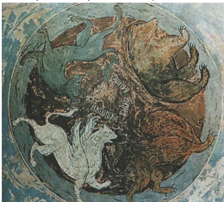
Ил.58 Символы четырёх царств. Фреска Успенского собора во Владимире.