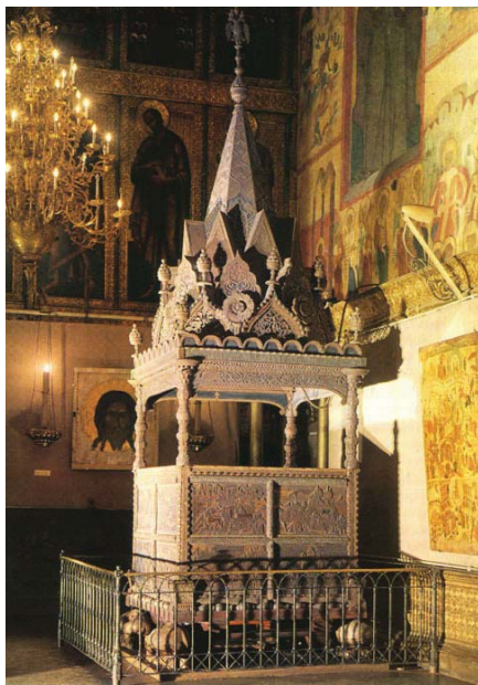
Ил.56 Мономахов трон. Царское место в Успенском соборе Московского кремля.