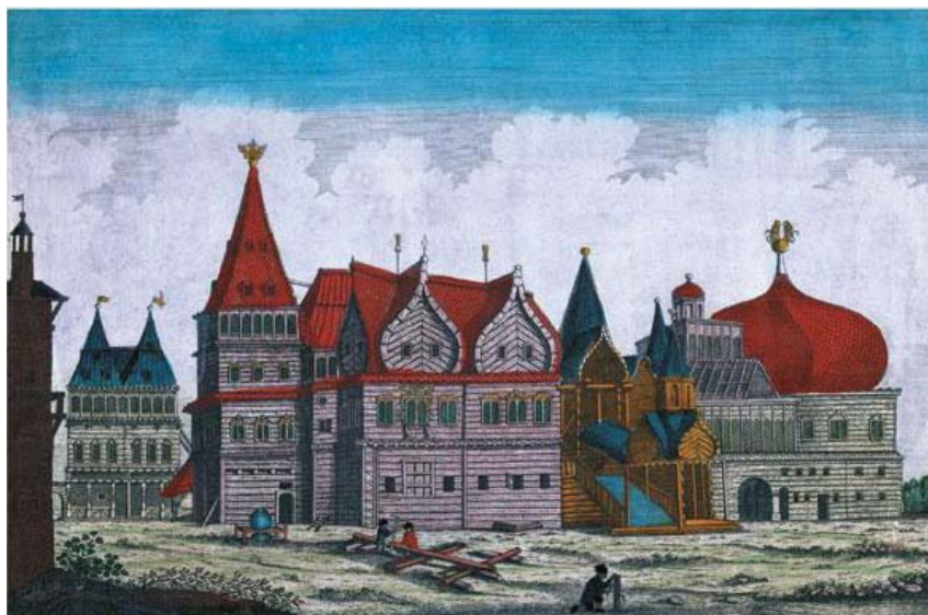
Ил.54 Вид Коломенского дворца. Раскрашенная копия с гравюры Ф. Гильфердинга.