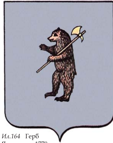
Ил.164 Герб Ярославля, 1778 г.