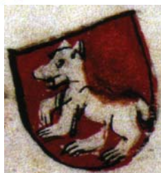
Ил.171 Смоленский герб из Бергшаммарского гербовника.