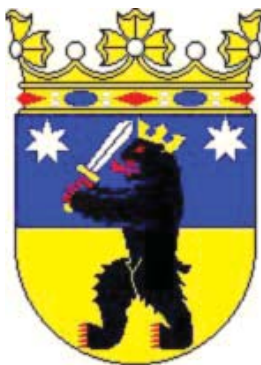
Ил.156 Герб финской провинции Сатакунта.