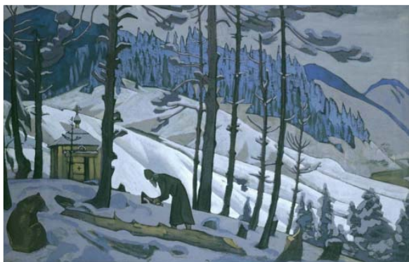
Ил.167 Н.К. Рерих. Сергий Строитель.