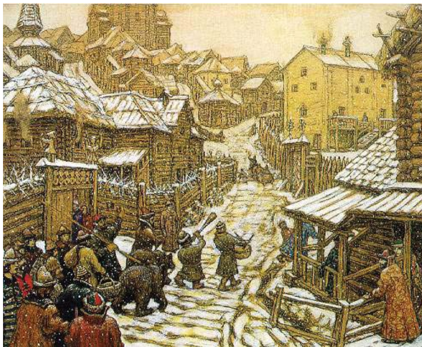
Ил.160 А.М. Васнецов. Медведчики, 1911 г.

крест да посог, посторонь два медведя, передними ногами держат престол, под престолом озеро, а в нем две рыбы» 446 . Так в целом завершилась эволюция новгородского герба 447 .