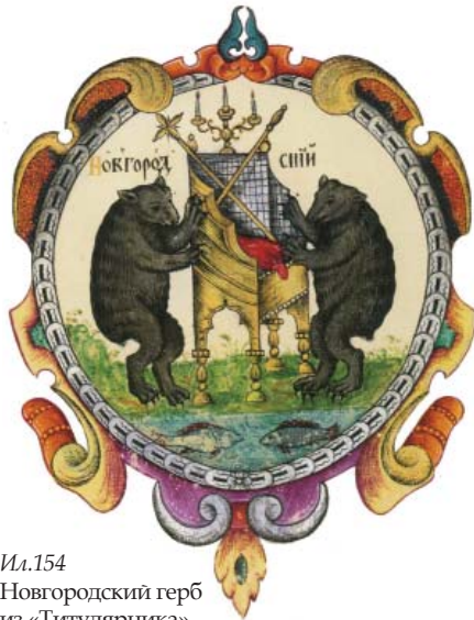
Ил.154 Новгородский герб из «Титулярника», 1672 г.