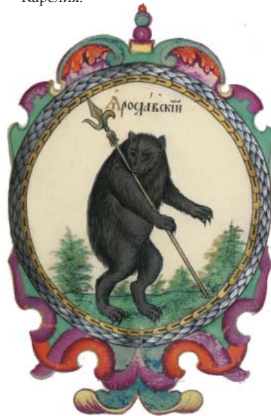
Ил.159 Ярославский герб из «Титулярника», 1672 г.