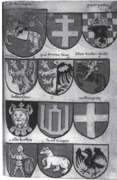
Ил.172 Смоленский герб из Гимнихского гербовника.

Почему же литовским гербом Смоленска стал именно медведь? В европейской геральдике XV–XVI вв. медведь мог обозначать «дикие», «глухие» земли, населённые иноязычным или иноверческим населением. Именно этой традиции, вероятно, обязан своим появлением медведь Жемайтии, долгое время остававшейся языческой землёй – медведь в ошейнике мог свидетель-