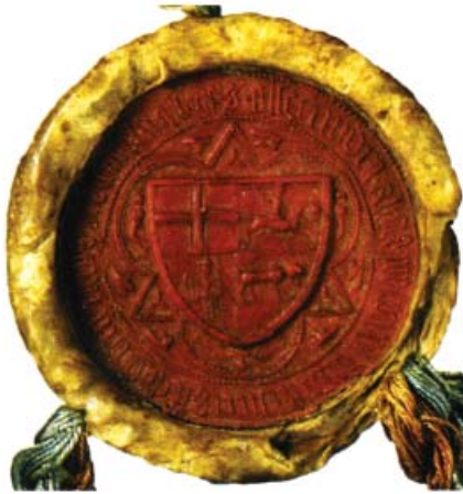
Ил.174 Печать Витовта Великого, 1404 г.