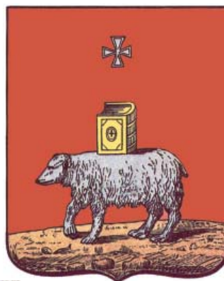
Ил.170 Герб Перми, 1783 г.