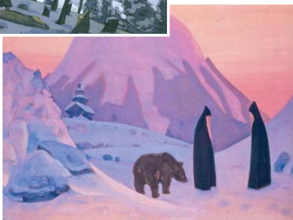
Ил.168 Н.К. Рерих. И не убоимся.