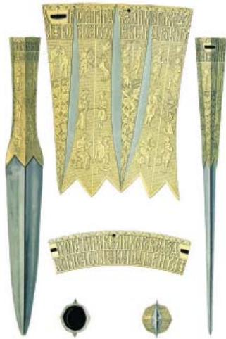
Ил.163 Рогатина Великого князя Тверского Бориса Александровича. Рис. Ф.Г. Солнцева.