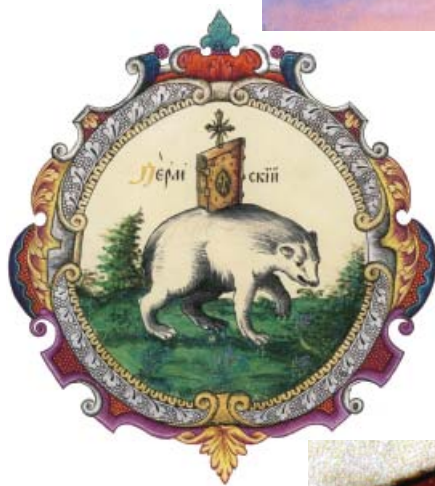
Ил.169 Пермский герб из «Титулярника», 1672 г.