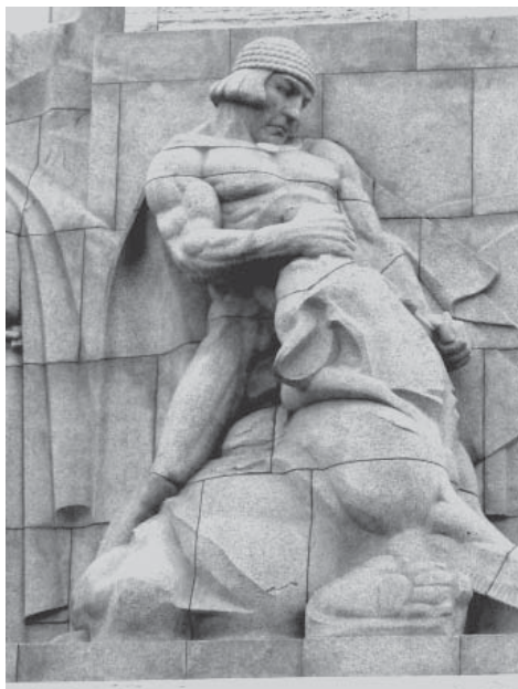
Ил.161 Изображение Лачплесиса на памятнике Свободе в Риге. Скульптор Карлис Зале, 1935 г.

ти во имя святого угодника, яко хищнаго и лютаго зверя победы в день его». Хотя в сказании «лютый зверь» не назван, можно думать, исходя из местного топонима, что это был медведь 466 . Вряд ли можно сомневаться, что именно эта легенда, вернее, народное предание об основании города, и послужило основой для создания ярославского герба.