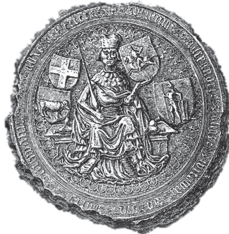
Ил.173 «Тронная» печать Витовта Великого.