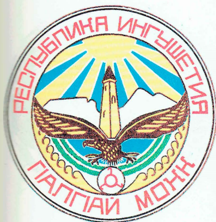
Государственный герб Республики Ингушетия