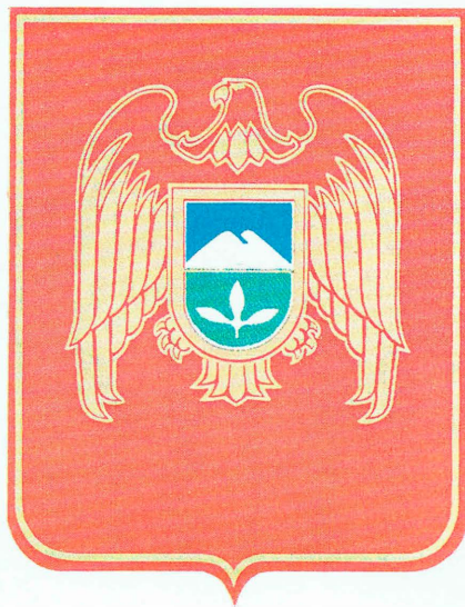
Государственный герб Кабардино-Балкарской Республики