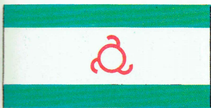
Государственный флаг Республики Ингушетия