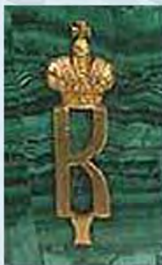
Рис. 2. Фрагмент малахитового основания бюста Константина Павловича с императорским вензелем (из собрания Государственного Эрмитажа).