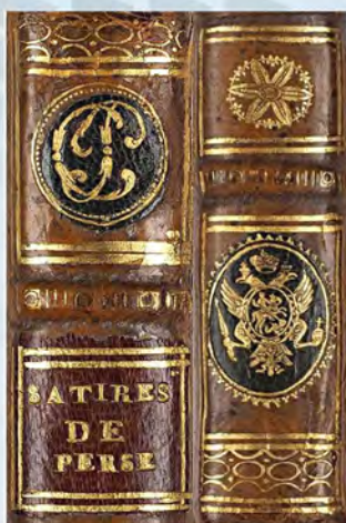
Рис. 7. Корешок переплета книги из библиотеки Константина Павловича с вензелевым суперэкслибрисом (верхняя и нижняя части) (лот аукционного дома «Литфонд»).