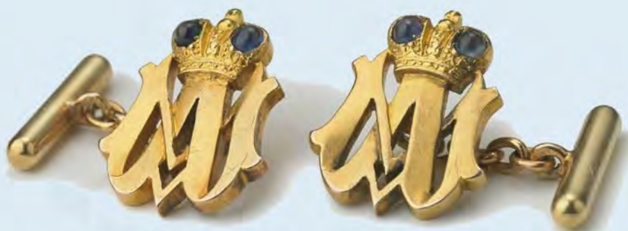
Рис. 16. Золотые запонки, заказанные великим князем Михаилом Александровичем в период 1899–1908 гг.