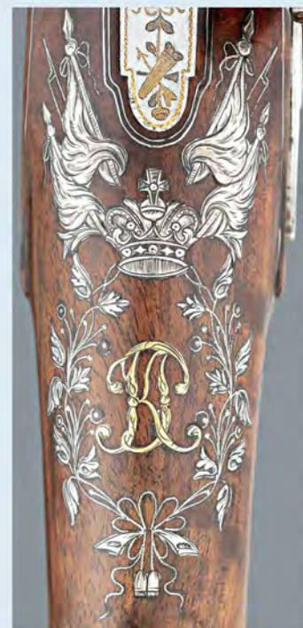
Рис. 6. Вензель Константина Павловича на стволе пистолета (из собрания Метрополитен-музея, США).