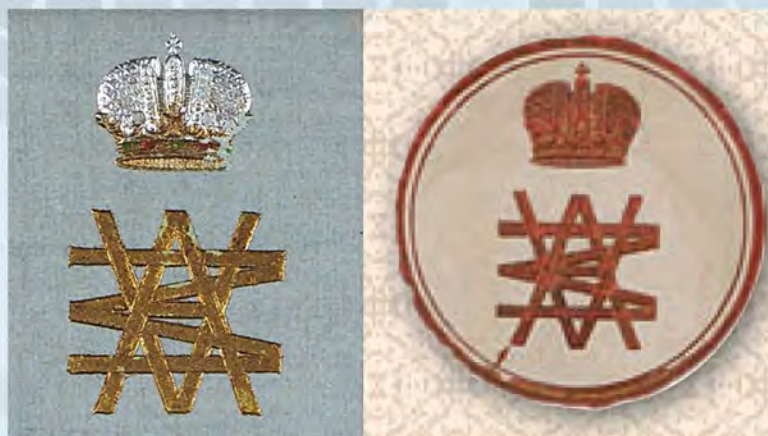
Рис. 9-10. Идентичные монограммы великих князей Михаила Александровича (почтовая бумага) и Александра Михайловича (экслибрис).