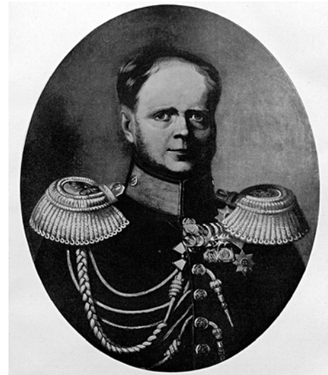
Рис. 1. Портрет великого князя Константина Павловича. 5

Репертуар монограмм, принадлежавших Константину Павловичу сравнительно невелик. Возможно, это связано с тем, что большую часть своей сознательной жизни он провел в европейских походах русской армии и в качестве главнокомандующего польскими армиями. По языковой принадлежности их можно разделить на три вида: «К. П.» (на русском языке) (ниже мы покажем, что по крайней мере один известный предмет с данной монограммой Константину Павловичу, вероятнее всего, не принадлежал), «K. P.» (Konstantin Pawlowitsch, Konstantin Pawłowicz) (на немецком и польском языках) и «С. Р.» (Constantin Pavlovitch) (на французском языке).