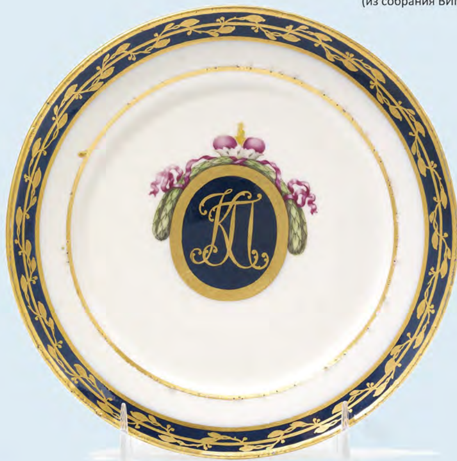
Рис. 4. Тарелка с монограммой «КП», вероятно, Константину Павловичу не принадлежавшая (из собрания музея-заповедника «Гатчина»).