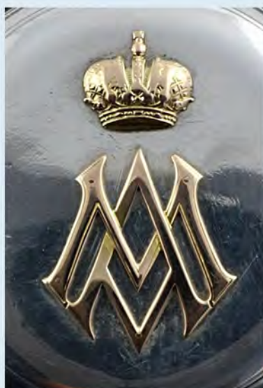
Рис. 13. Монограмма великого князя Михаила Александровича, тип 2 (рубленным шрифтом с засечками) на призовых часах, вручаемых от имени Михаила Александровича.