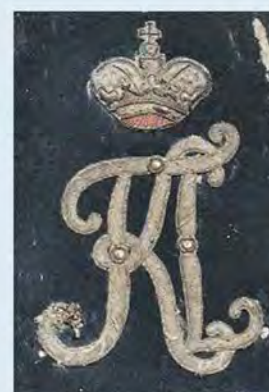
Рис. 5. Вензель Константина Павловича на гусарской ташке (из собрания ВИМАИВиВС):