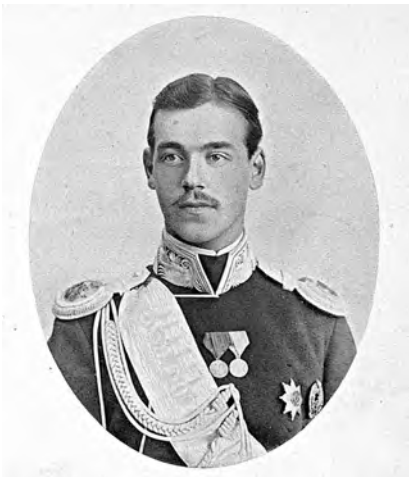
Рис. 8. Портрет великого князя Михаила Александровича. 14

С 1912 г. состоял в морганатическом браке с Н.С. Шереметьевской, по первому браку Мамонтовой, по второму Вульферт. Сын Георгий (1910 – 1931). В 1915 г. жене и сыну пожалованы графский титул и фамилия Брасовых, по названию имения под Орлом.