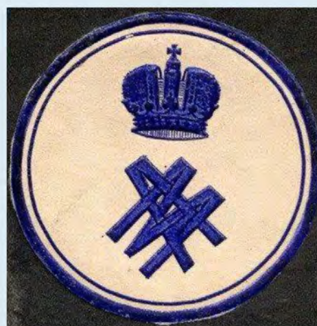
Рис. 17. Экслибрис великого князя Михаила Александровича с монограммой типа 3.