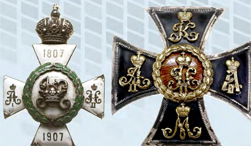
Рис. 3а, 3б. Памятные юбилейные знаки воинских подразделений РИА с вензелем Константина Павловича (Частные собрания, Польша).