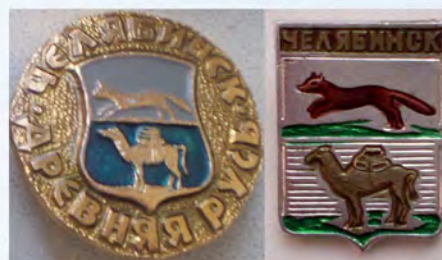
Рис. 7. Примеры серийных значков с историческим гербом Челябинска.