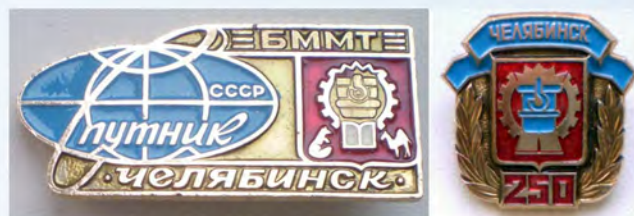
Рис. 6. Значки с сюжетом, основанным на эмблеме 1986 г.