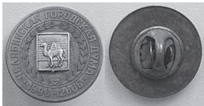
Рис. 8. Современный официальный знак Челябинской городской думы с гербом Челябинска. 2006.

Однако, большинство сувенирных знаков такого рода не отличаются высоким уровнем дизайна и его воплощения в материале, они лишь отображают с разной степенью достоверности существовавший на момент выпуска знака официальный герб с поясняющей надписью «Челябинск». И это вполне объяснимо – частные производители с целью снижения себестоимости производства вынуждены экономить на услугах дизайнера и художника.