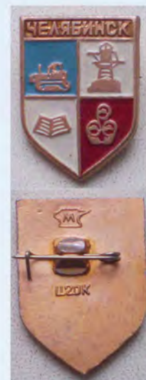
Рис. 3. Уменьшенный значок с геральдической эмблемой Челябинска (1970-е гг.)