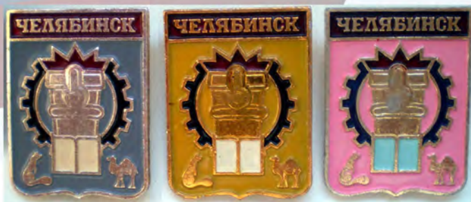
Рис. 5. Разноокрасы значков с эмблемой 1986 г.