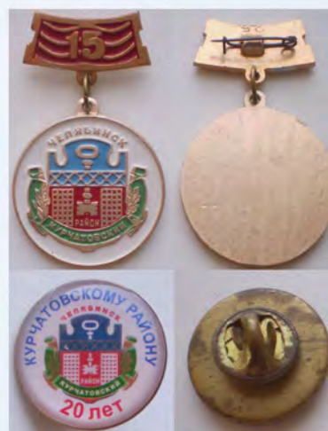
Рис. 9. Геральдическая эмблема Курчатовского района Челябинска на значках.