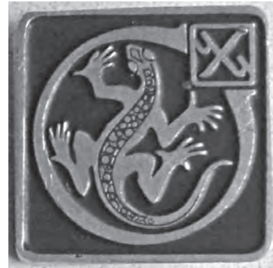
Рис. 1. Логотип ЧФХИ, основного производителя значков в Челябинске, на значке.

казы не только из Челябинска и области, но из других регионов Урала, Сибири и Северного Казахстана. Логотипом фабрики была вписанная в круг стилизованная саламандра (ящерица) 17 , в правом верхнем углу круга находился квадрат также со стилизованной буквой «Х», концы переключин которой были загнуты в форме буквы «Ч», что очевидно, означало Челябинская художественная (фабрика) 18 ; рис. 1) 19 . Эта часть логотипа ставилась как клеймо на реверсе значков. В 2011 г. фабрика была признана обанкротившимся предприятием и закрыта.