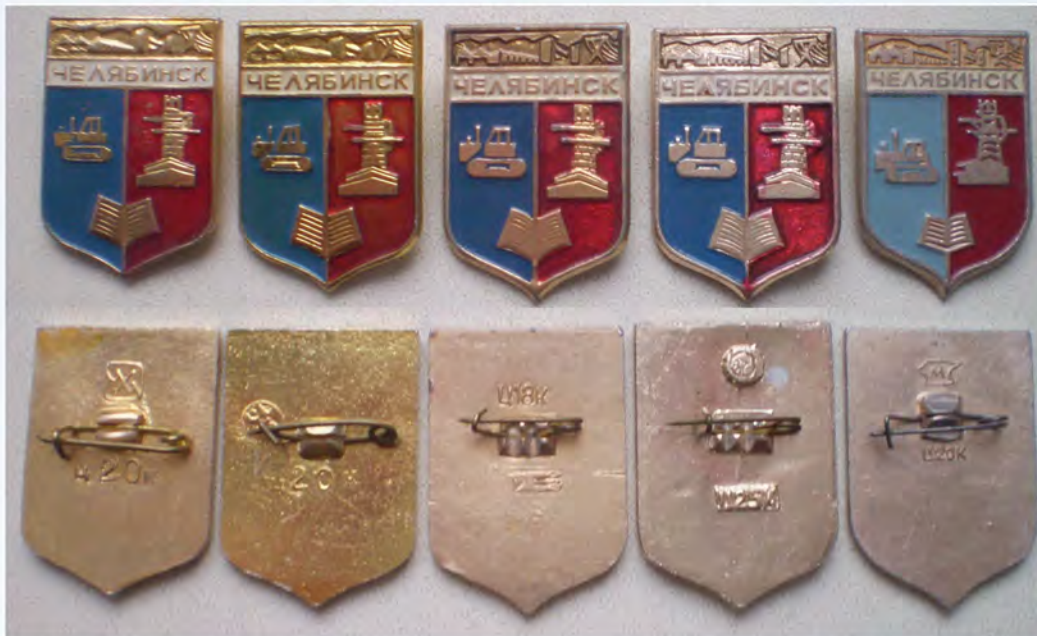
Рис. 2. Разновидности стандартных значков с геральдической эмблемой Челябинска (1970-е гг.)