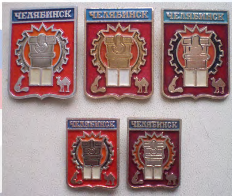
Рис. 4. Разновидности значков с геральдической эмблемой Челябинска (1986 г.), стандарт и фрачник.