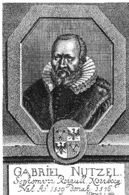
Ил. 2. Портрет Габриэля Нутцеля (Нитцеля). 1669 г.

на в первой и четвертой четвертях, а во второй и третьей четвертях – в лазоревом поле золотая перевязь влево (см. вкладку, ил. 6).