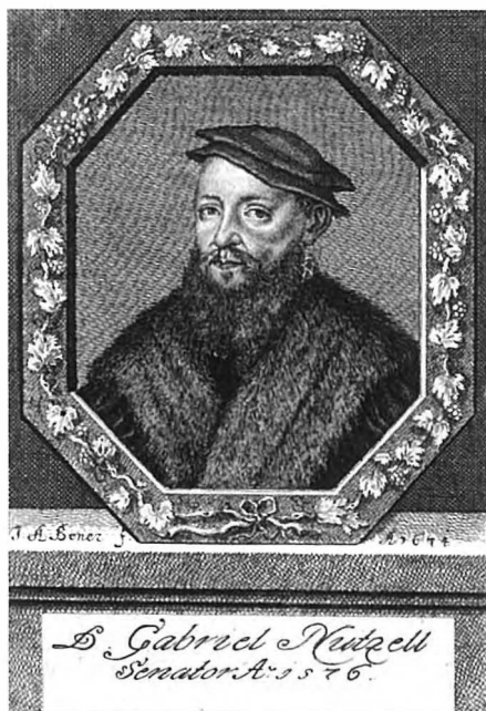
Ил. 3. Портрет Габриэля Нутцеля (Нитцеля) в 1576 г. (1674 г.).

Таким образом, можно сделать вывод о том, что портрет Габриэля III Нитцеля фон Зиндерсбиля принадлежит к фламандской школе живописи, а не к английской или французской, как утверждалось ранее. Данная локализация позволяет искусствоведам вести дальнейший поиск возможного автора портрета более целенаправленно.