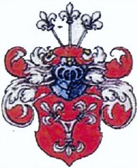
Ил. 2. Герб рода Штромер фон Райхенбах из гербовника «старого» Зибмахера.