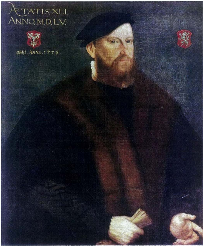
Ил. 1. Портрет Габриэля III Нитцель фон Зиндерсбиля. 1555 г. Инв. № Ж-1150. Государственный музей изобразительных искусств имени А.С. Пушкина. Москва.