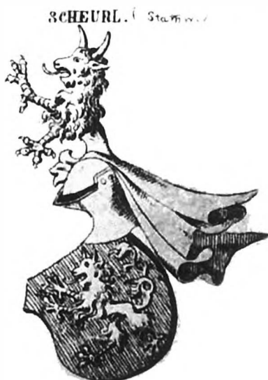
Ил. 1. Герб рода Шойрль фон Деферсдорф из баварского гербовника Зибмахера.

Женский герб также легко опознаваем, благодаря тому, что, найдя мужской герб, мы точно установили место поисков – город Нюрнберг. Среди семей нюрнбергского патрициата мы находим герб рода Шойрль фон Деферсдорф (Scheurl von Defersdorf) – в червленом поле идущая вправо на задних лапах серебряная пантера 10 (см. ил. 1). Женский герб также является основным гербом рода. В четверочастном варианте этого герба пантера помеще-