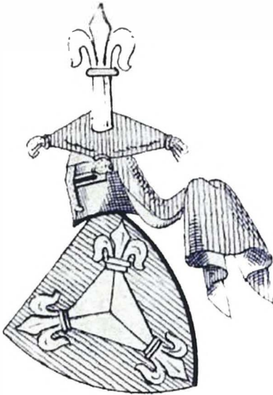
Ил. 5. Герб рода Нитцель фон Зиндерсбиль в четверочастном варианте из гербовника Розенвальда.