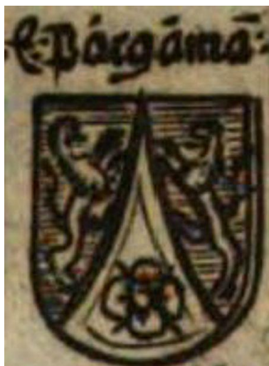
Рисунок 5. Герб семьи Bargama(ski) из тирольского гербовника 1678 г.

Иллюстратор гербовника Рьетстапа, швейцарский художник Лионель Сандоз (раскрасивший изображения В. и А. Ролланов [6]), немного неверно раскрасил герб – ветвь винограда получилась серебряная, а не зеленая с виноградом естественного цвета (рис. 4). Так как иллюстраторы Рьетстапа не изображали элементы герба, выходящие за рамки поля щита (шлем, нашлемник, намет и др.), графического воплощения этих элементов в трактовке Рьетстапа у нас нет.