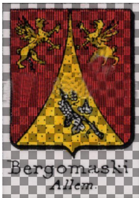
Рисунок 4. Герб семьи Bergomaski из таблиц к гербовнику Рьетстапа.