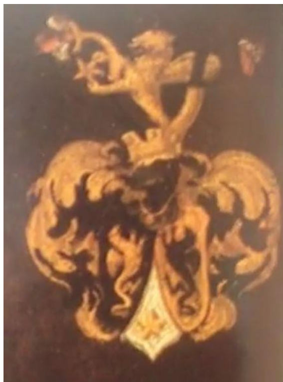
Рисунок 2. Крупный план герба на портрете.

В экспозиции европейского искусства Саратовского государственного художественного музея им. А. Н. Радищева хранится «Портрет неизвестного», традиционно приписываемый кисти французского художника 17-го века Жана Монье (Mosnier) (1600 – 1656) [1].