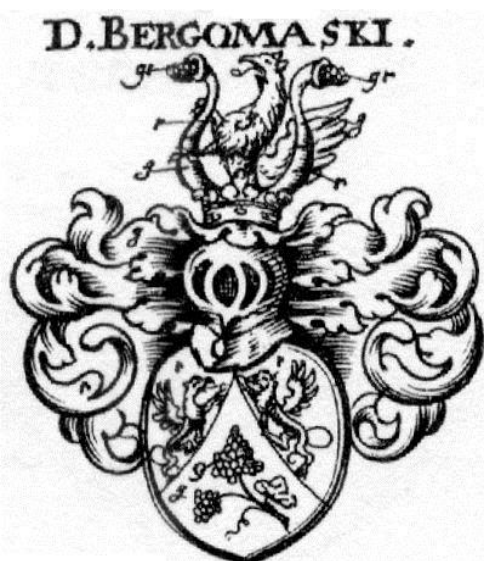
Рисунок 3. Герб семьи Bergomaski из гербовника «старого» Зибмахера.

фигурами. Этот факт подтвержден при поиске герба в Париже и городах Орлеанеза (Блуа, Орлеан, Вандом), где жил и работал предполагаемый автор портрета – Жан Монье.