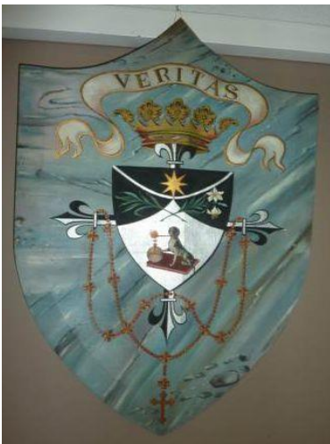
Рисунок 7. Герб ордена доминиканцев.

сомнения. Также можно предположить, что фигура золотой звезды могла быть процитирована в гербе из герба малой родины персонажа – провинции Больцано (Бозен). Таким образом, здесь мы видим не так уж редко встречающуюся трансформацию родового герба в личный, которая отражает отношение персонажа к религии