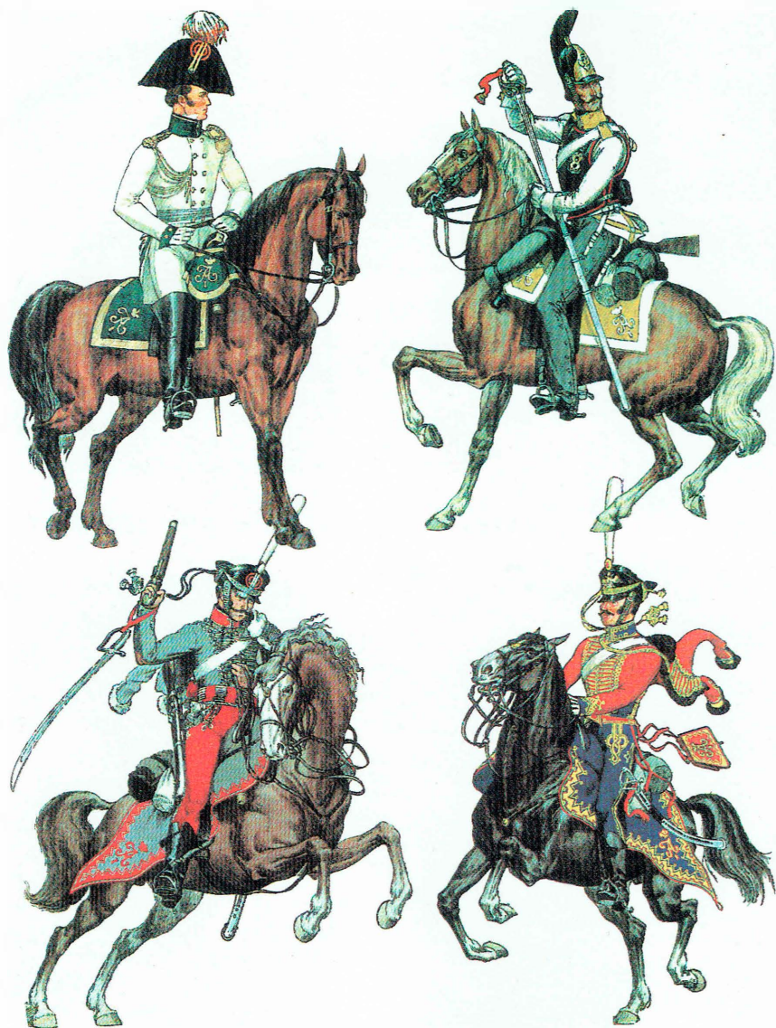
Некоторые образцы формы одежды кавалерии Русской армии 1812 г.