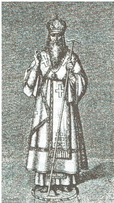
Ростовский митрополит Филарет (Романов). На этом, хоть и более позднем изображении хорошо виден одноглавый орел, на котором стоит митрополит

чением и Филарет, когда 24 июня 1619 года принимал этот чин. Вот как описано это событие в «Книге об избрании на царство ... царя Михаила Федоровича»: «... перед амвоном не было накоев; вместо того написаны были здесь на помосте большой одноглавый орел с распростертыми крыльями, под ногами же его — город с забралами и столбцами». «Отсюда (Предел Похвалы Пресвятой Богородицы — П.Р.) под руки вывели они (Успенский протопоп и протодьякон — П.Р.) Филарета и поставили на вышеупомянутом орле».