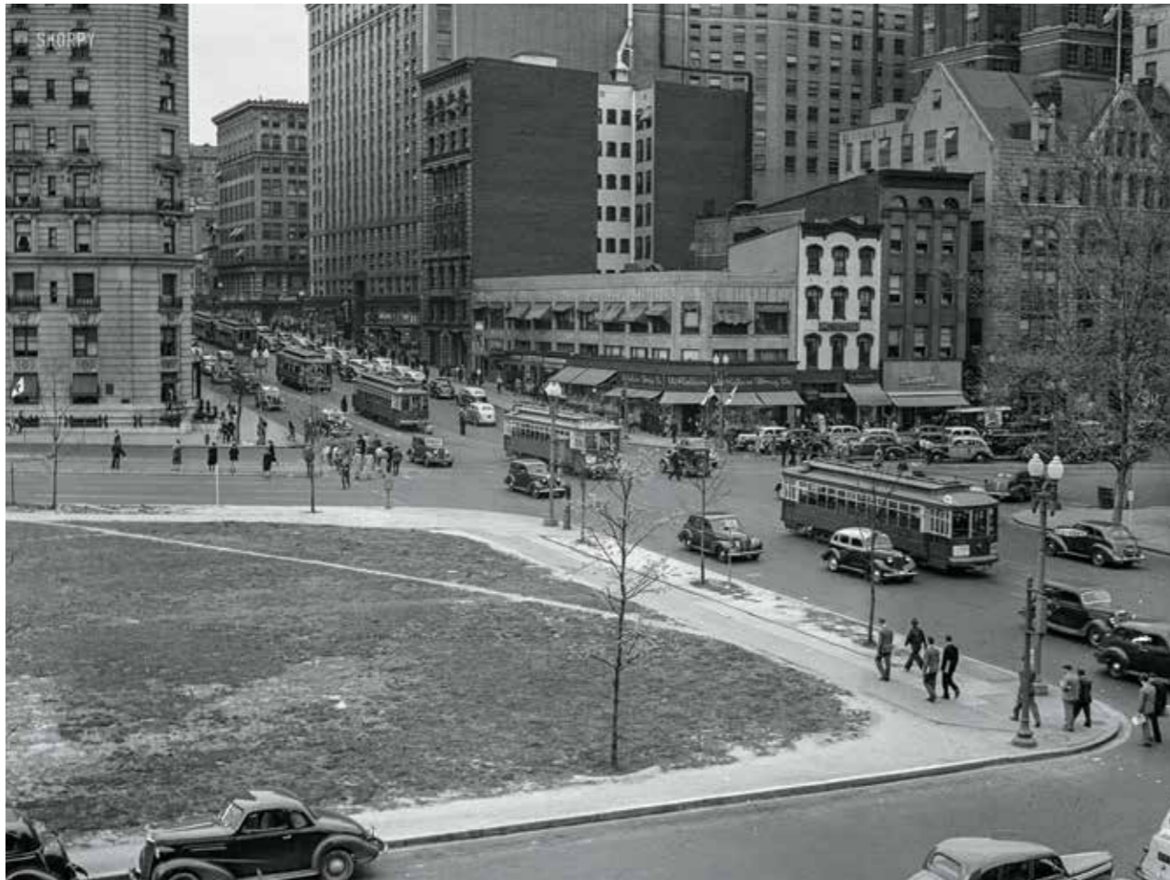
Вашингтон, 1939 г.