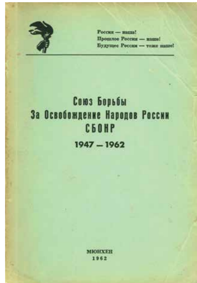
Издания Союза борьбы за освобождение народов России