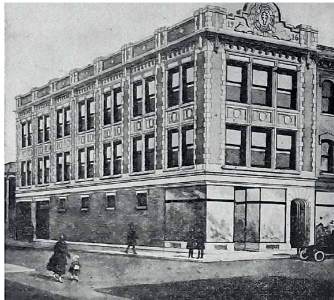
Здание Русского православного католического общества взаимопомощи