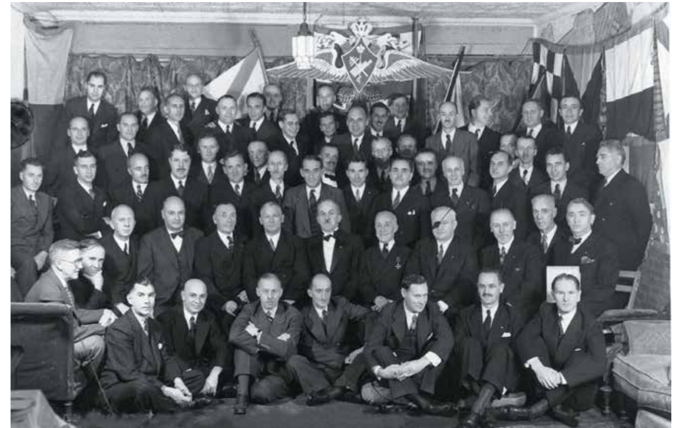
Общество бывших русских морских офицеров в Америке. 1937 г.