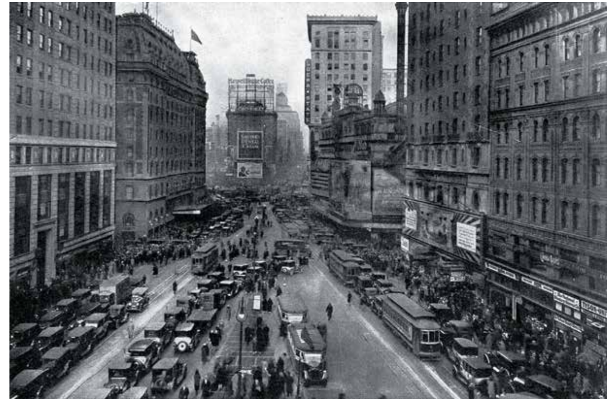
Нью-Йорк, 1930-е гг.

После Второй мировой войны в Америку из европейских стран переехало значительное количество русских эмигрантов. Постепенно стали возрождаться старые организации, создавались новые, как политические, так и культурно-просветительские, ветеранские объединения.