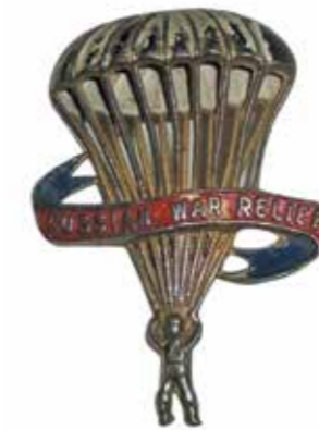
Значок Комитета помощи России в войне