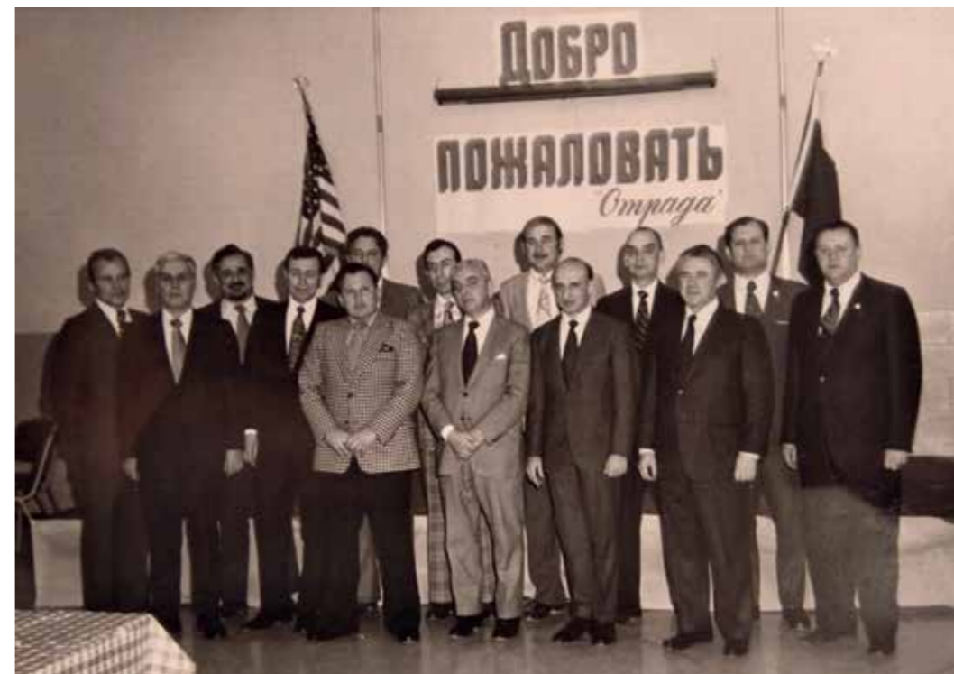
Основатели Общества «Отрада». Фото, около 1975 г.

В 1978 г. Обществом «Отрада» была куплена земля с полуразрушенными домами бывшего лагеря для детей-инвалидов близ Нью-Йорка. После восстановления зданий