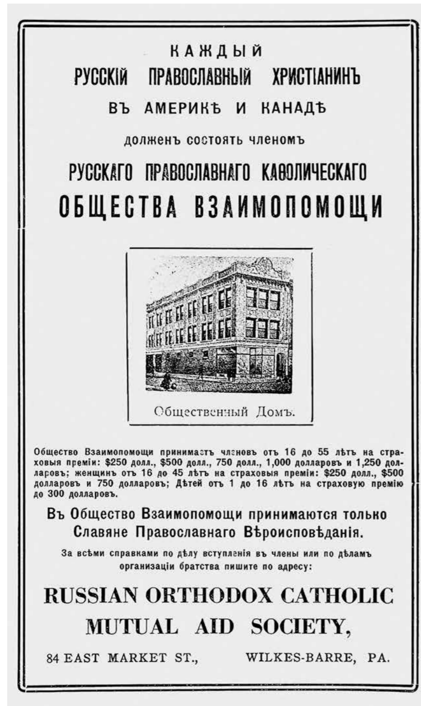
Рекламный листок Русского православного католического общества взаимопомощи. 1933 г.