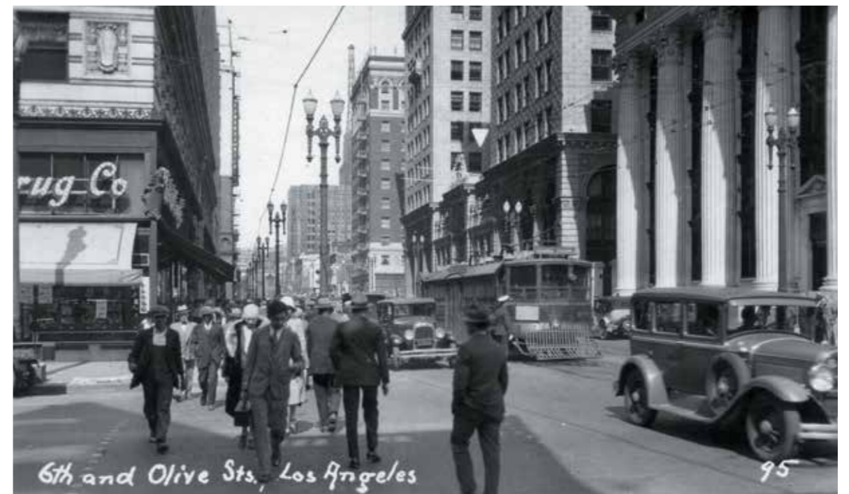
Лос-Анжелес, 1930-е гг.