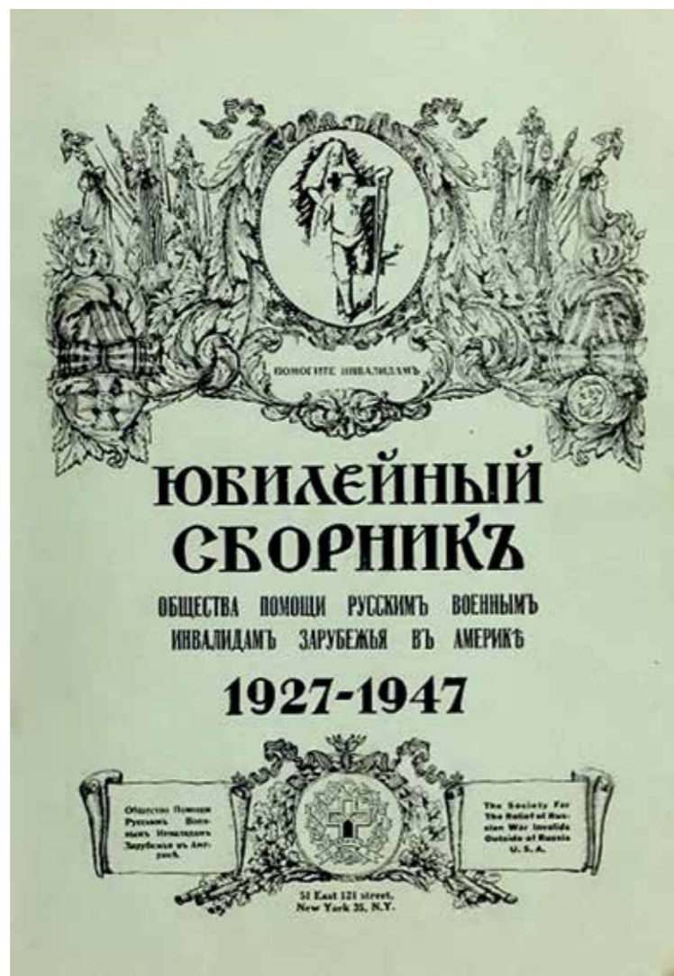
Обложка юбилейного сборника Общества помощи русским военным инвалидам зарубежья в Америке