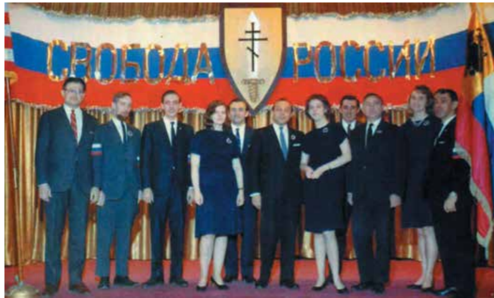
Группа основателей Объединения «За свободу России», Нью-Йорк, 1967 г.

Объединение распространяло пропагандистскую антисоветскую литературу, организовывало акции протеста, лекции и выступления. В феврале 1980 г., по инициативе Объединения в Вашингтоне, в здании Конгресса США был проведен симпозиум, основной темой которого было текущее положение дел в Советском Союзе.