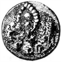
Пуговица с селища Ладыгинского (о. Беринга)