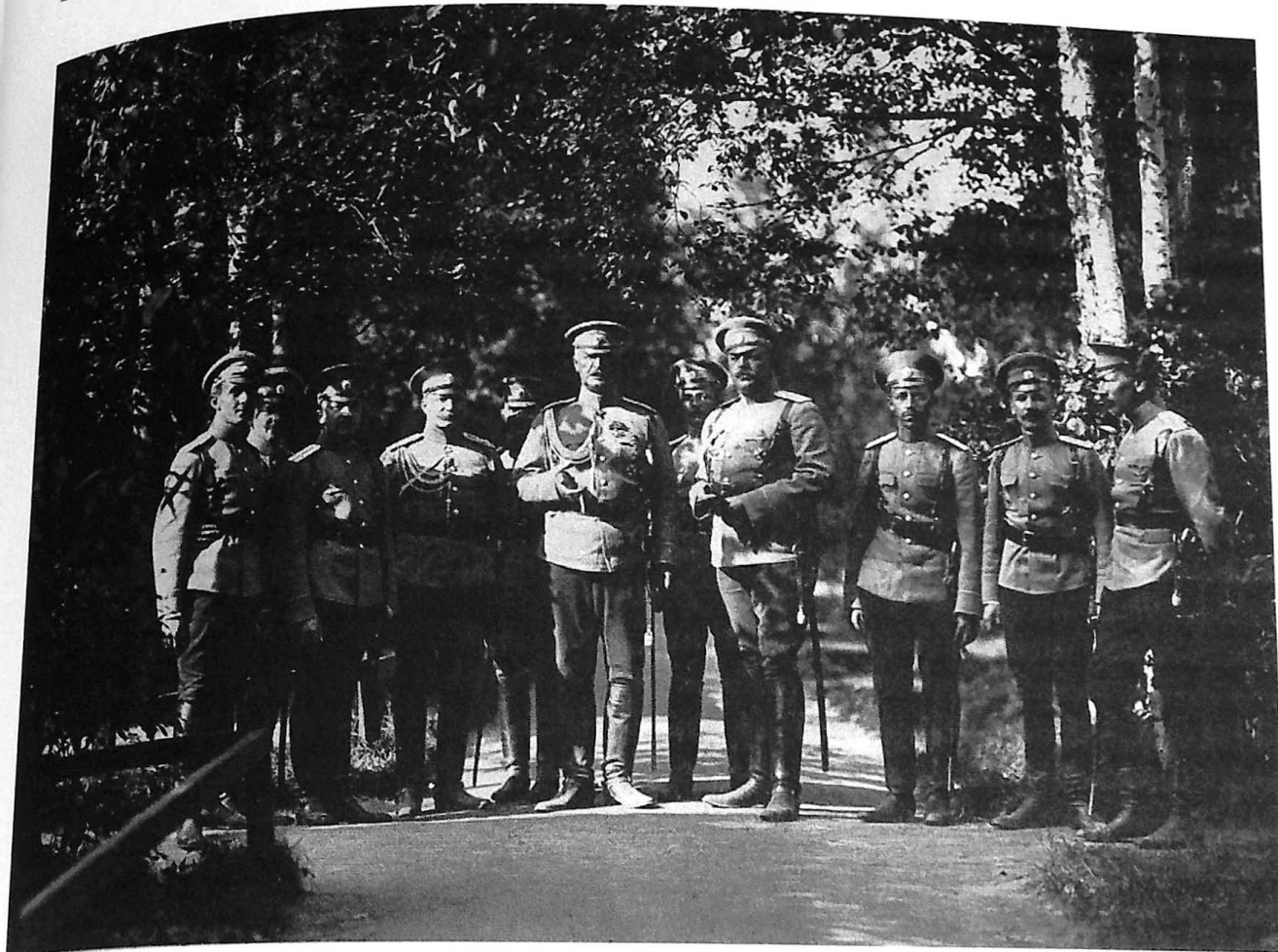
Ил. 8. Офицеры Лейб-Гвардии Саперного батальона в Усть-Ижорском лагере.

1913. Инв. № ИДФ А/2021 №4*