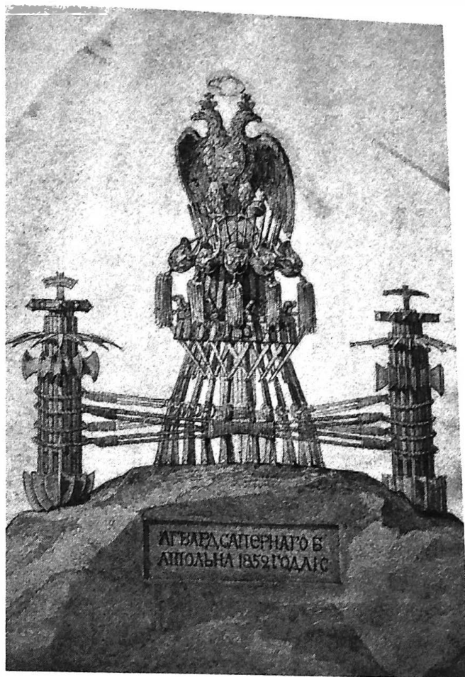
Ил. 5. А. И. Штакеншнейдер. Проект памятника Лейб-Гвардии Саперному батальону. Фрагмент. Двуглавый орел, правки Николая I: набросок короны, линия крыла

Скорее всего, и помещенная на проекте памятная надпись была изменена при создании памятника по желанию Николая Павловича. Надпись на проекте свидетельствует о том, что памятник создавался к 40-летию батальона: «ЛГВАРД. САПЕРНАГО БАТАЛЬОНА 1852 ГОДА ІС»; надпись же на самом памятнике подчеркивает заслуги батальона: «ПОДВИГАМЪ ЛЕЙБЪ-ГВАРДИИ САПЕРНАГО БАТАЛІОНА». И это не случайно: император всю свою жизнь помнил преданность гвардейских саперов, проявленную в тяжелый для него и династии день 14 декабря 1825 года, когда батальон в полном составе бегом прибыл во двор Зимнего дворца на защиту императорской семьи. Николай I вспоминал: «Ежели б саперный батальон опоздал только несколькими