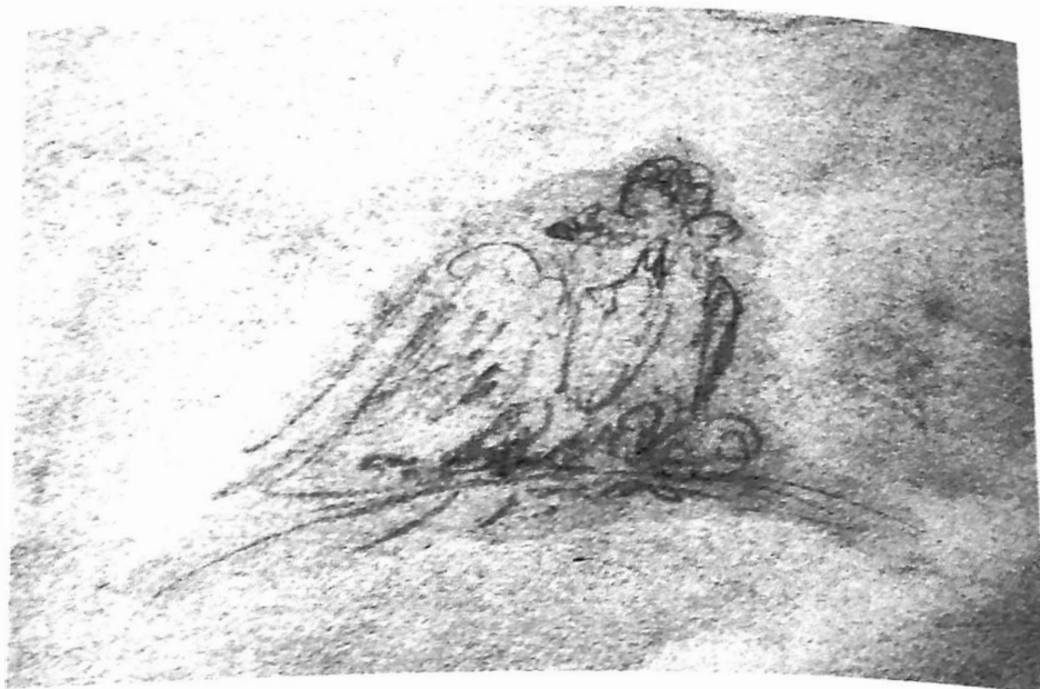
Ил. 6. А. И. Штакеншнейдер. Проект памятника Лейб-Гвардии Саперному батальону. Фрагмент