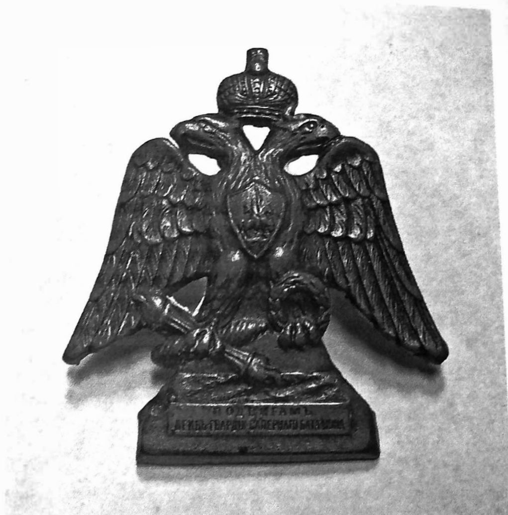
Ил. 7. Знак Лейб-Гвардии Саперного батальона (для нижних чинов). Бронза. Высочайше утвержден 31 октября 1912 года. Инв. № ИДФ 30/122. Военно-исторический музей артиллерии, инженерных войск и войск связи