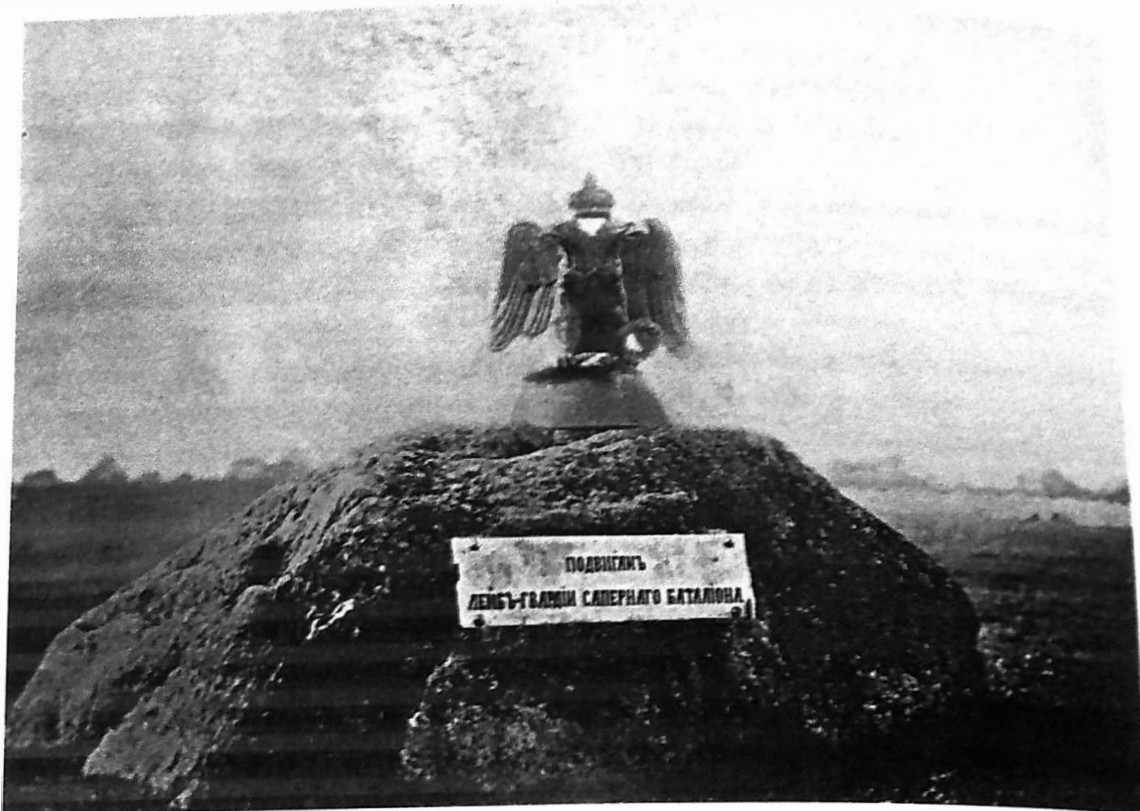
Ил. 1. Памятник «Подвигам Лейб-Гвардии Саперного батальона» в Петергофе. Фотография К. Фишера. XIX век. Инв. № ИДФ А/930. Военно-исторический музей артиллерии, инженерных войск и войск связи