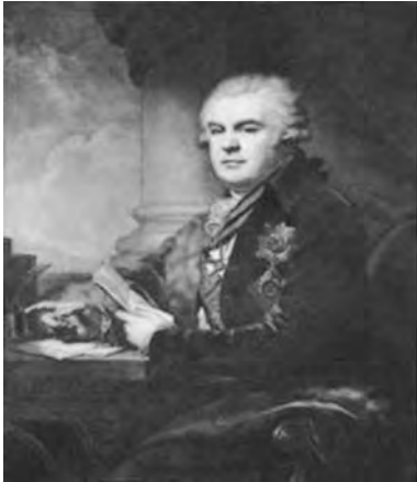
Ил. 1. Портрет графа А.Н. Самойлова. 1792 г. Худ. И.Б. Лампистарший (Архив Раевских. Т. 1. СПб., 1908).

дровне Потемкиной, старшей сестре фаворита Екатерины II князя Григория Александровича Потемкина. Брачный союз сразу вывел заурядную семью в аристократическую среду. В 1770-е гг. отношения между Г.А. Потемкиным и императрицей были особенно близки, и далеко не случайно в 1777 г. Н.Б. Самойлов одновременно жалуется в тайные советники и сенаторы 5 . О новом положении рода однозначно свидетельствовали браки, заключенные во второй половине XVIII – начале XIX в. с представителями знатных семей: князьями Трубецкими, Раевскими, графами фон дер Пален, графами Бобринскими.