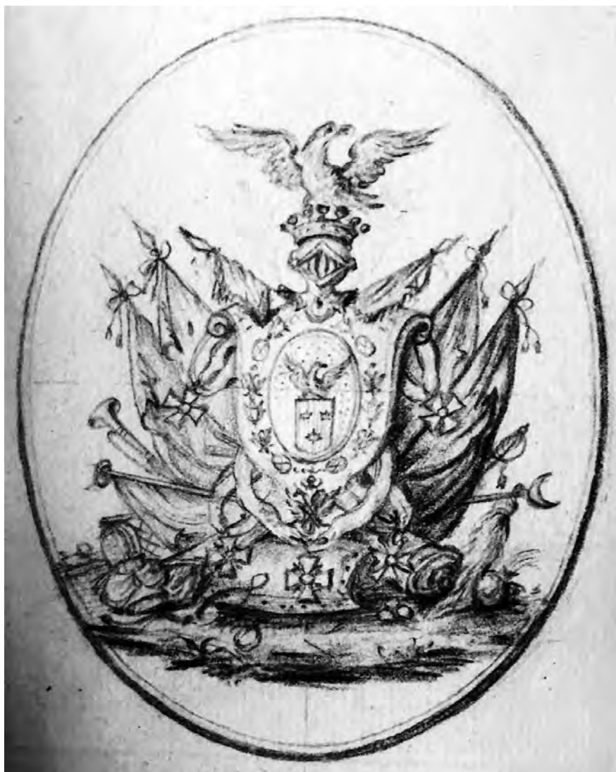
Ил. 5. Проект графского герба Самойловых. Не ранее 1 января 1795 г. РГАДА. Ф. 1453. Оп. 1. Д. 1. Л. 35 а. Публикуется впервые.