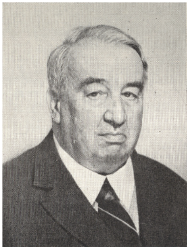
Лев Владимирович Черепнин. 1970-е гг.

ческого прошлого, т.е. являлись вспомогательными историческими дисциплинами в настоящем смысле слова. Гербы интересовали В.К. Лукомского не формально , в качестве отличительных признаков дворянских родов. Гербы он рассматривал как исторический источник . Понимание гербовых изображений являлось для него ключом к уяснению значения 61 многих памятников нашего исторического прошлого. Монеты, лучшие произведения искусства, старинные книжные собрания оживали и освещались новым светом на основе наблюдений над гербами. Такое значение геральдики с предельной ясностью 62 раскрыто Лукомским в его великолепном сжатом очерке «Гербоведение», 63 напечатанном