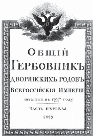
«Общий гербовник». Первая часть. Титульный лист. 1799 г.