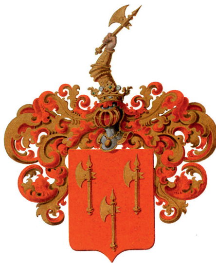
Ил. 11. Герб рода Кроль (Общий гербовник. Ч. XIII. С. 118) // РГИА. Ф. 1411. Оп. 1. Д. 103. Л. 118).

Третий предмет с гербом Кролей – сургучовый бордовый оттиск печати второй половины XIX столетия. Оттиск Кролей меньше их геральдического штампея из музейного собрания и имеет продолговатую овальную форму, на щите герба отсутствует шраффировка. В остальном