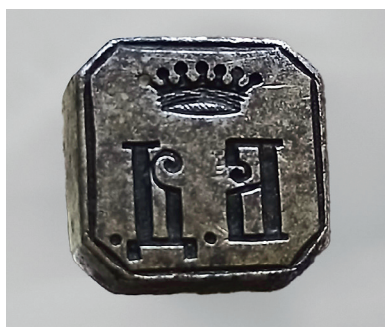
Ил. 4. Печать-штамп с геральдической баронской короной семьи фон Дельвиг и монограммой «Б. Д.». Металл, чернение. Конец 1860-х – начало 1870-х. Национальный музей Республики Татарстан. Инв. № КМГ КП-32830/102