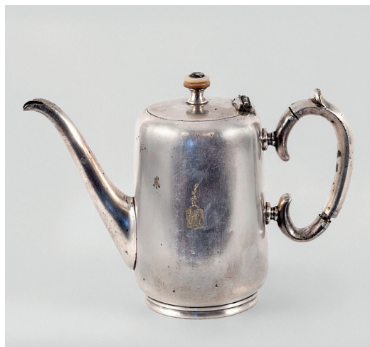
Ил. 1. Серебряный кофейник с дворянским гербом рода Кроль. Между 1865 и 1885. Национальный музей Республики Татарстан. Инв. № КМГ КП-32830/40