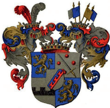
Ил. 9. Герб баронов фон Дельви́г, поданных королевства Шве́ции. Воспроизводится по изданию: Baltisches Wappenbuch : Wappen sammtlicher den Ritterschaften von Livland, Estland, Kurland und Oesel zugehörigen Adelsgeschlechter / Hrsg. von C. A. von Klingspor ; die Wappen sind gezeichnet von Ad. M. Hildenbrandt. Stockholm, 1882. S. 25

в русской геральдике дворянской коронной, аналогичной в европейских державах – Германии, Швеции, Дании, Бельгии и Голландии. Корона представляет собой золотой обруч с тремя видимыми листовидными зубцами, между которыми два малых зубца с жемчужинами.