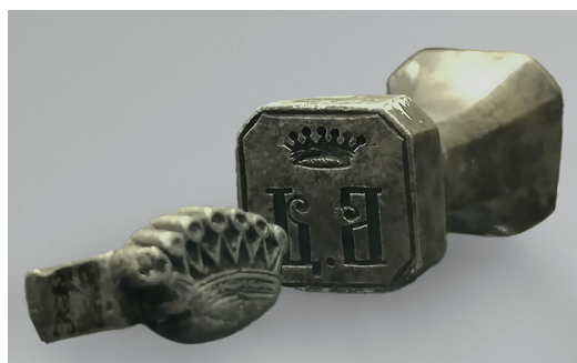
Ил. 3. Две печати-штампа с геральдическими баронскими коронами семьи баронов фон Дельвиг. Металл, чернение. Конец 1860-х – начало 1870-х. Национальный музей Республики Татарстан. Инв. № КМГ КП-32830/102, КМГ КП-32830/103