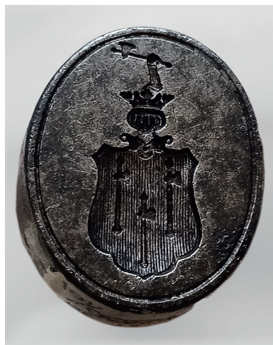
Ил. 2. Печать-штамп с дворянским гербом рода Кроль. Металл, чернение. Между 1865 и 1885. Национальный музей Республики Татарстан. Инв. № КМГ КП-32830/101