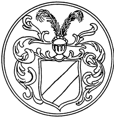
Ил. 7. Основной герб фамилии фон Дельви́г.