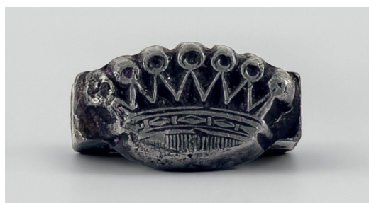
Ил. 5. Печать-штамп в форме перстня с геральдической баронской короной семьи фон Дельвиг. Металл, чернение. Конец 1860-х – начало 1870-х. Национальный музей Республики Татарстан. Инв. № КМГ КП-32830/103