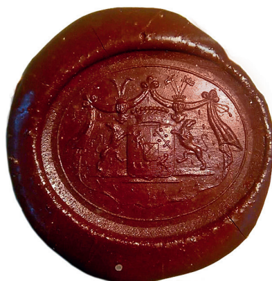
Ил. 10. Оттиск с самобытного герба российских баронов фон Дельвиг с печати второй половины XVIII века. Архив музея Е. А. Боратынского (филиал Национального музея Республики Татарстан)