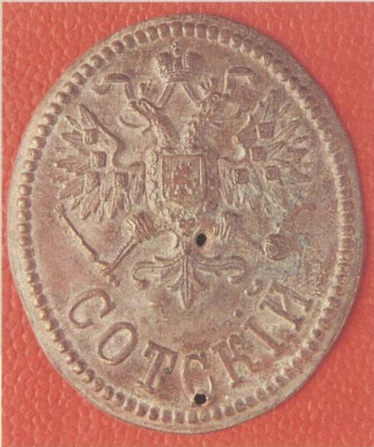
Бляха сотского. 102x88 мм. Латунь.

Характерно, что эти нюансы лично понимали российские законодатели. С одной стороны, в архивах сохранилось немало писем от губернаторов с просьбой учре-