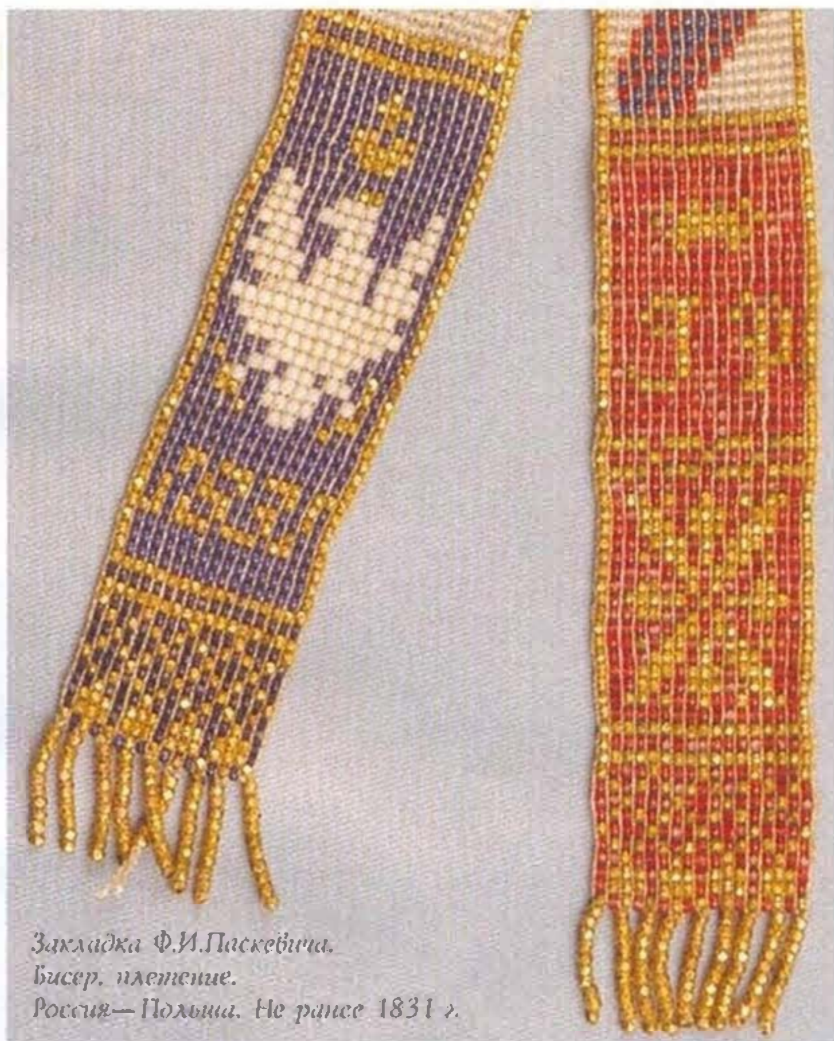
Закладка Ф.И.Паскевича. Бисер. плетение. Россия—Польша. Не ранее 1831 г.

(1782—1856), в 1831 году назначенный наместником Царства Польского.