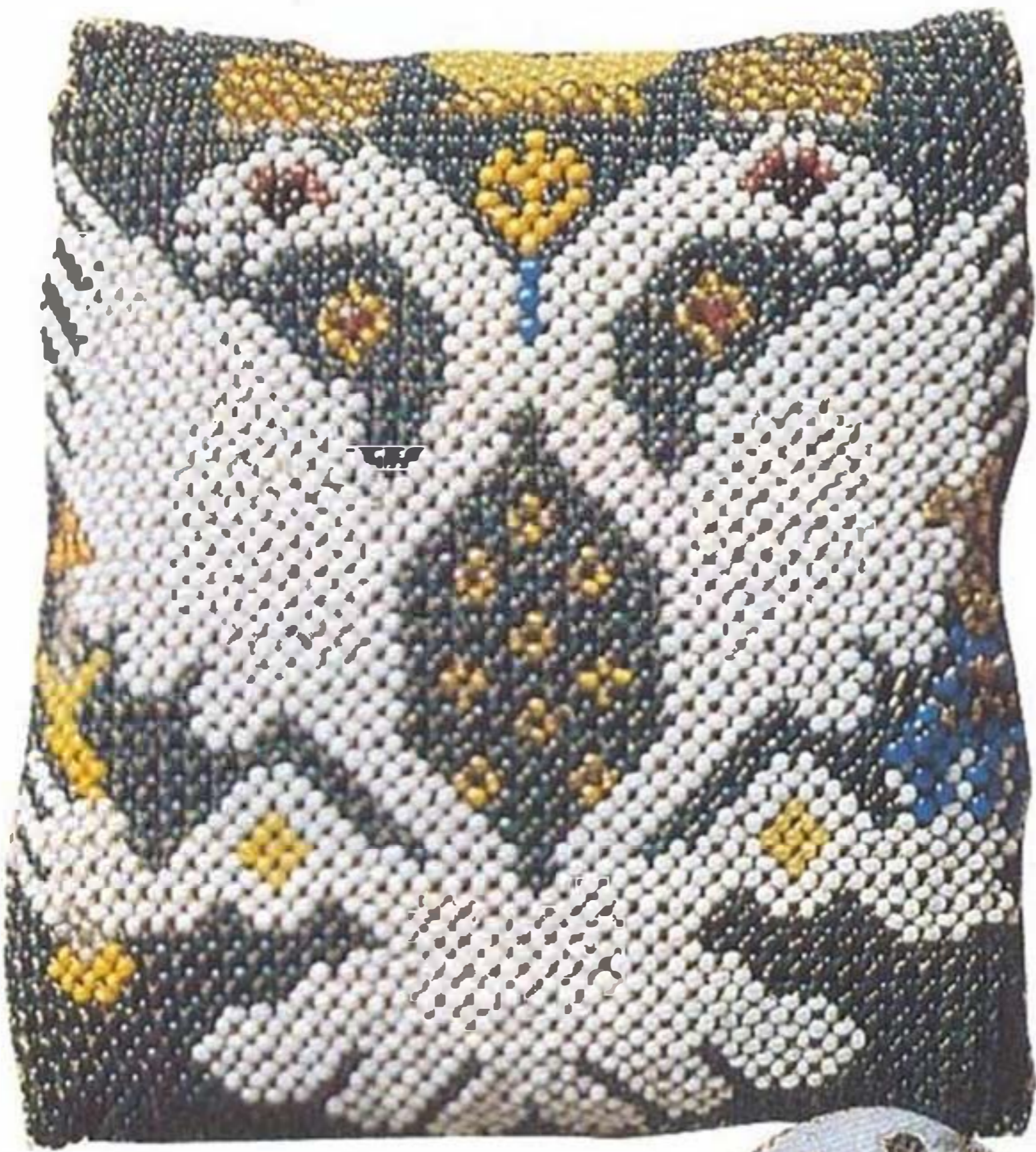
Закладка-подушка. Бисер. Россия. Середина XVIII в.