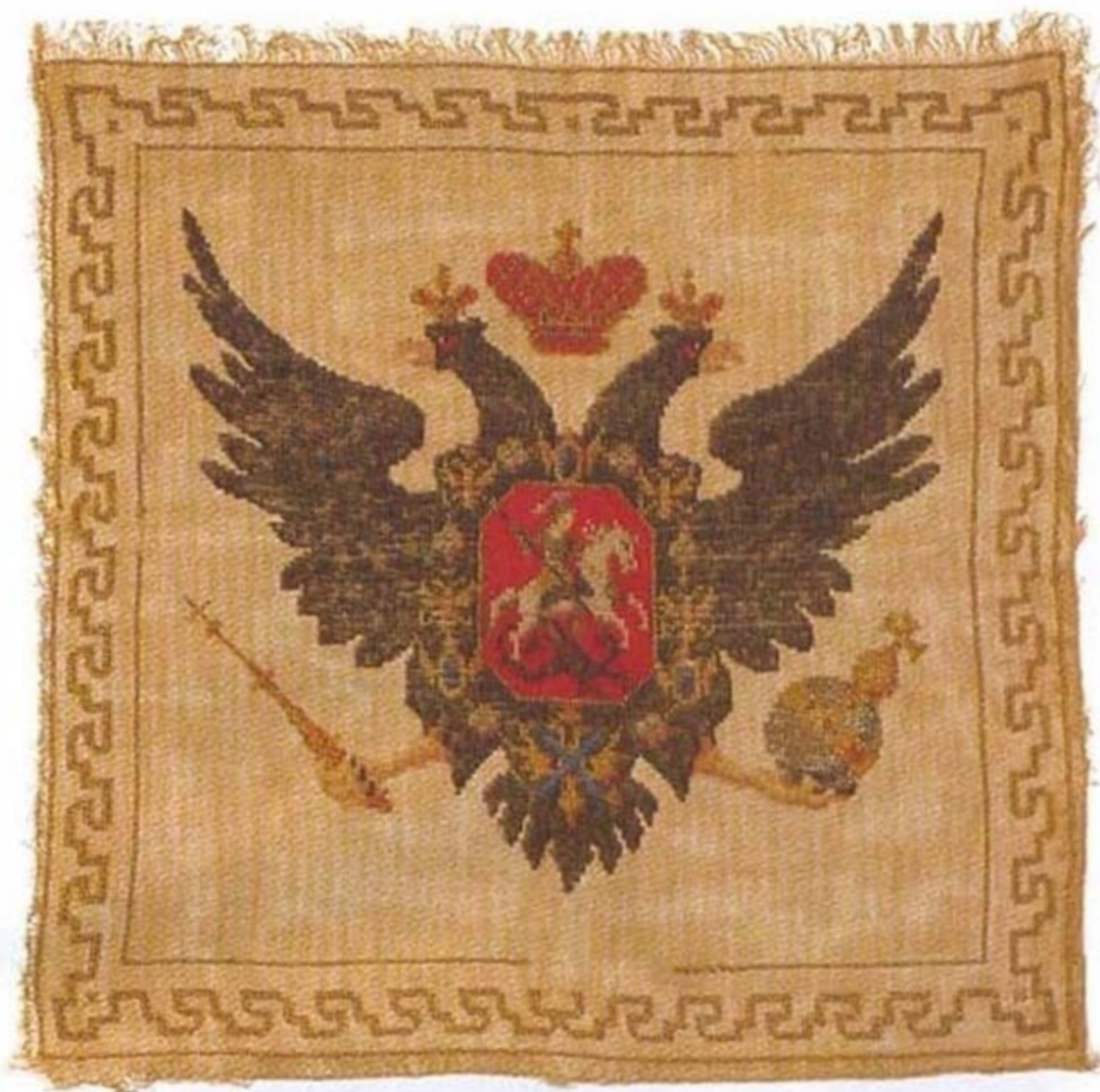
Салфетка декоративная. Бисер, вышивка по ситю. Россия. Первая четверть XIX в.

На небольшом панно, некогда, вероятно, служившем вставкой в переплет книги, альбома, в крышку коробки или, что менее вероятно, изначально предназначавшемся