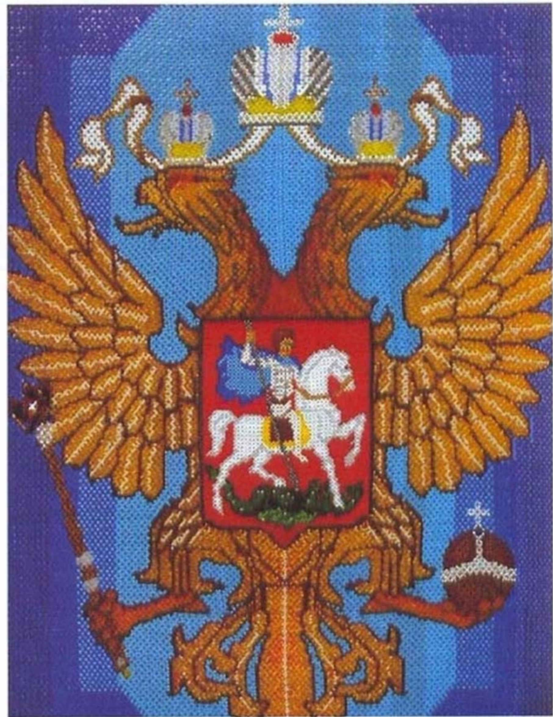
Панно декоративное. Автор Б.Д. Городецкий. Бисер, плетение. Россия. Около 2000 г.

Как известно, орел — не исключительно российская геральдическая фигура. Он изображен на регалиях и дру-