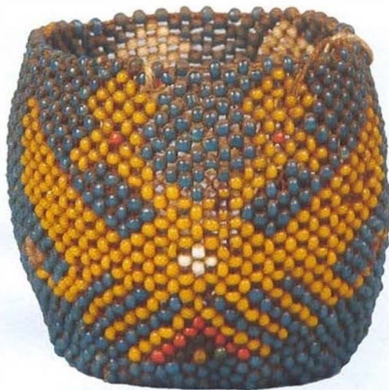
Чехол на стакан. Бисер, плетение. Россия. Середина XVIII в.

Все эти бисерные изделия выполнены в техниках вышивки и плетения (тканья) — самых консервативных в истории бисерного искусства. В работах испол-