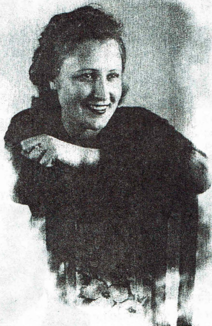
Моя мама. 1943 г.

В последнее время с помощью Интернета постепенно заполняется вакуум по геральдике многих стран мира, но кроме возможности увидеть иноземные гербы, необходимо еще правильно их описать, систематизировать и донести эти сведения до широкого круга читателей. Вот почему я написал, пишу и буду писать свои статьи. Пусть даже они носят не научный, а только информационный характер, но судя по отзывам тех кто их читал, верю, что мои усилия не пропадут в туне.