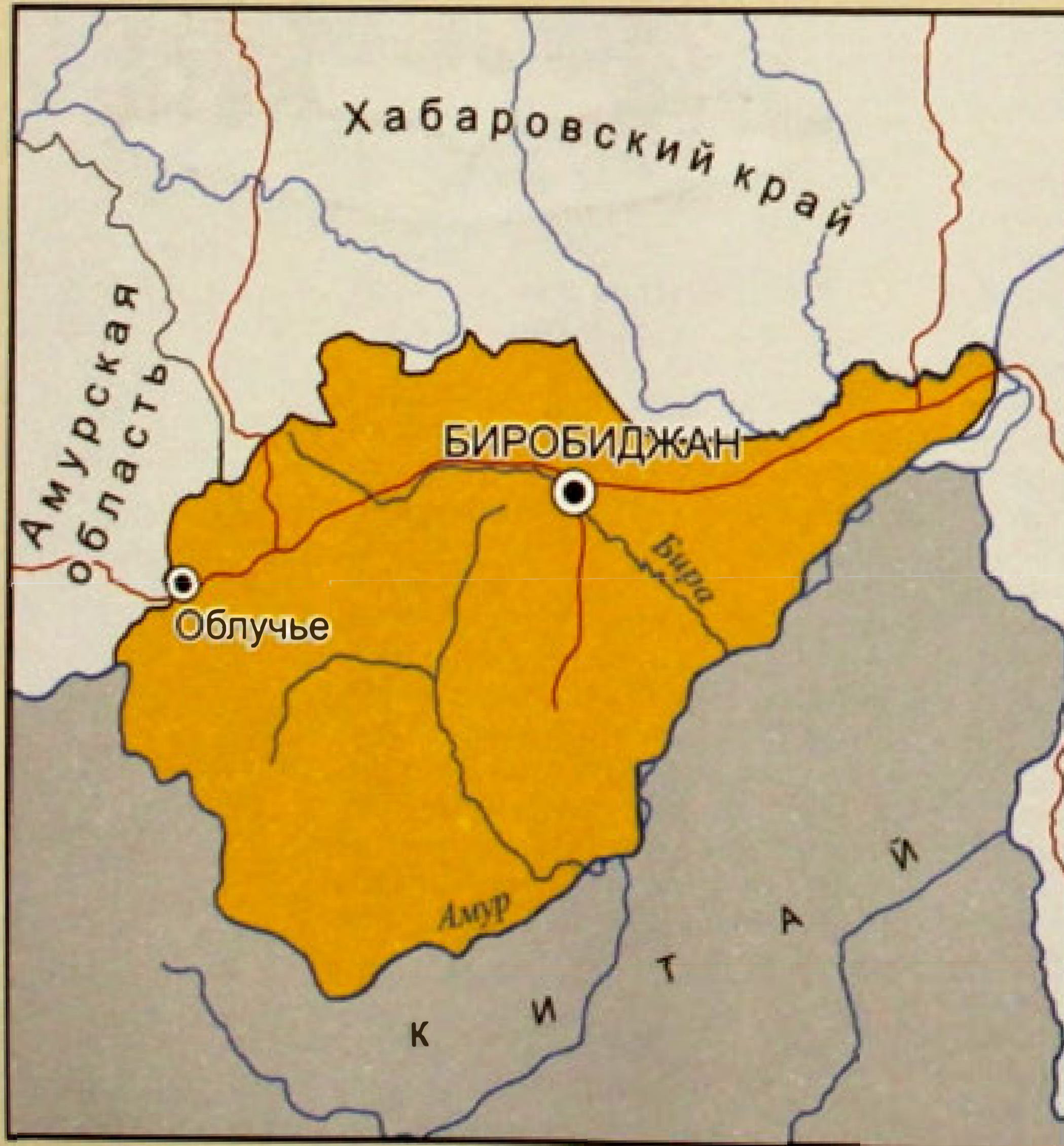
▲ Карта Еврейской автономной области.

28 марта 1928 г. советское правительство приняло решение отвести район Биробиджана для заселения лицами еврейской национальности. Было определено, что при благоприятных условиях на этих землях будет образована еврейская национальная административно-территориальная единица. В 1930 г. в составе Дальневосточного края был создан Биробиджанский национальный район с центром на станции Тихонькая. 7 мая 1934 г. его преобразовали в Еврейскую автономную область с центром в поселке Биробиджан (до 1932 г. — станция Тихонькая).