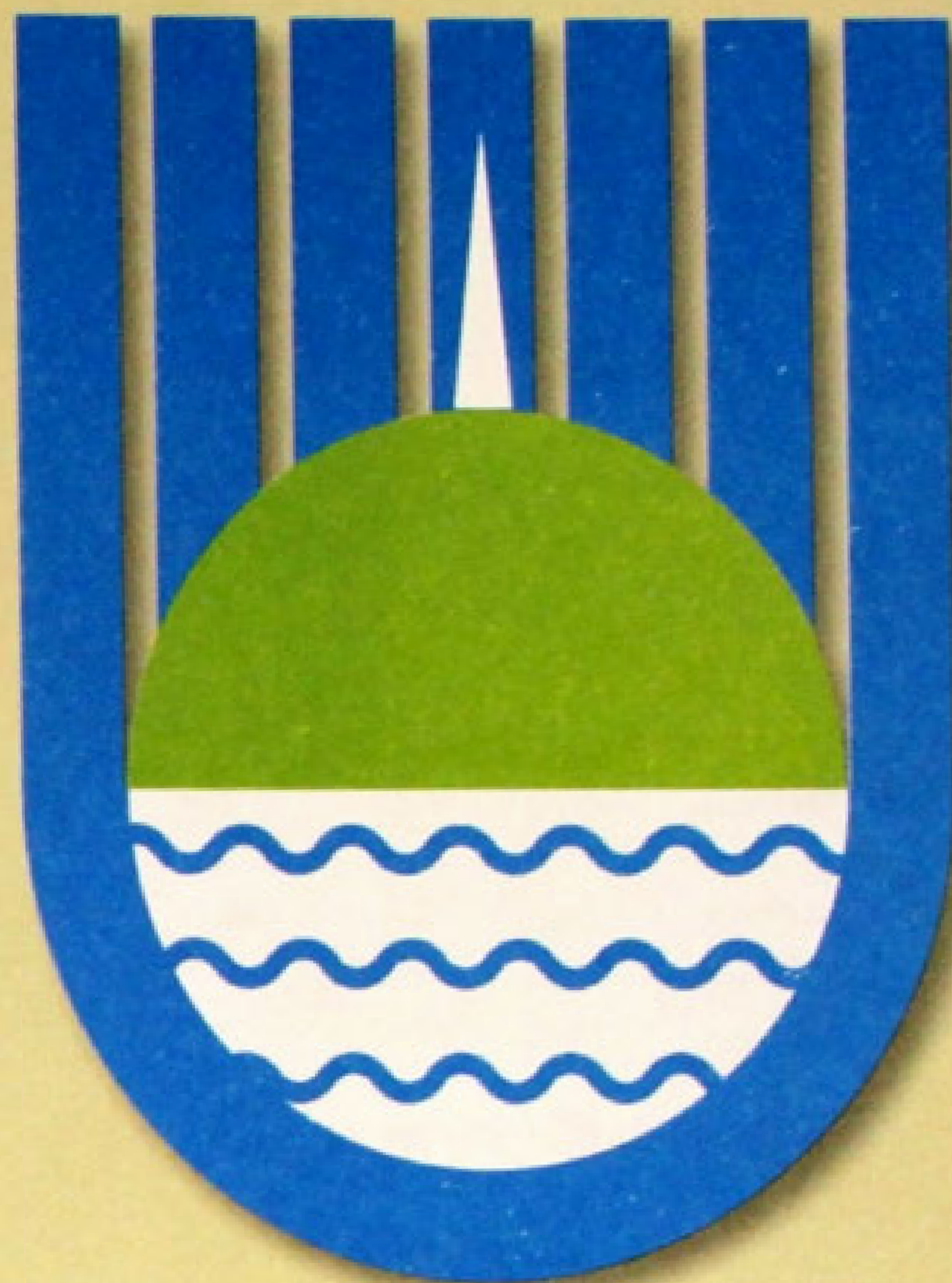
▲ Герб города Биробиджан (2004).

В верхнем секторе золотого цвета находится изображение зеленых гор (сопок), над которыми восходит красное солнце с лучами. В нижнем секторе на зеленом фоне изображены золотой свиток с датой основания села — «1858», выполненной красными цифрами, две серебряные казачьи шашки с черными рукоятками, два золотых колоса и серебряная лента с названием муниципального образования. Шашки символизируют историческое предназначение района — развитие и защиту государства, а также казаков из центральной России, переехавших сюда для государственной пограничной службы. Колосья символизируют хорошо развитое сельское хозяйство района.