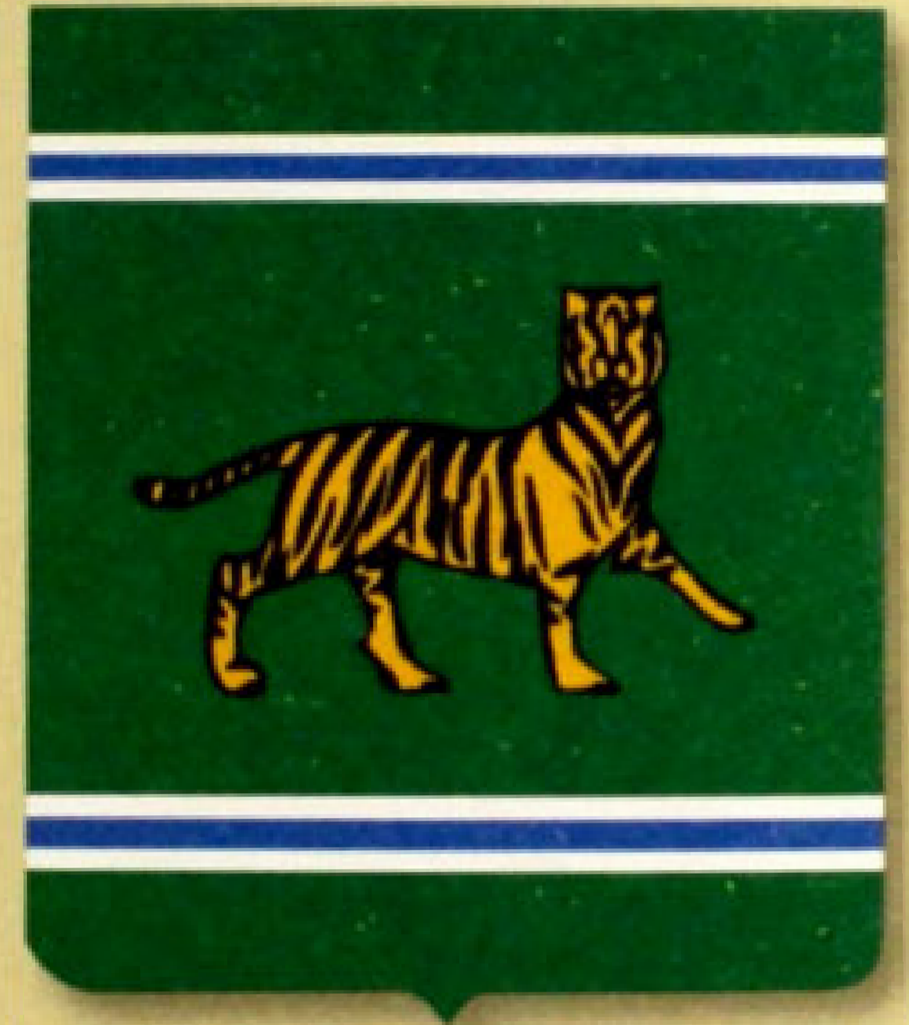
▲ Герб Еврейской автономной области (1996).