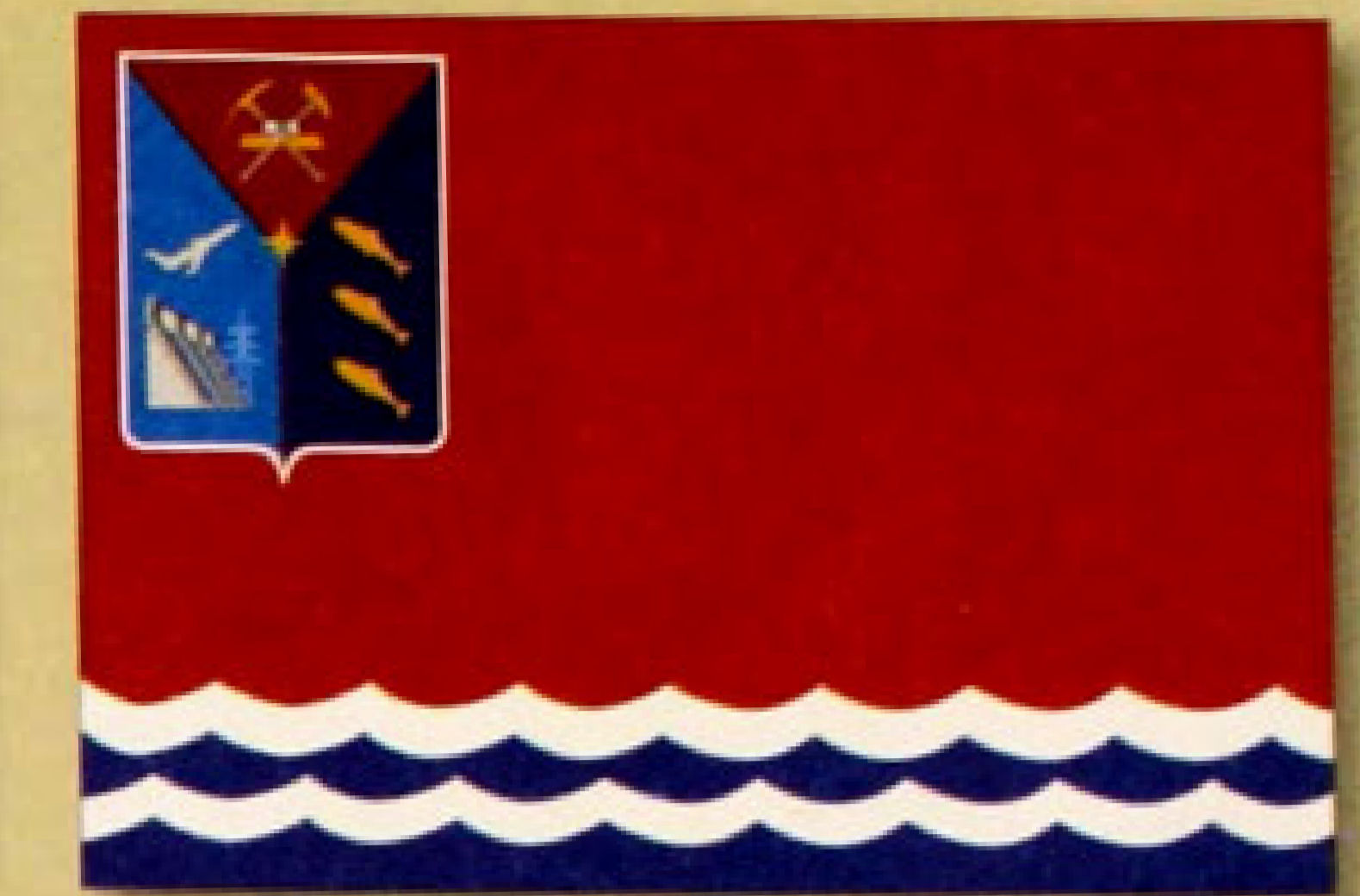
▲ Флаг Магаданской области (2001).