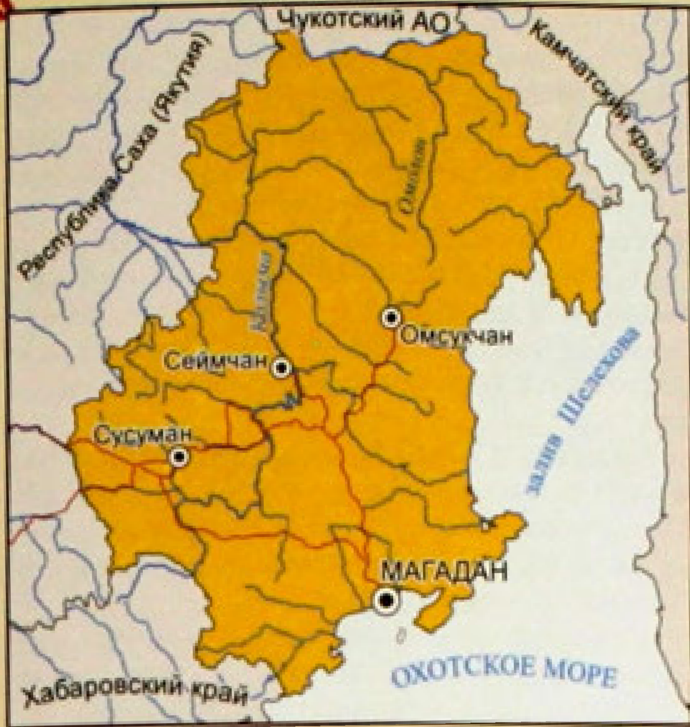
▲ Карта Магаданской области.

области. Вдоль нижней кромки полотнища проведены четыре волнистых полосы с чередованием синего и белого цветов.