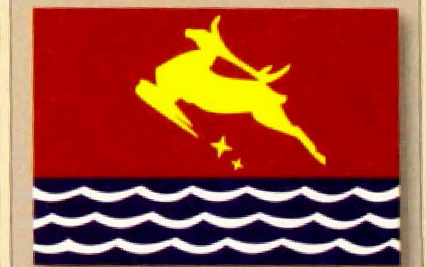
▲ Флаг города Магадан (1999).

червленого (красного) цвета, с лазоревой (синей, голубой) оконечностью. В центральной части щита изображен золотой скачущий олень, под которым помещены две золотые четырехлучевые звезды. Первая из них большего размера. Через оконечность щита проходят три волнистые горизонтальные серебряные линии.