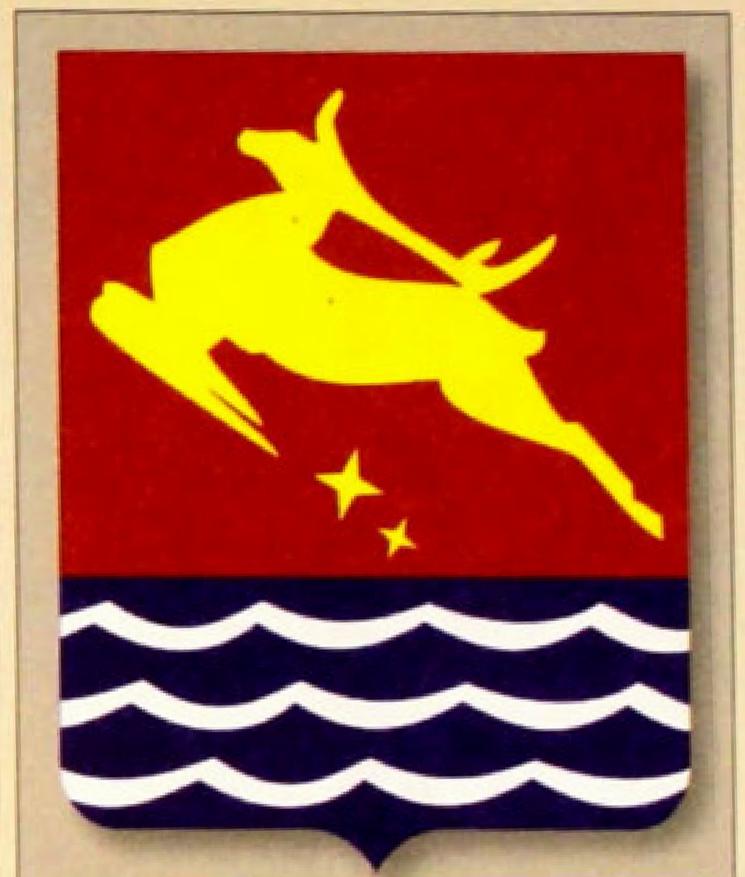
▲ Герб города Магадан (1999).

Герб города Магадан был утвержден 28 августа 1999 г. и внесен в Государственный геральдический регистр Российской Федерации под номером 601. Он представляет собой геральдический щит французской формы,