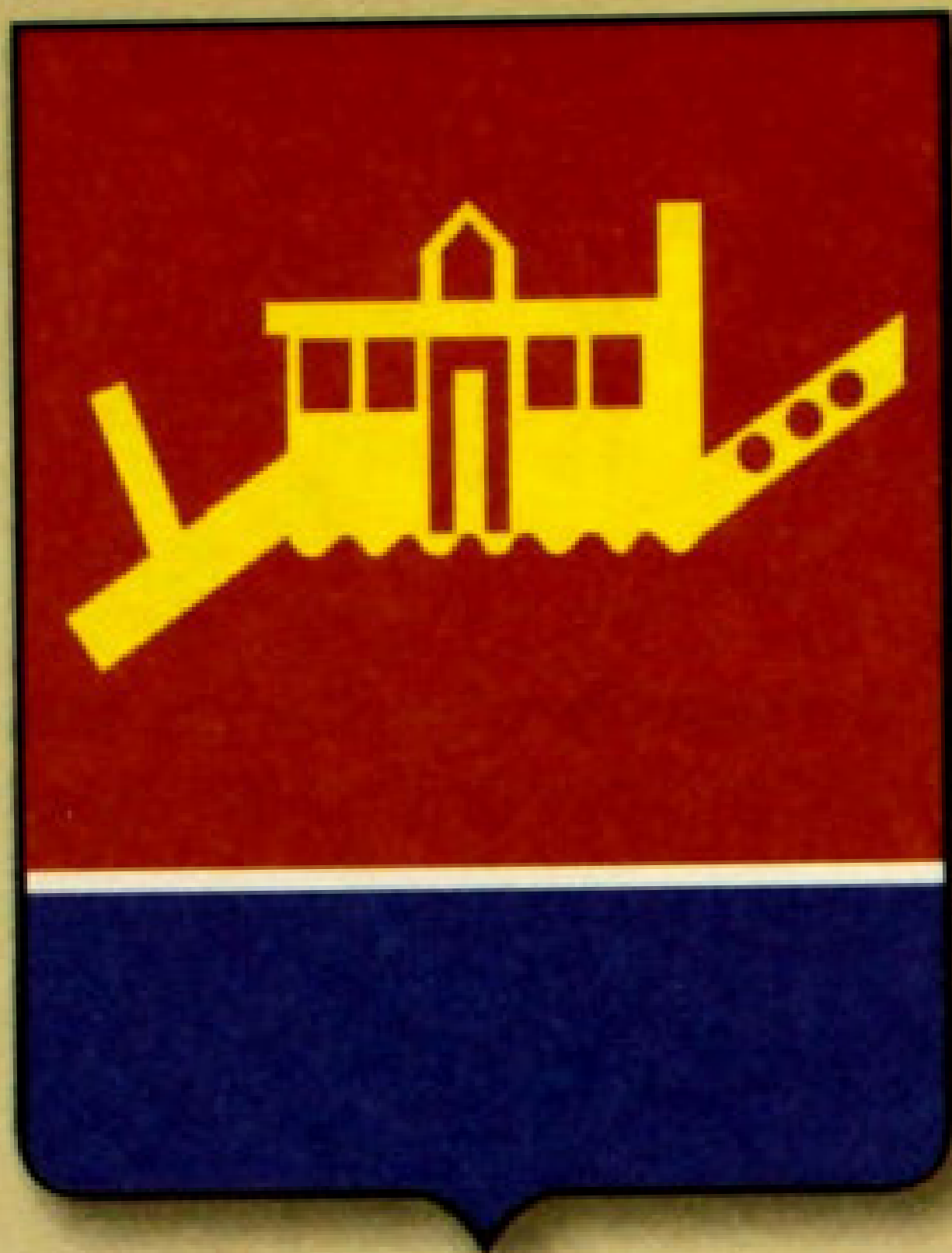
▲ Герб города Сусуман (2002).

прямоугольное полотнище с соотношением сторон 2:3. Полотнище состоит из двух раз-