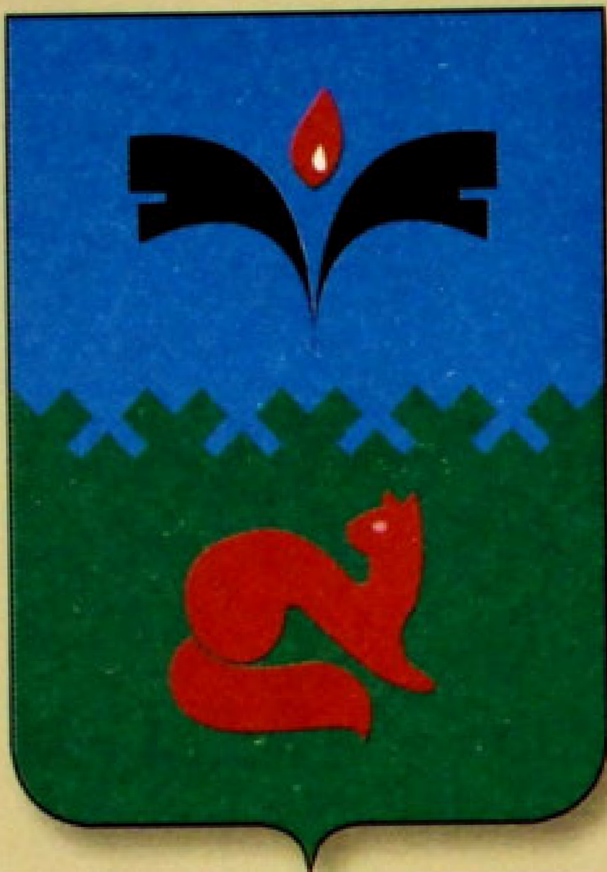
▲ Герб города Покачи.