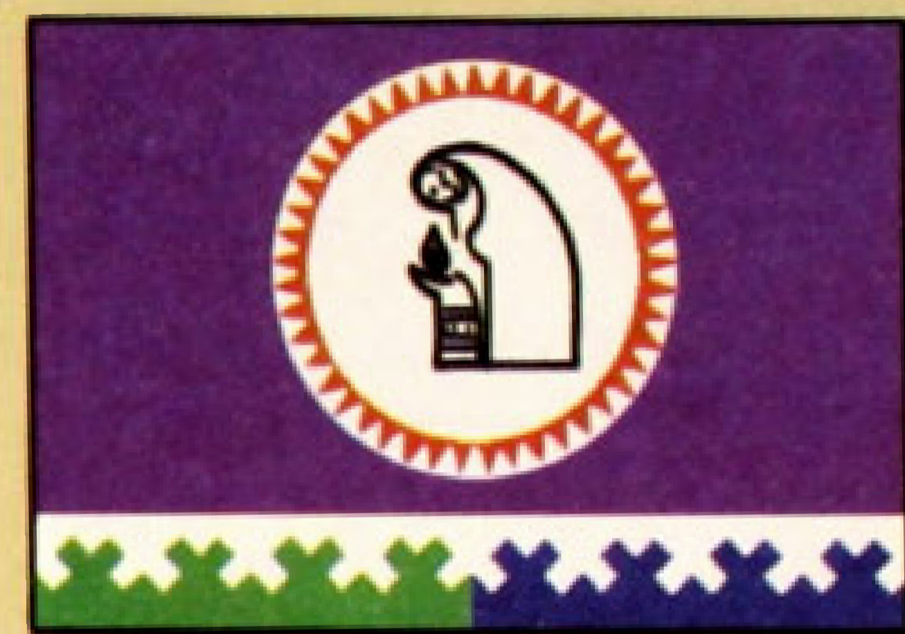
▲ Флаг Октябрьского района.

центром является рабочий поселок Октябрьское (ранее — Кондинское). В Российской империи село Кондинское входило в Березовский уезд Тобольской губернии.