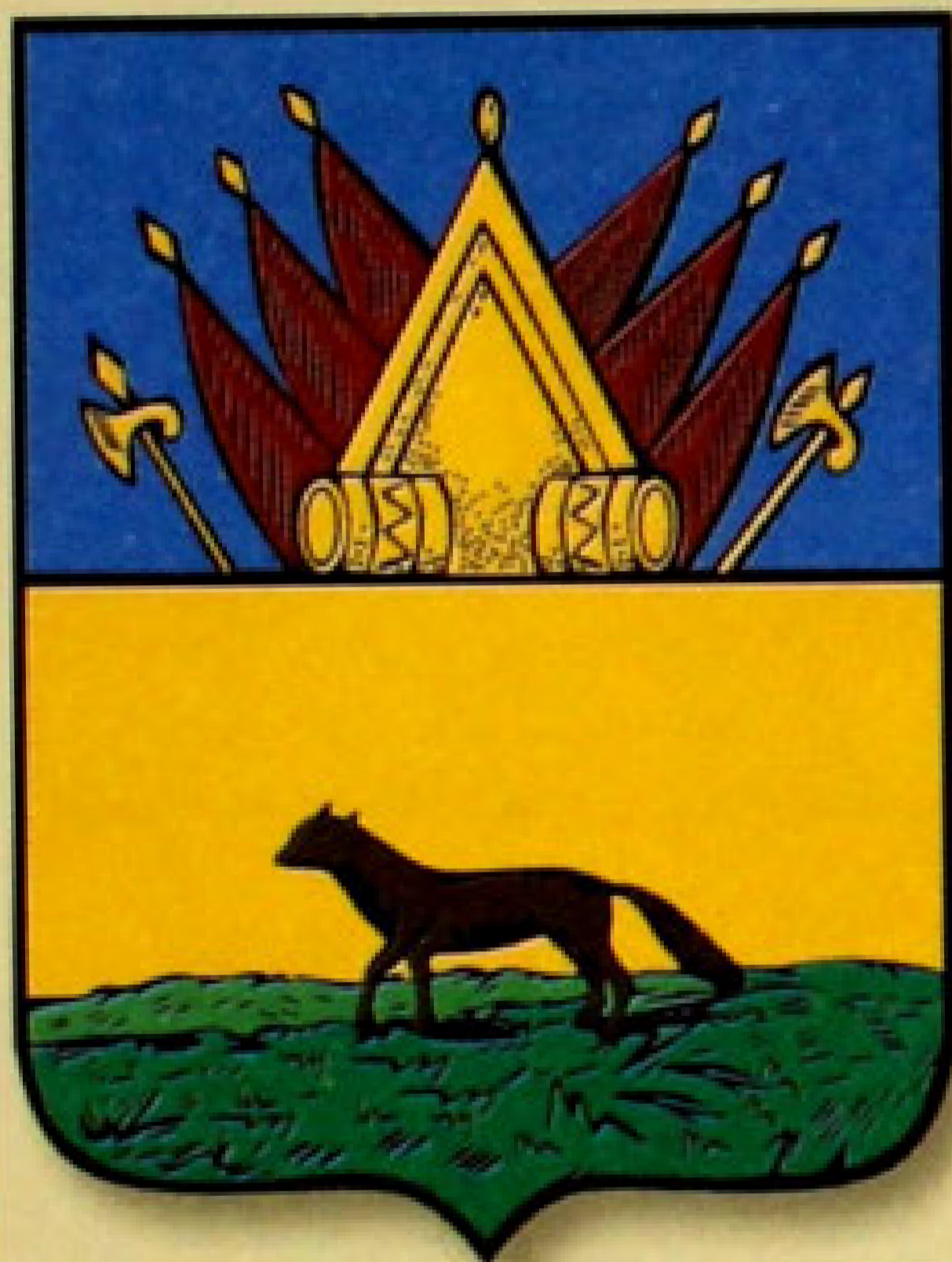
▲ Герб города Сургут (1785).