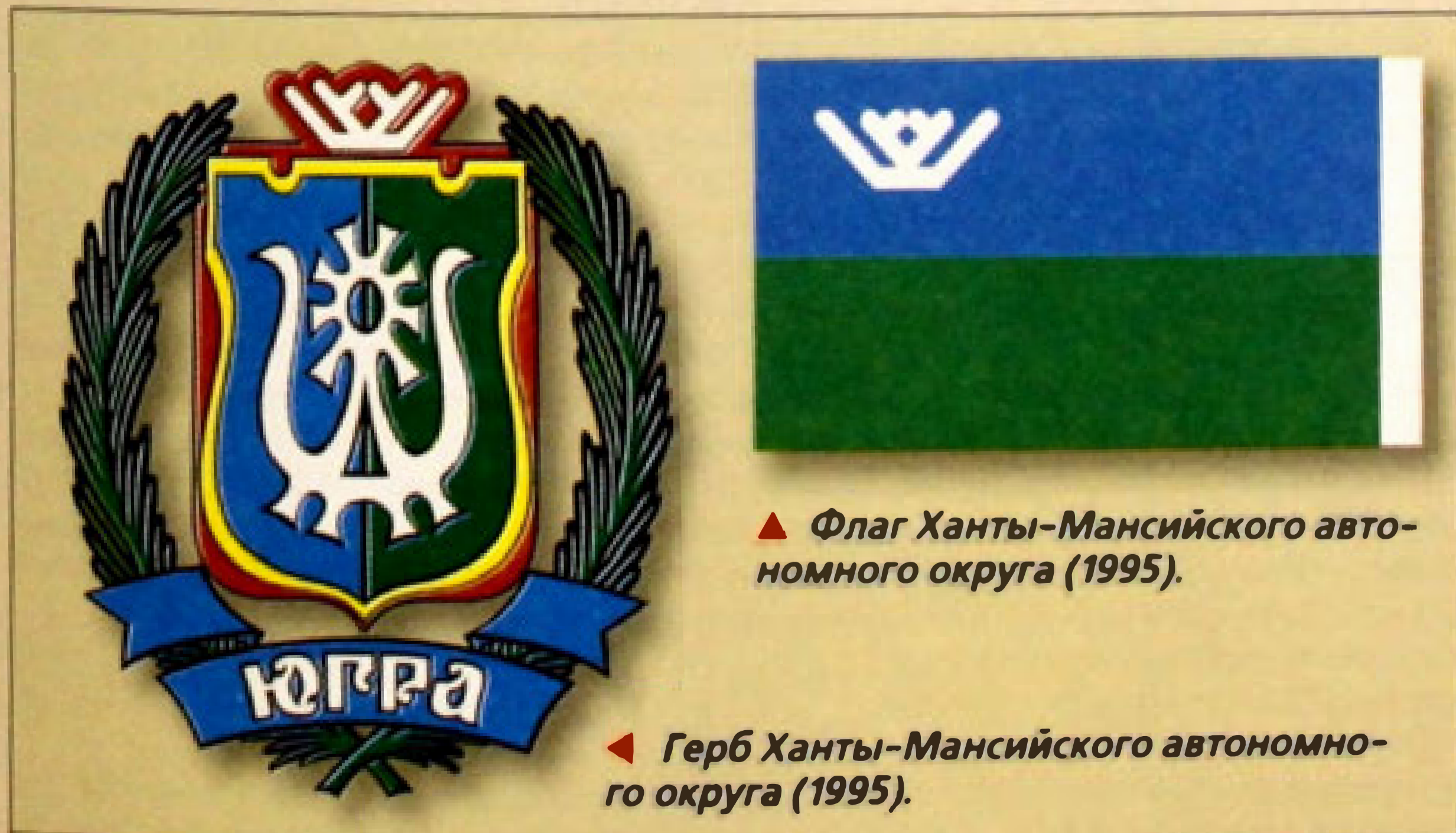
▲ Флаг Ханты-Мансийского автономного округа (1995).