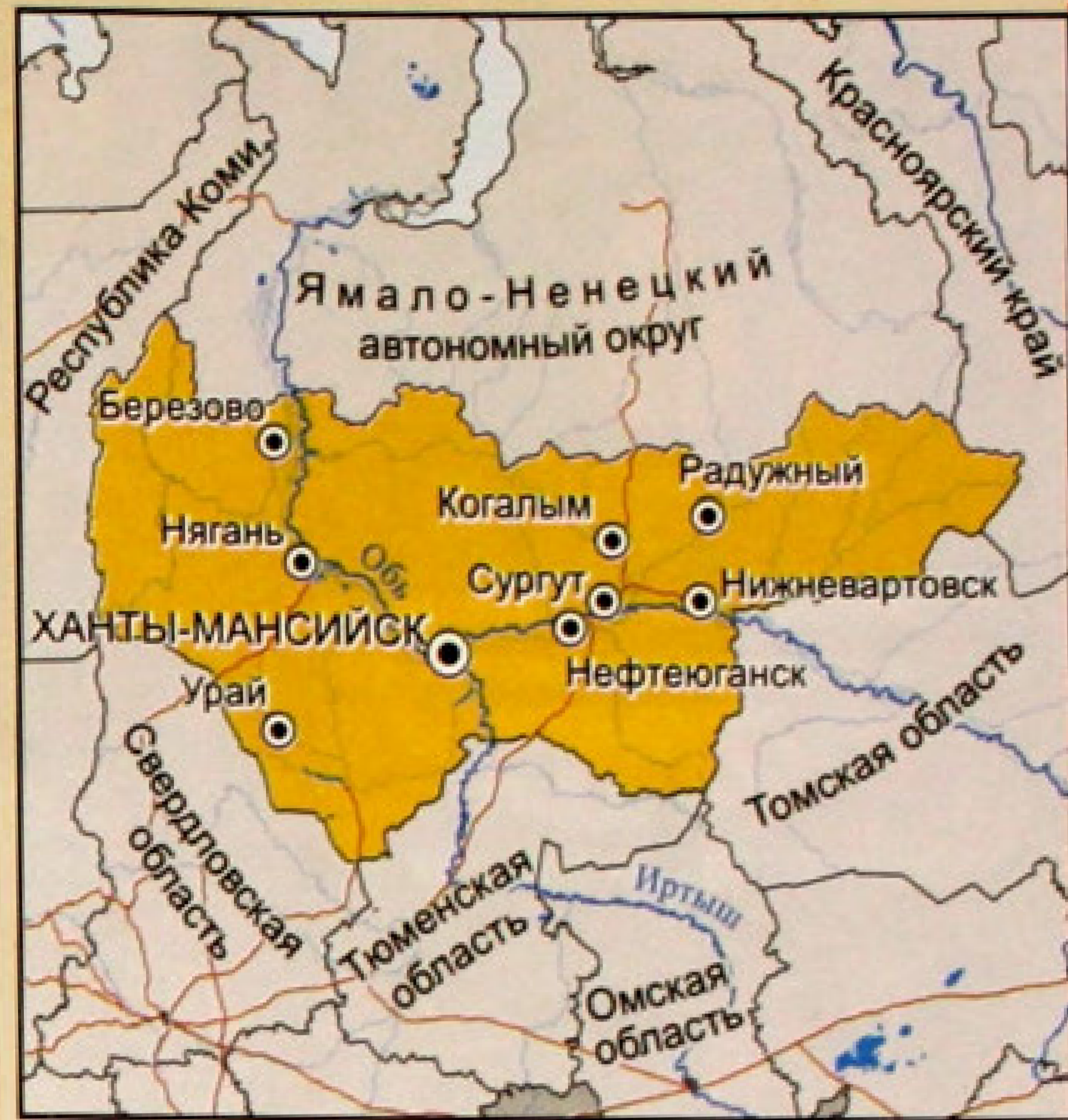
▲ Карта Ханты-Мансийского автономного округа – Югра.

В конце 70-х гг. XX в. в этих краях появились первые нефтедобытчики. Весной 1978 г. в составе производственного объединения «Нижневартовскнефтегаз» в качестве базового предприятия Когалымского региона было образовано нефтегазодобывающее управление «Повхнефть», и в 1979 г. началась эксплуатация первого местного месторождения — Повховского. В связи с масштабностью нефтяных разработок в этом регионе