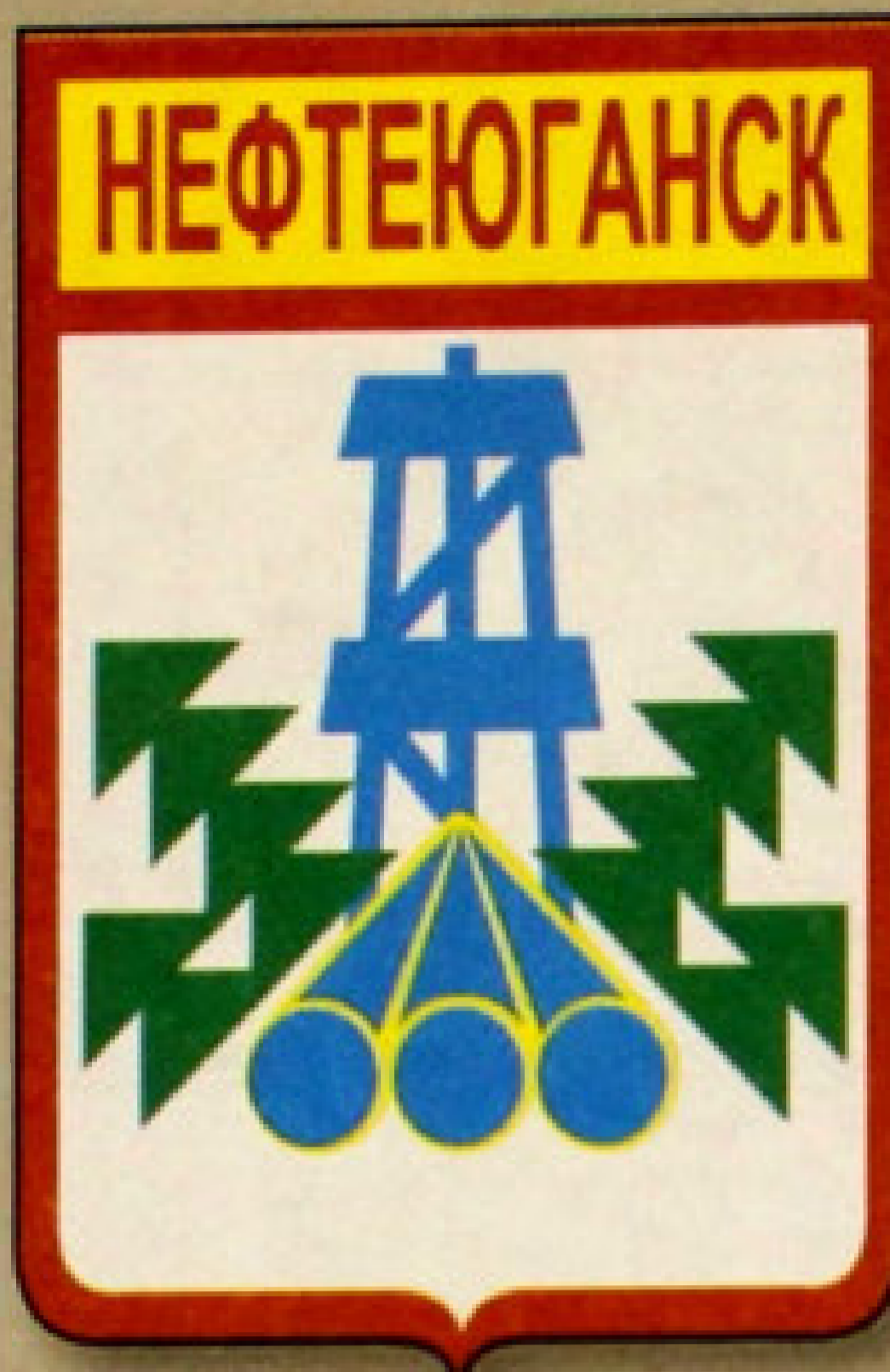
▲ Герб города Нефтеюганск.