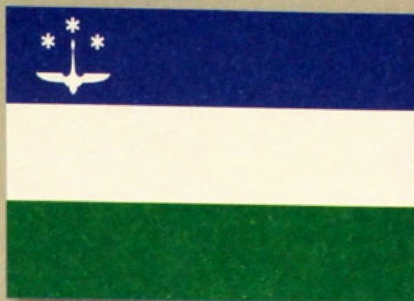
▲ Флаг города Ханты-Мансийск (1995).