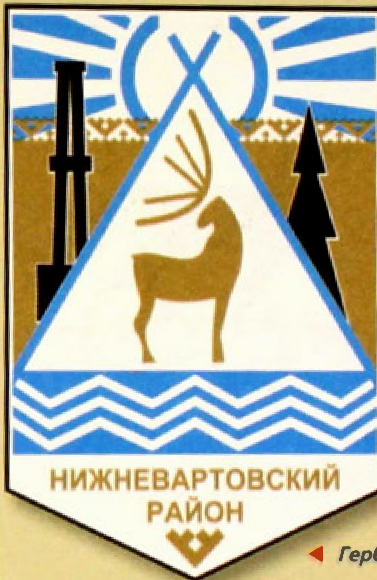
◀ Герб Нижневартовского района (1996).

му здесь изображены белый чум и олень — традиционное жилище коренных народов и животное, которое помогает им кормиться и одеваться. Темно-голубой цвет в верхней и нижней части щита символизирует небо и воду, а центральная часть красно-коричневого тона — землю.