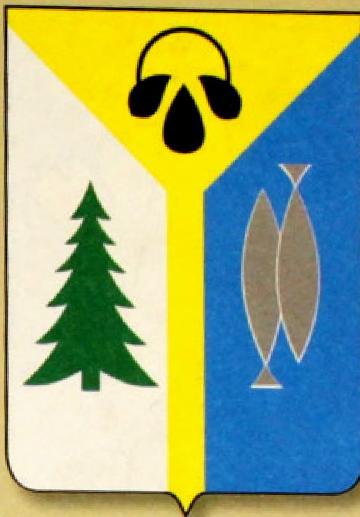
▲ Герб города Нижневартовск (1999).

Герб Нижневартовского района был утвержден решением Думы 26 января 1996 г. Он представляет собой геральдический щит белого цвета. Композиция, размещенная в середине щита, указывает на то, что первыми территорию района осваивали ханты и манси, именно поэто-