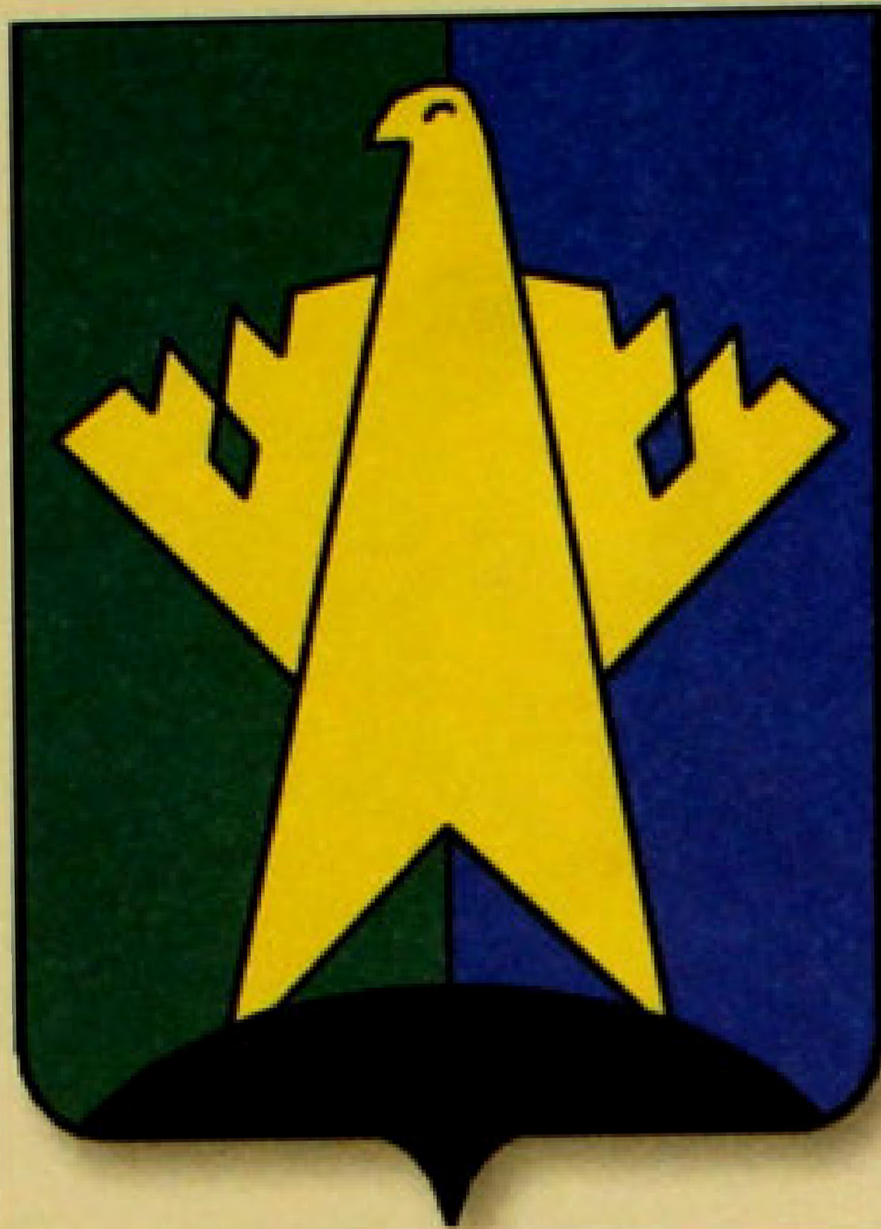
▲ Герб Сургутского района.