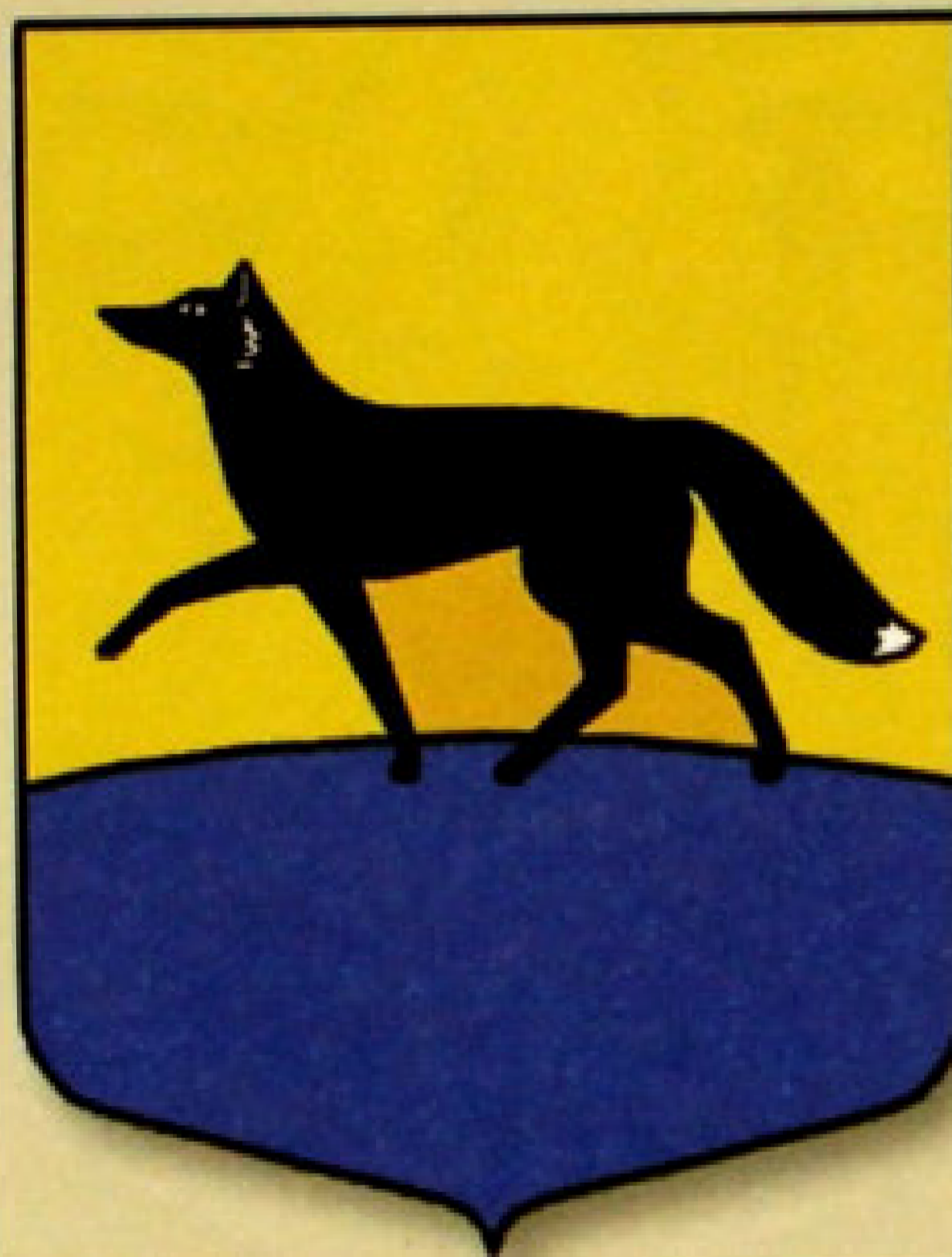
▲ Герб города Сургут (2003).

реву (синюю, голубую). Это цвета флага Ханты-Мансийского округа, неотъемлемой частью которого является город. Кроме того, они символизируют два основных цвета природы: зеленый — леса, синий — реки и озера. Граница рассечения секторов выполнена в виде серебряного орнамента. Справа изображен серебряный соболик, а слева — серебряный осетр. Фигуры обращены друг к другу.