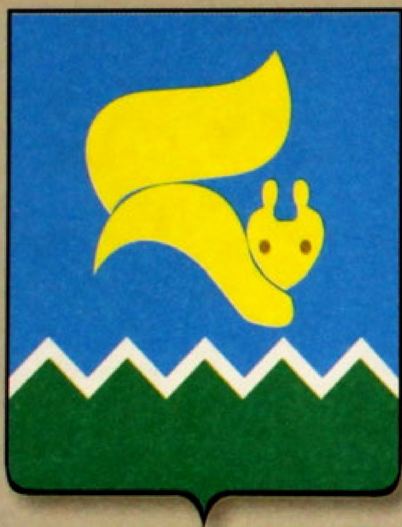
▲ Герб города Лангепас (1997).