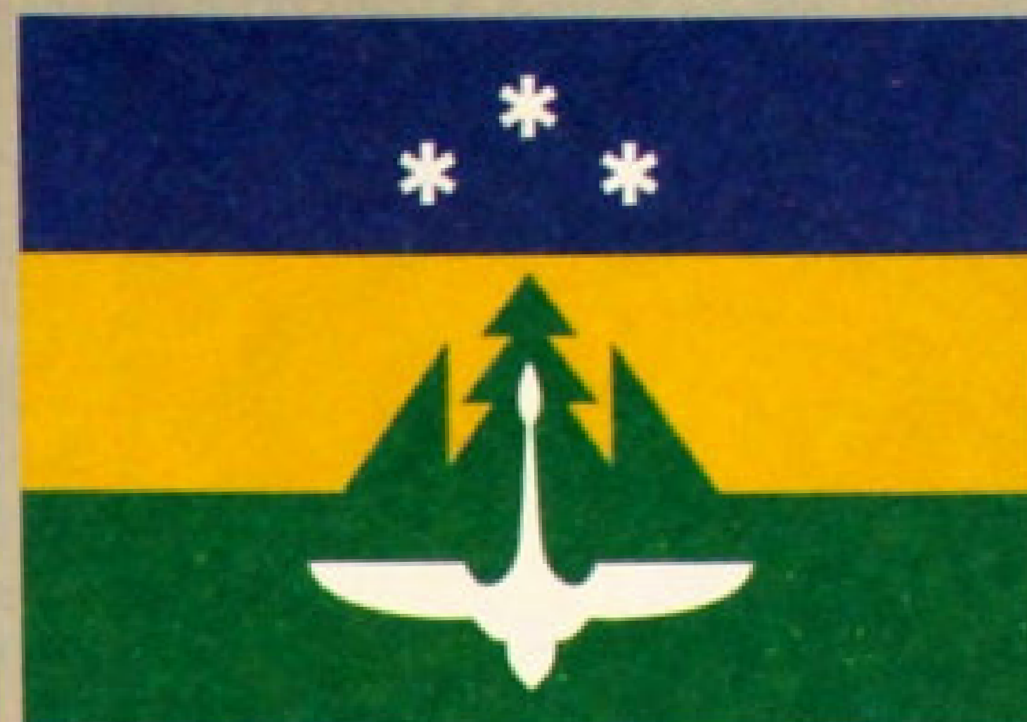
▲ Флаг города Ханты-Мансийск (2002).