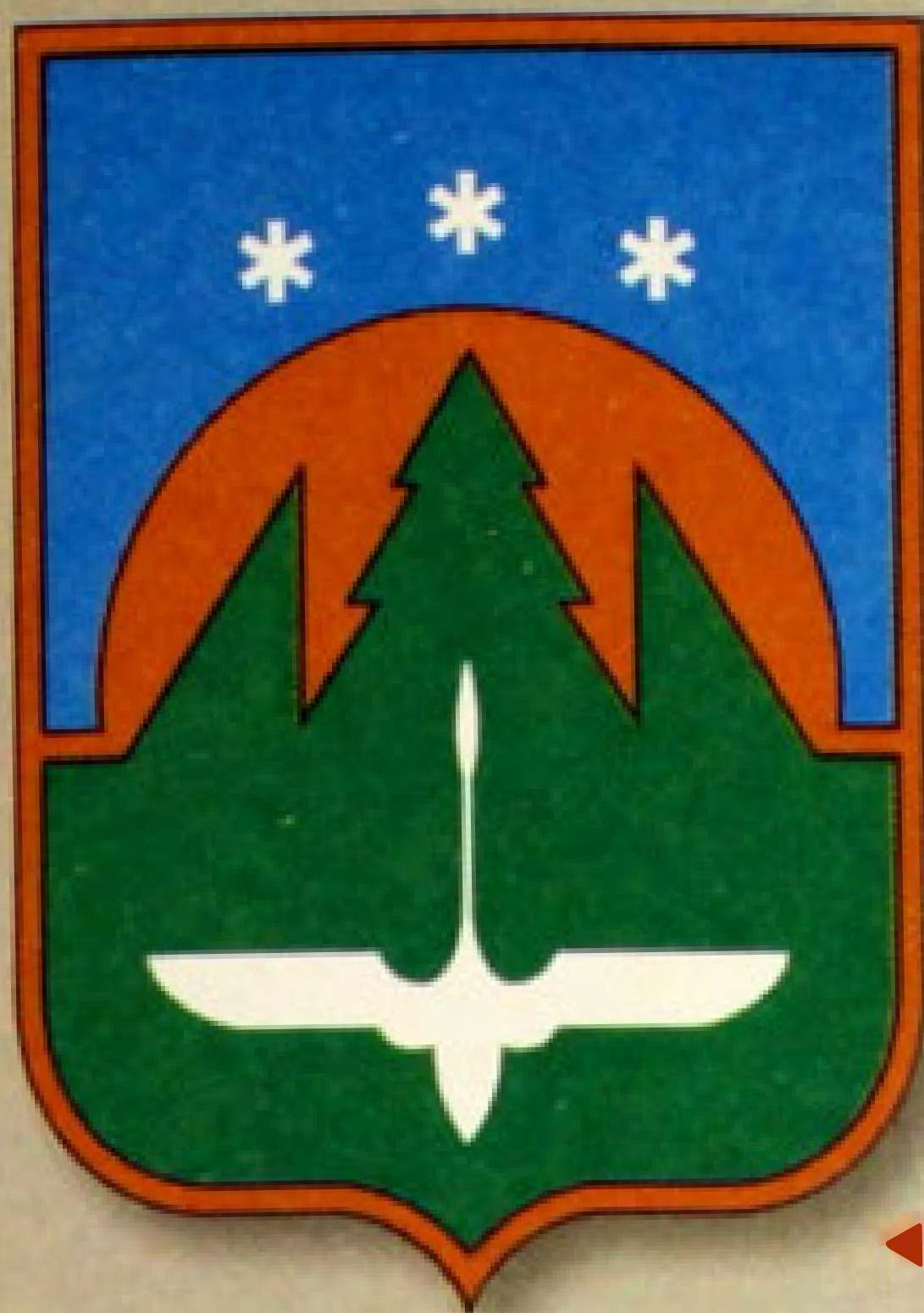
◀ Герб города Ханты-Мансийск (1995).