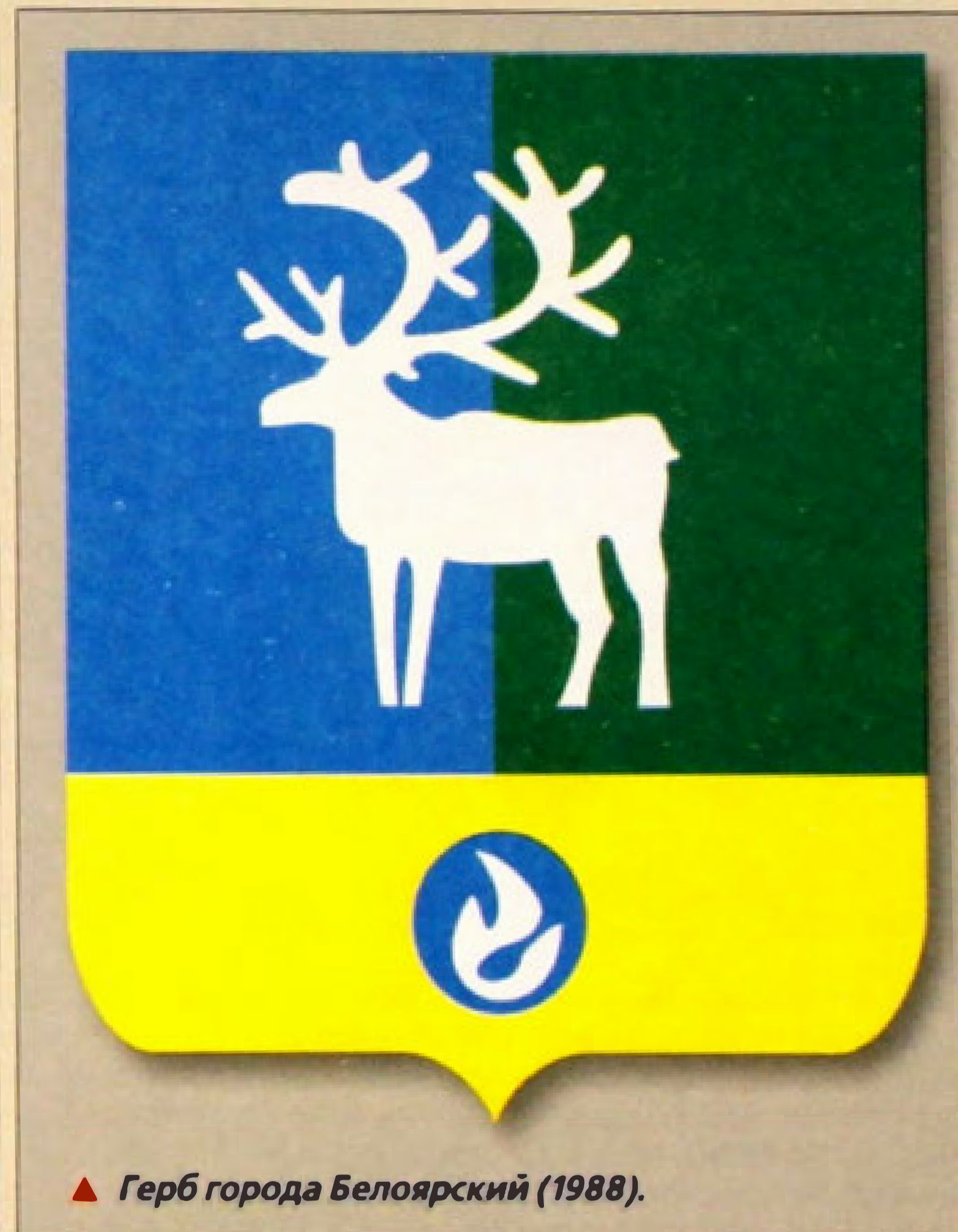
▲ Герб города Белоярский (1988).