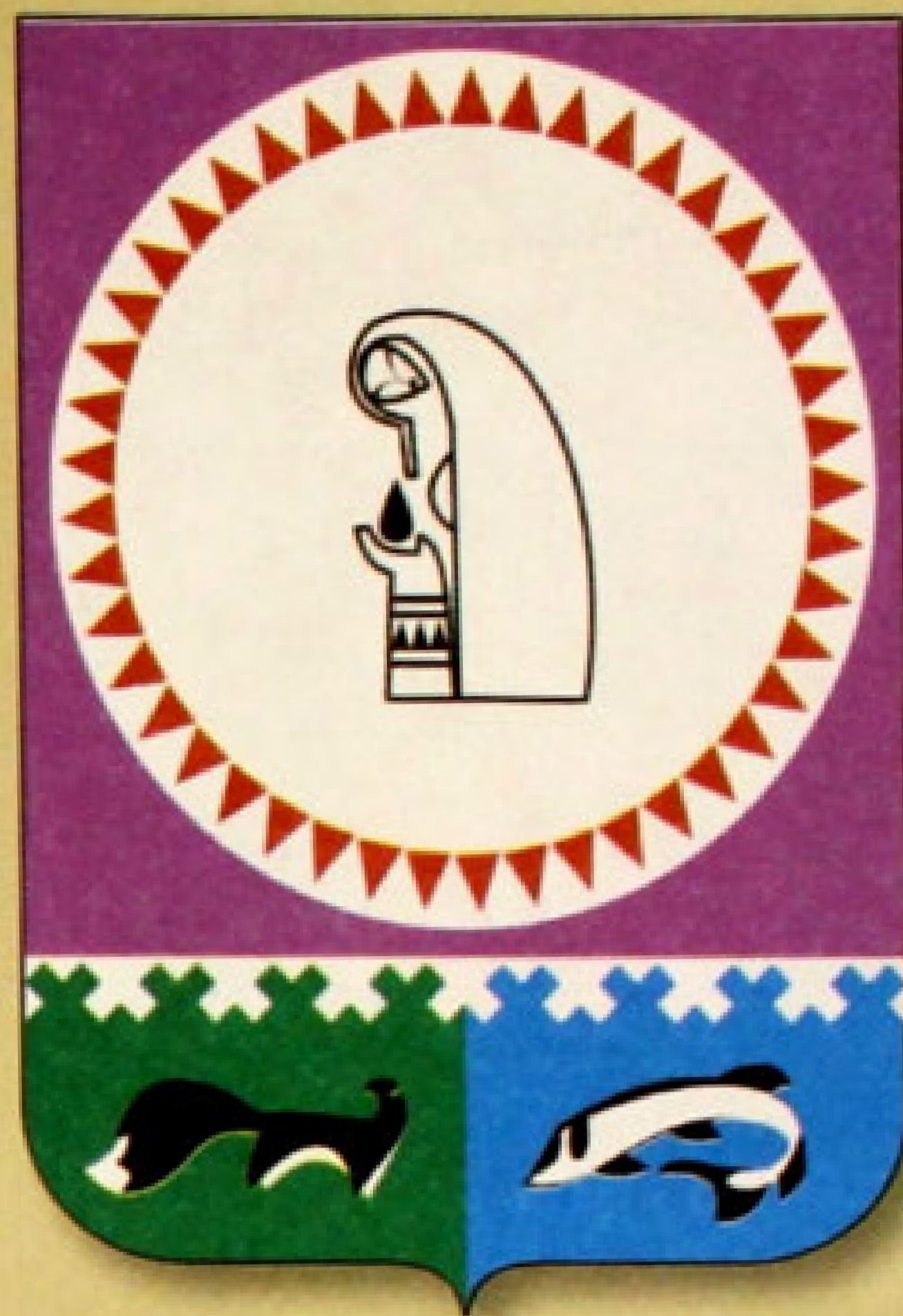
▲ Герб Октябрьского района (2001).

Октябрьский район расположен по обе стороны нижнего течения Оби. Его административным