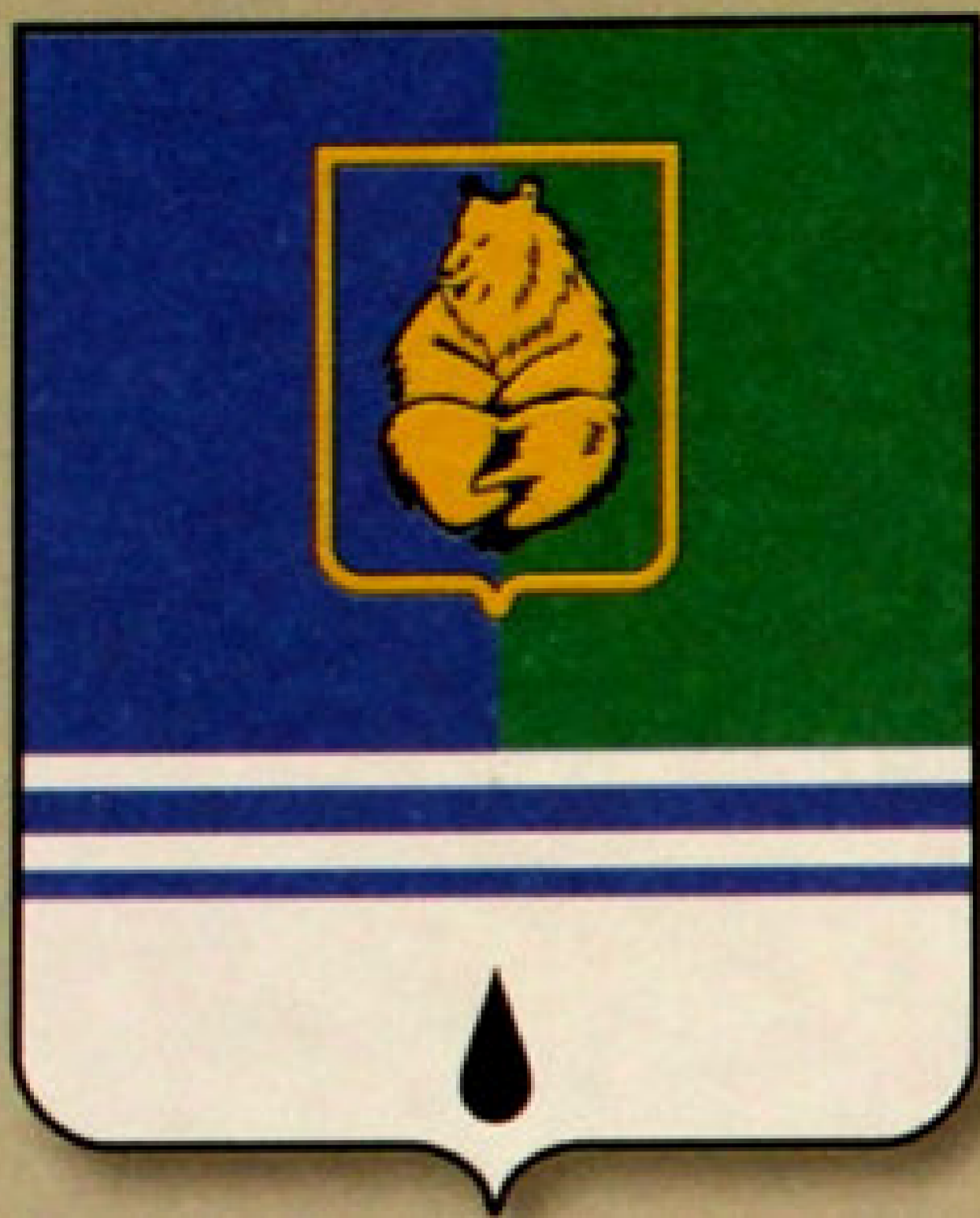
▲ Герб города Когалым (1998).

Город Нижневартовск расположен на севере Западной Сибири, в пределах Среднеобской