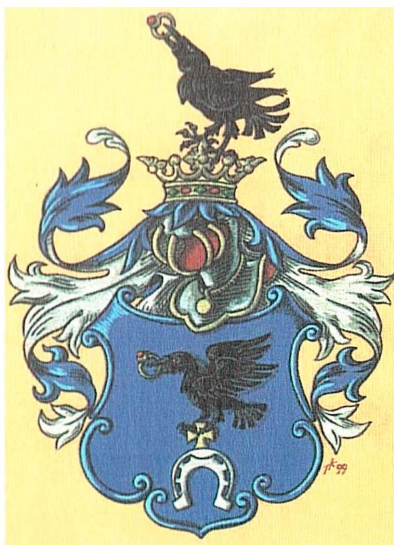
Рисунок Петра Федоровича Космолинского