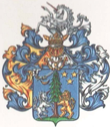
Герб рода дворян Мариных