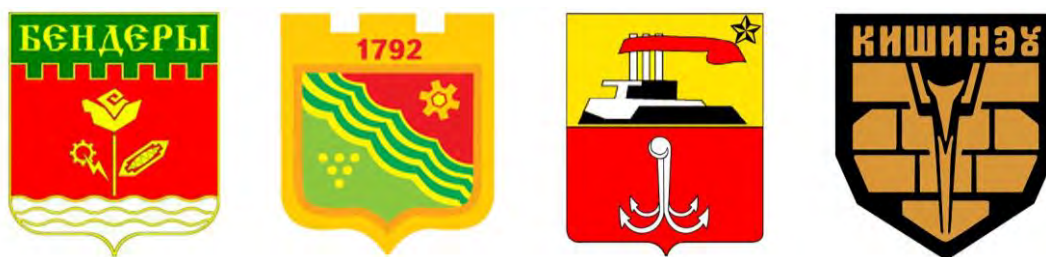
Рис. 4. (слева направо): официальные гербы городов Бендеры, Тирасполь, Одесса и Кишинёв, созданные при Советском союзе Fig. 4. (from left to right): official coats of arms of the cities of Bendery, Tiraspol, Odessa and Chisinau, created under the Soviet Union