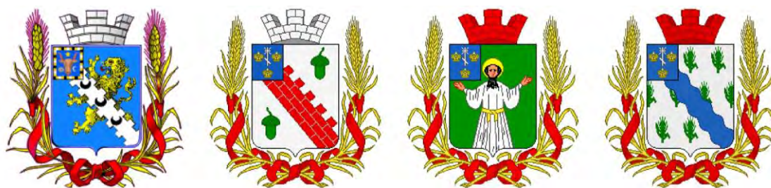
Рис. 2. (слева направо): гербы городов Бендеры, Тирасполь, Григориополь и Дубоссары, созданные после реформы русской геральдики Б. В. Кёне

Слева направо: сельскохозяйственные города, промышленные города, горные города Fig. 1. The project of additional decorations of city coats of arms according to the project of B. V. Kene (1869). From left to right: agricultural cities, industrial cities, mountain cities