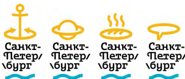
Рис. 3. Айдентика Санкт-Петербурга авторства Студии Артемия Лебедева (2014 г.) Fig. 3. The identity of St. Petersburg by the Artemy Lebedev Studio (2014)

Fig. 2. (from left to right): coats of arms of the cities of Bendery, Tiraspol, Grigoriopol and Dubossary, created after the reform of Russian heraldry by B. V. Kene