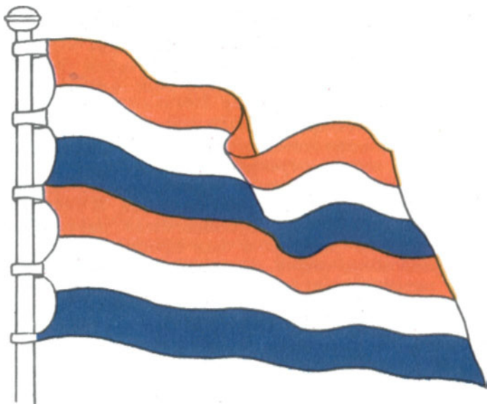
Флаг Нидерландов на кораблях морских гёзов. XVI век

Обычно гёзы отмечали морские победы кличем «Orañje boven!» (Оранский вверху) — [Оранский взял верх], и на мачту взлетало оранжево-белосинее полотнище. Оранжевая полоса всегда оставалась верхней, несмотря на то, что часто нидерландский флаг шивался не из трех, а из шести