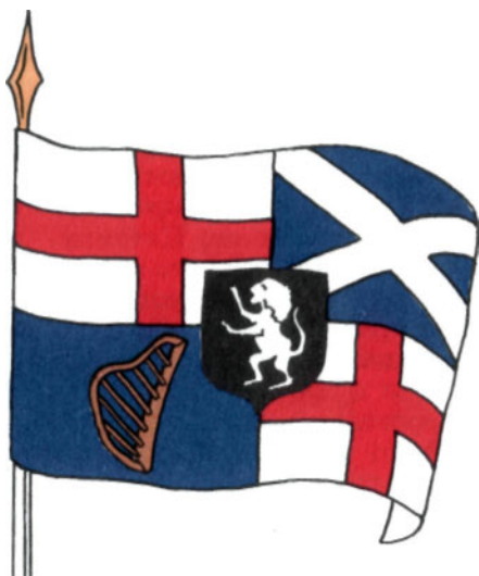
Личный штандарт Кромвеля. XVII век

На первый взгляд, равновеликие эмблемы двух народов на одном полотнище могли, казалось бы, означать их равноправный и добровольный союз. Но на деле это выглядело совсем иначе. Кромвель железной рукой в потоках крови задушил ирландскую независимость. Вслед за Ирландией подобная участь вновь постигла Шотландию. Это