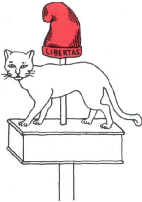
Знамя Спартака. I век до н. э. (реконструкция П. И. Белавенца)

Вечером 15 августа 1947 года более полумиллиона человек собрались на одной из площадей Дели перед стенами древнего Красного форта. Под грохот орудийного салюта и возгласы толпы: «Джай Хинди!», «Джай Хинди!» Джавахарлал Неру поднял государственный индийский флаг. Джавахарлал Неру торжественно заявил, что этот флаг никогда не будет служить агрессии против какого-либо народа.