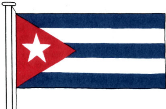
Флаг Республики Куба

лодежи под руководством молодого адвоката Фиделя Кастро напала на военные казармы в городе Сантьяго-де-Куба — столице провинции Ориенте. Это была героическая попытка поднять кубинский народ на борьбу против режима американского ставленника — диктатора Батисты.