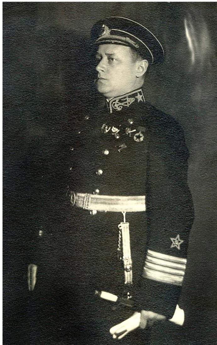
Адмирал И. С. Исаков в парадной форме. 1941 г. с шарфом (поясом) 2-го образца

состоящего из якоря и звезды. Рукава двušовные с прямыми обшлагами. Кантов на мундире не полагалось.