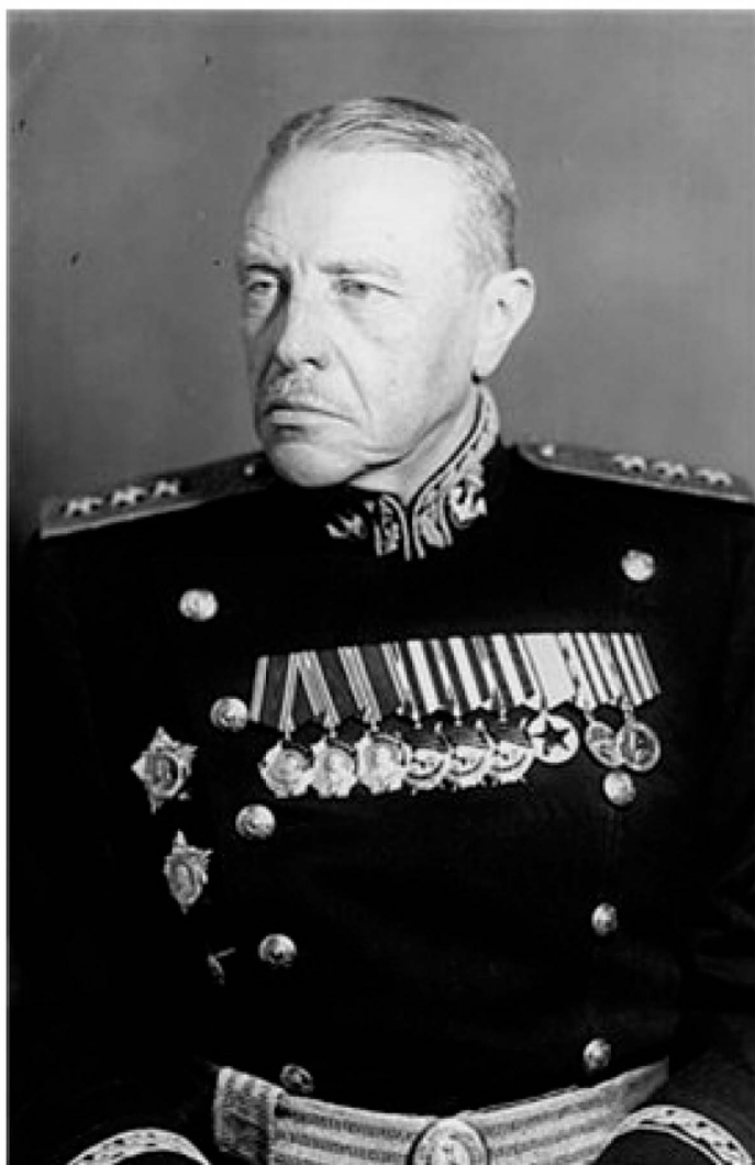
Адмирал Л. Галпер в мундире обр. 1945 г. с шарфом (поясом) 1-го образца