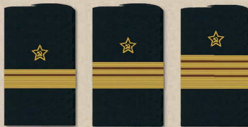
генерал-майор береговой службы генерал-лейтенант береговой службы генерал-полковник береговой службы