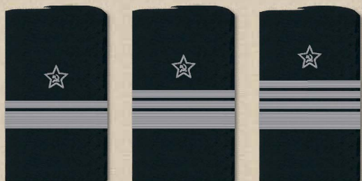
генерал-майор интендантской службы генерал-лейтенант интендантской службы генерал-полковник интендантской службы