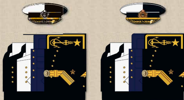
генералы авиации генералы береговой службы