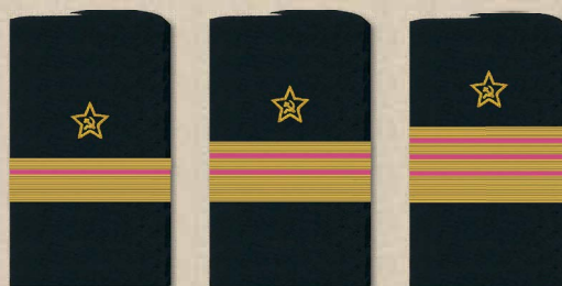
инженер-контр-адмирал инженер-вице-адмирал инженер-адмирал