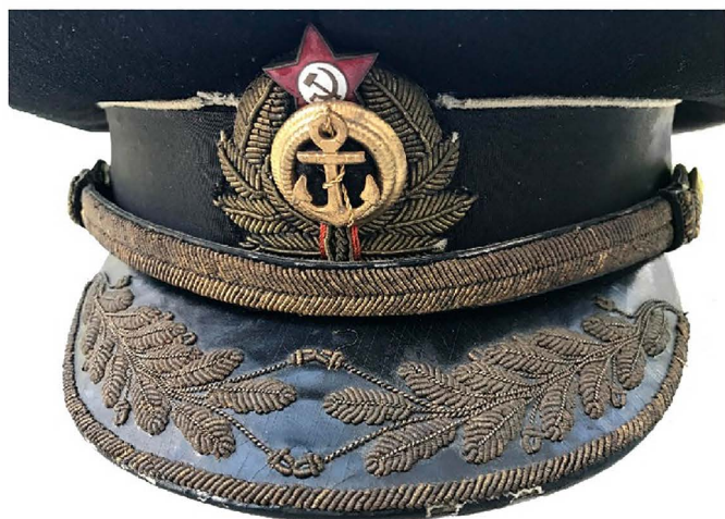
Фуражка парадная (хорошо виден шитый подбородный ремень)

Однако, уже 9 апреля 1941 года СНК СССР 5 постановил ввести для личного состава береговой обороны и авиации ВМФ форму одежды и знаки различия, принятые в Красной Армии. Кроме упомянутых категорий, в приказ Наркома ВМФ вошёл инженерно-технический состав береговой службы (это инженерно-технический состав береговой обороны и авиации ВМФ) и ветеринарная служба ВМФ. Эмблемы в петлицы для данной формы одежды полагались смонтированные на якорё 6 .