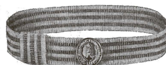
Фуражка парадная и шарф (пояс) 1-го образца