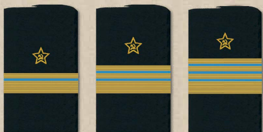
генерал-майор авиации генерал-лейтенант авиации генерал-полковник авиации