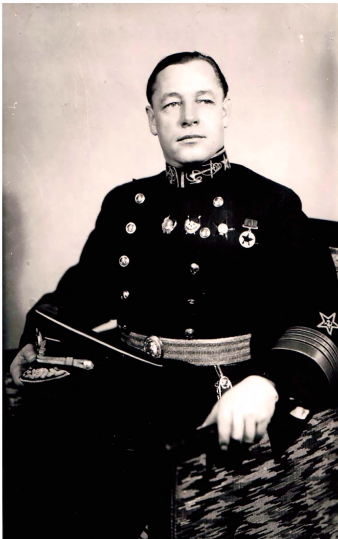
Адмирал Н. Г. Кузнецов в парадной форме. 1941 г. с шарфом (поясом) 1-го образца