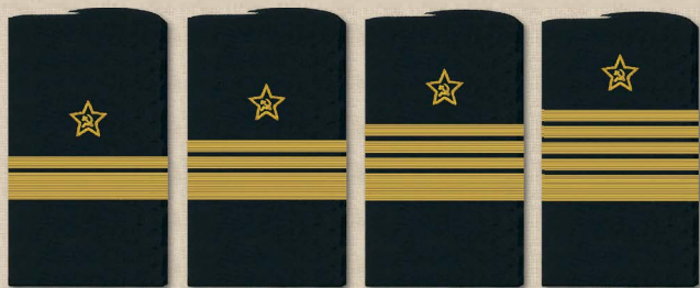
контр-адмирал вице-адмирал адмирал адмирал флота