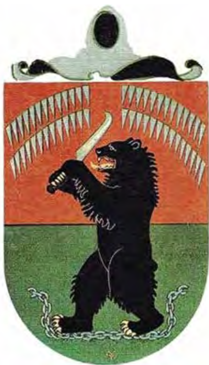
Ил. 1. А. Галлен-Каллела. Герб Восточной Карелии. Воспроизведено по: Восточная Карелия. Itä-Karjala. Helsinki, 1934