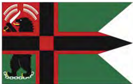
Ил. 5. Военный флаг Восточной Карелии. Рисунок автора