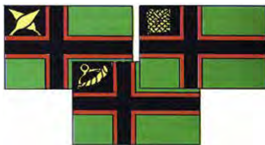
Ил. 6. Лоцманский, таможенный и почтовый флаги. Рисунок К. Лаурла.

присутствует зелено-красно-черная лента на уголке, указывающая на «дизайнерское» осмысление данных цветов уже в качестве как бы национального «триколора» (ил. 3).