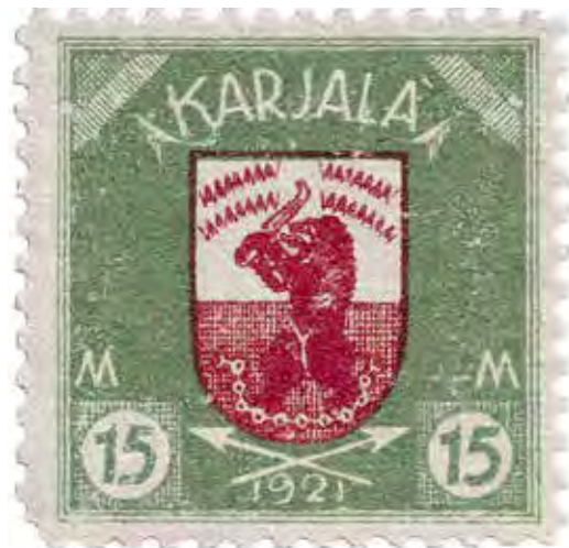
Ил. 4. Почтовая марка. 1921.