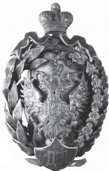
Рис. 2. Нагрудный знак для учащихся Демидовского юридического лицея. 1900 г.

На этом попытки утвердить наградные медали завершились. В 1816 г., вследствие начала кампании по борьбе с масонами, с должности министра народного образования был уволен граф А.К. Разумовский, пост покинул и П.И. Голенищев-Кутузов. Процесс утверждения медалей не был завершен, собственная символика у училища в начале XIX в. так и не появилась. Она возникла только в самом конце столетия, когда училище стало уже Демидовским