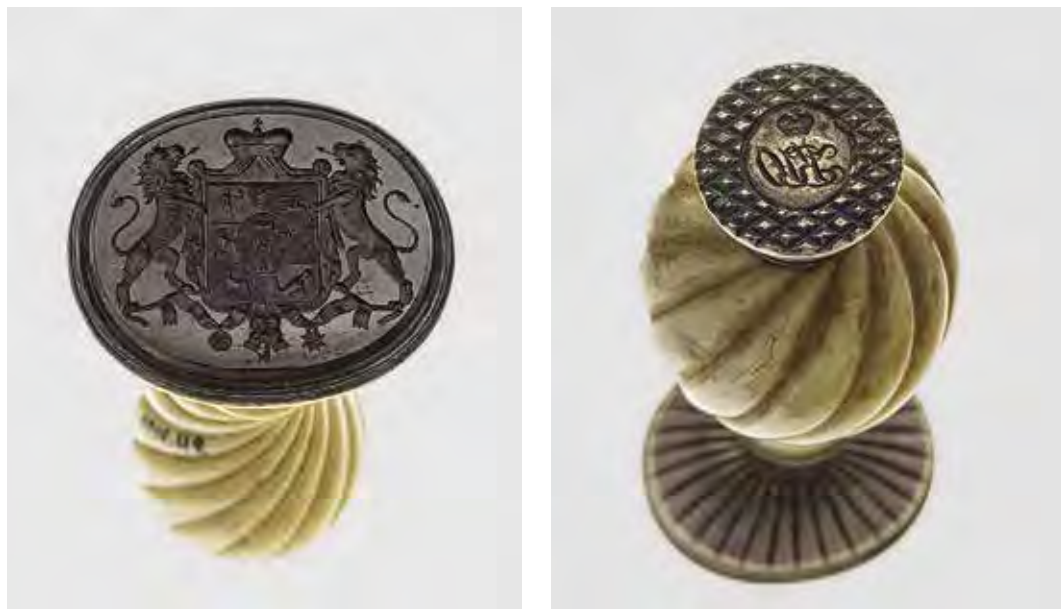
Ил. 1. Печать с гербом князей Юсуповых. Инв. № ЭРО-6789. Государственный Эрмитаж