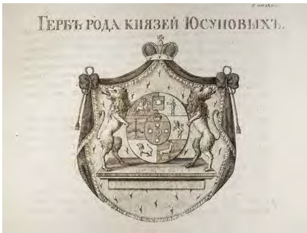
Ил. 2. Герб князей Юсуповых. Из: Общий гербовник. 1799. Ч. 3. № 2. Государственный Эрмитаж