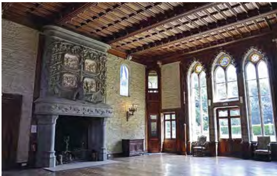
Ил. 5. Дымоход камин Гвардейского зала замка Кериоле. (Замок Кериоле, Франция. Официальный сайт https://www.chateaudekeriolet.com/ )