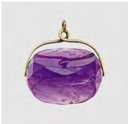
Ил. 7. Заготовка для печати. Инв. № ЭРО-6785. Государственный Эрмитаж

Таким образом, изучение печатей из фонда драгоценных металлов ОИРК, определение их владельцев и уточнение датировок позволило расширить перечень геральдических памятников, связанных с представителями этого известного княжеского рода.