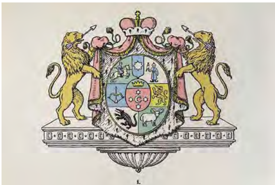
Ил. 3. Неутвержденный вариант герба князей Юсуповых (по С. Н. Тройницкому). Из: Гербовед. 1914. № 1. С. 4, ил. 1. Государственный Эрмитаж

отличия от вырезанного на матрице печати из ОИРК. В основном они касаются гербовых фигур, помещенных в малых щитках. На печати: 1) в первом малом щитке в верхней части помещена княжеская шапка вместо открытой «античной» короны, в нижней части полумесяц обращен вправо, у Тройницкого – влево; 2) во втором малом щитке отличается количество вершин у звезды; 3) в четвертой части герба у льва в пасти нет стрелы.