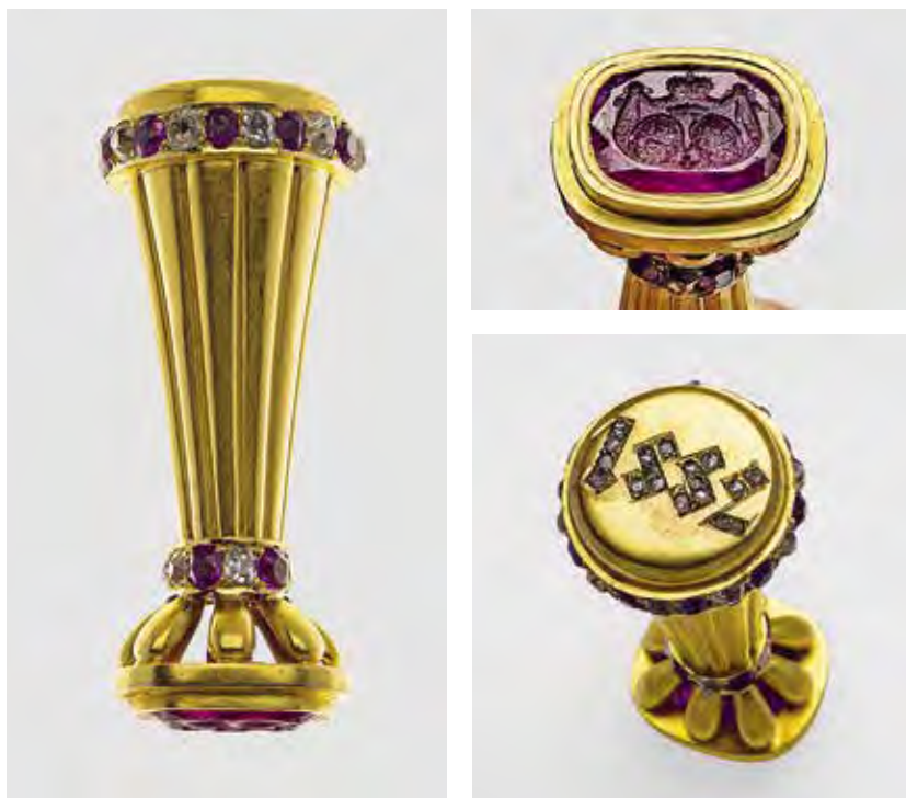
Ил. 6. Печать З. Н. Юсуповой с брачным гербом графов Сумароковых и князей Юсуповых. Инв. № ЭРО-6077. Государственный Эрмитаж

На «ветвях» древа помещены, по всей видимости, родовые гербы под коронами разного достоинства, изучение которых может стать темой отдельного исследования. На портале каминя еще один девиз: «TOUT EST HONNEUR ET LOYAUETE. TOUT EST LUMIERE ET VERITE» (Все есть честь и преданность. Все есть свет и правда) 27 .