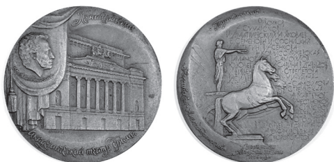
Рис. 2. А.А. Королюк. Медаль в память 225-летия Ленинградского академического театра драмы им. А.С. Пушкина. ЛМД, томпак, 1981. ГВСМЗ

бежъя, уделяя особое внимание традициям местной культуры и народным промыслам. В коллекции широко представлены штампованные сувенирные медали, знаки и значки в память посещения музейных и культовых объектов. На их фоне особое внимание привлекает медаль, исполненная неизвестным медальером в тяжелом металле, с изображением святых Псковской земли княгини Ольги и князя Гавриила (Всеволода) (рис. 3).