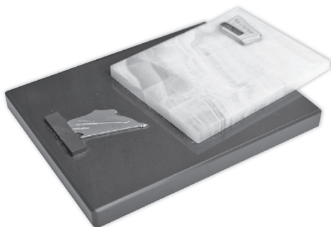
Рис. 5. Плакета в память 40-летия газеты «На смену!». Минерал, 1960. ГВСМЗ

В 1989 г. Ю.С. Мелентьев передал в дар Нижнетагильскому музею коллекцию из четырехсот предметов художественной керамики, экспонаты которой неоднократно выставлялись. Во Владимиро-Суздальском музее-заповеднике хранится часть нумизматического наследия Юрия Серафимовича, которая до настоящего времени не была представлена широкому вниманию и не публиковалась.