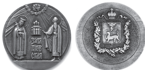
Рис. 3. Медаль в память посещения Псковской земли. Металл, 1980-е. ГВСМЗ

Мелентьев принимал активное участие в возрождении памятников архитектуры древних русских городов: Новгорода, Ярославля, Владимира, участвовал в работе Всероссийского общества охраны памятников культуры. Особая любовь связывала политика с Уральским краем. Об этом периоде жизни министра напоминают набор из четырех медалей 1984–1985 гг., посвященных Нижнему Тагилу, городу, где прошло его детство, и две плакетки: в память проведения Дней советской литературы в Асбесте (рис. 4) и 40-летия екатеринбургской молодежной газеты «На смену!» (рис. 5), редактором которой Мелентьев был назначен в 1959 г.